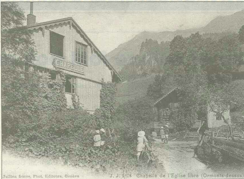
Chapelle de l'Eglise Libre, à Ormont-Dessus

Quelle fut exactement la genèse de l'Eglise libre d'Ormont-Dessus? Aucun document connu ne nous le dit expressément.