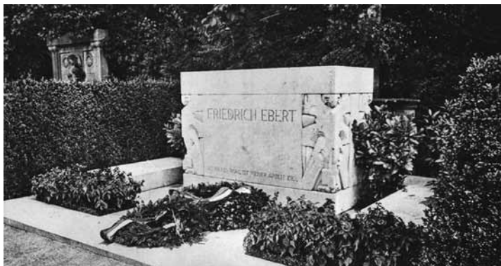
Varri i Fridrih Ebertit në Bergfriedhof, varrezat qendrore, në Heidelberg.

Kaq përmbledhtas, analiza për rrethanat dhe vështirësitë e kohës së Ebertit në detyrë nuk mund të ishte më precize. Partia tregoi respekt për arritjet e liderit të tyre të dikurshëm si kreu i republikës: “Ishte detyra e Ebertit që të parandalonte krizat duke i çuar ato në shkatërrim”. Në fakt, asnjë krizë nuk u shndërrua në shkatërrim. 1925-a, viti kur vdiq presidenti i parë i Rajhut, shfaqte për herë të parë një stabilitet relativ për Republikën e Vajmarit. Kjo, edhe për meritë të politikave të Fridrih Ebertit pas vitesh të tëra krizash dhe kundërshtish. Fridrih Eberti kishte bërë atë që një kre shteti mund të bënte, me vendosmëri dhe dedikim besimplotë ndaj idealit demokratik, duke mbajtur parasysh shoqërinë e segmentuar dhe të pabalancuar të republikës, shoqëri që mezi ishte paqësuar dhe që vuante prej një presioni të madh së jashtmi. Kur Eberti vdiq, Republika e Vajmarit humbi një prej pionierëve dhe shtyllave të saj.