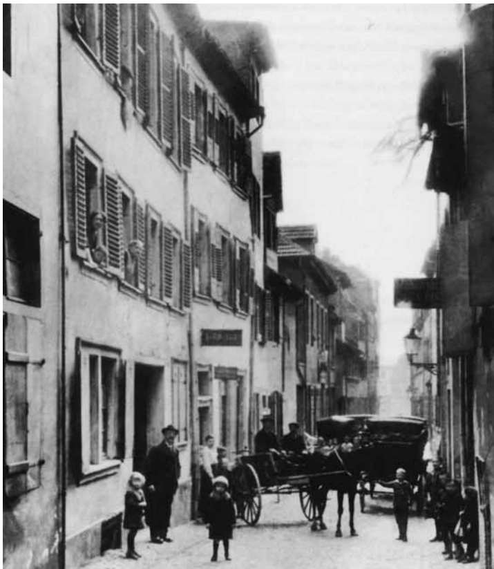
Pfaffengasse në Heidelberg në fillim të 1920-ës, ku Eberti lindi në 1871-shin.

që dëmtoi republikën, por ishte edhe përgjegjëse për tranzicionin e saj në diktaturë në janar 1933. Një qasje e tillë, nënvlerëson gjithësi parakushtin e periudhës revolucionare dhe kuadrin e ngushtë kohor. Për më tepër, ajo injoron tërësisht parimin bazë demokratik të Ebertit për t'u ofruar të gjithë qytetarëve të drejtën për pjesëmarrje politike si dhe vizion politik: republikën parlamentare. Ky ishte objektivi i tij kryesor, dhe fakti që ai ia doli ta arrinte këtë qëllim megjithë rrethanat e pashpresa të 9 nëntorit 1918, e bën atë në vetvete një arritje të madhe.