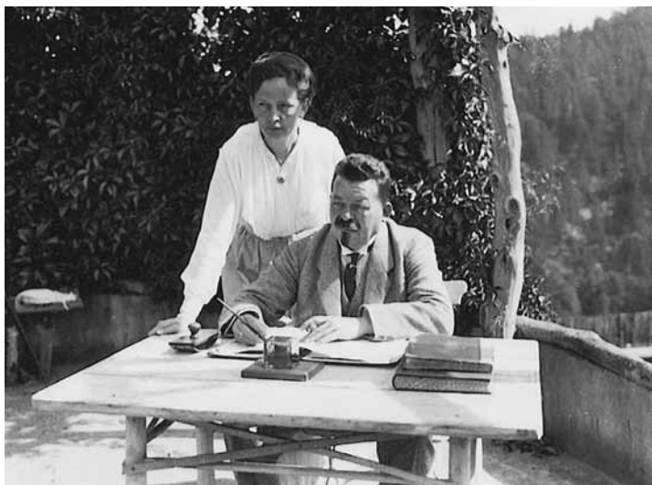
Fridrih dhe Louise Ebert gjatë pushimeve të tyre në Schwarzburg, 1919

do të kishte këmbëngulur më fort në vizionin e vet. Për shembull, ai nuk donte që ta aprovonte vendimin jashtëzakonisht të zbutur të Gjykatës Ushtarake ndaj vrasësve të Rosa Luxemburg-ut dhe Karl Liebknecht-it, që shumë njerëz e konsideronin një vendim skandaloz, ndërkohë që qëllimi i Ebertit ishte rihapja e procesit. Sidoqoftë ai u bashkua me shumicën e kabinetit. Fill pas kësaj, Gustav Noske (SPD), ministri i përgjegjshëm i mbrojtjes, konfirmoi verdiktet, duke e zbehur mundësinë për të dhënë drejtësi.