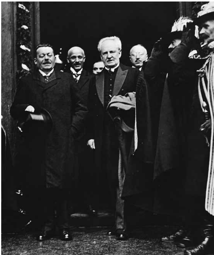
Fridrih Eberti dhe Gerhart Hauptmanni

Spießbürger ”), një revolucionar vetëm me fjalë (“ Mundrevolutionär ”) dhe i keqarsimuari shalëpunues i Rajhut (“ Reichssattler ”) me një kalibër të pamjaftueshëm intelektual, një “socialdemokrat mediokër”, “bir rrobaqepësi, shalëpunues endacak, pijanec, gazetaruc, sekretar partied dhe arkëtar”, i paaftë e i pavlefshëm për të mbajtur zyrën më të lartë publike. Këto shigjeta të helmatosura në mënyrë brilante ishin drejtuar kah kreu i shtetit, por ato gjithashtu synonin republikën dhe e përçmonin demokracinë e re të