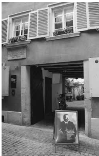
Vendlindja e Frifrih Ebertit, sot hyrja për në Memorialin në Pfaffengasse

1962-shit, Fondacioni Fridrih Ebert dhe qyteti i Heidelbergut iniciuan një ekspozitë në shtëpinë ku u lind Eberti. Në vitin 1982 u bënë përpjekje për ta zgjeruar këtë ekspozitë në një memorial kombëtar. Kjo për shkak se dukej sikur Eberti nuk u shfaq midis figurave historike të mirënjohura. Bundestagu gjerman kaloi ligjin për themelimin e Fondit Memorial të Presidentit të Rajhut Fridrih Ebert, kundër votave të Partisë së Gjelbër në vitin 1986.