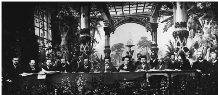
(Fridrih Eberti, në qendër si një prej dy presidentëve të Konventës së SPD-së në shtator 1904 në Bremen.)

socio-politike, duke e pasuruar kështu më tej njohjen e tij të përgjithshme ligjore. Po ashtu, posti si sekretar i punëtorëve ishte një prej mundësive më të mira për karrierë brenda lëvizjes punëtore socialiste. Për shkak të njohjes së mirë të disa fushave të ndryshme ligjore nga ana e Ebertit, “avokati i njerëzve” vlerësohej shumë në rangun e vet.