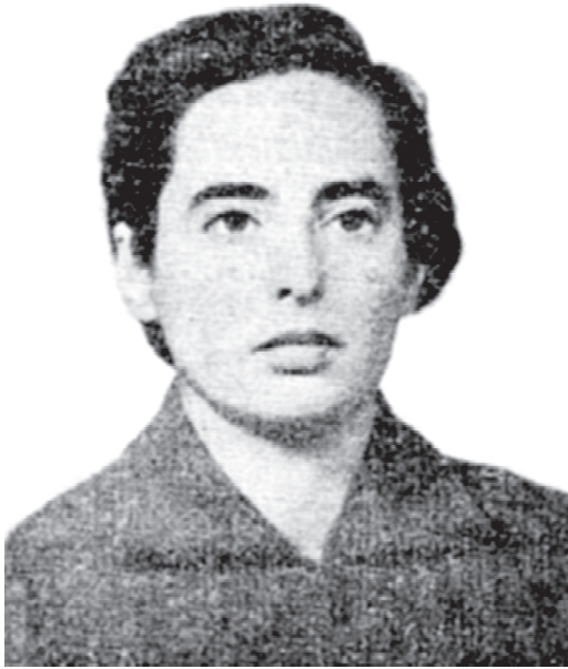
Fig. 1. Dra. María Marta Grassi.

Su notable vocación docente permitió la publicación de diferentes notas de clases criptogámicas (Grassi, 1968, 1971, 1975) contagiando a sus estudiantes la pasión por estos organismos. Falleció el 18 de junio de 2005 en San Miguel de Tucumán, a los 83 años de edad.