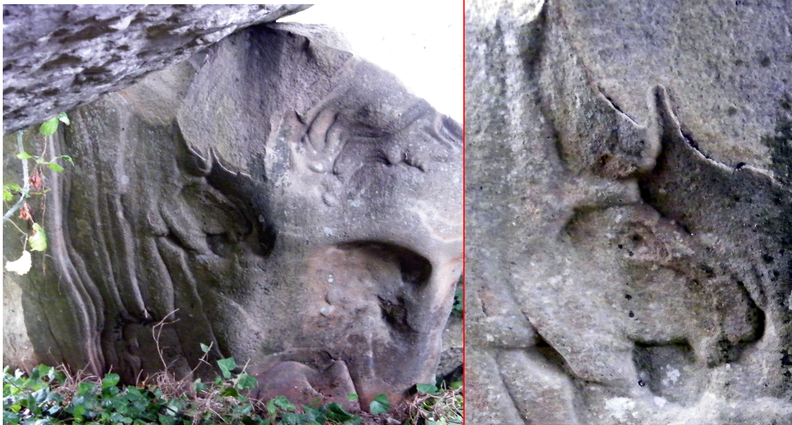
Fig. 7 :Dolmen de La Pagerie, Gennes, 49, L'orthostate en « gogotte » retouchée et détail. Tête de taureau ? De Cheval ? GPS : Lat. 47.339283 - Long. -0.25655.