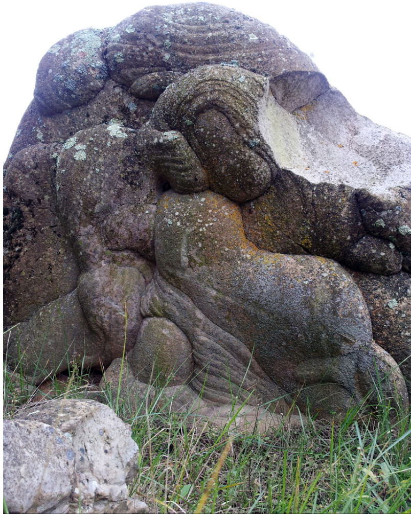
Fig. 6 : La « Gogote » près du Dolmen d'Etiau, Coutures, 49, GPS: Lat. 47.384667 - Long. -0.352333.