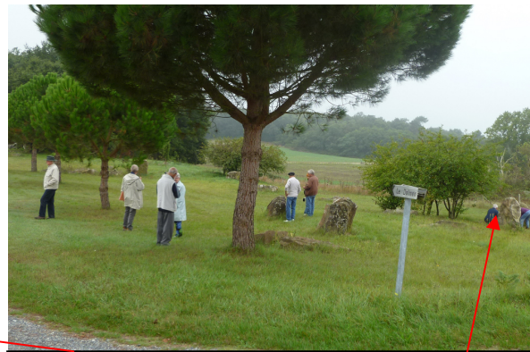
Fig. 8 : Coutures, dolmen d'Étiau. La « gogotte »