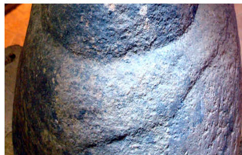
Fig.5 : Détails de la gravure des bras et des mains.