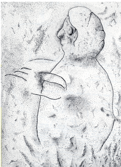
Fig. 4 : La « Vénus à la capuche » de la grotte de Gabillou, Dordogne, Magdalénien, +/- 17,000 ans.