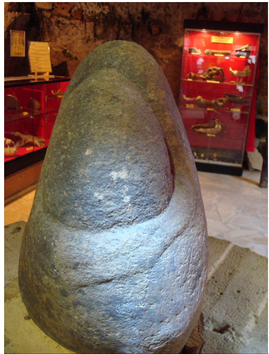
Fig. 1 : la statue dans le musée de la grotte de Saint Cirq du Bugues.

Elle évoque une « Madone », une femme sans visage, anonyme, dans laquelle chacun ou chacune pouvait se reconnaître ou y trouver une puissance supérieure non humaine. Bien entendu, rien ne nous permet d'affirmer que ce soit une femme, si ce n'est ce ventre proéminent, comme une femme enceinte. L'hypothèse est recevable.