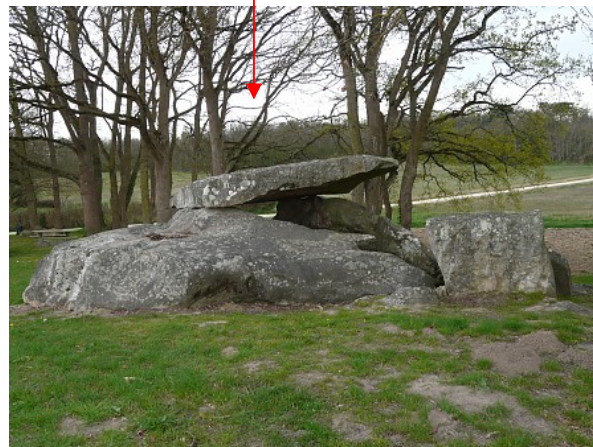
Fig. 9 : Coutures, dolmen d'Étiau, 49.