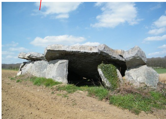
Fig.10 : dolmen de la Pagerie, Gennes, 49.