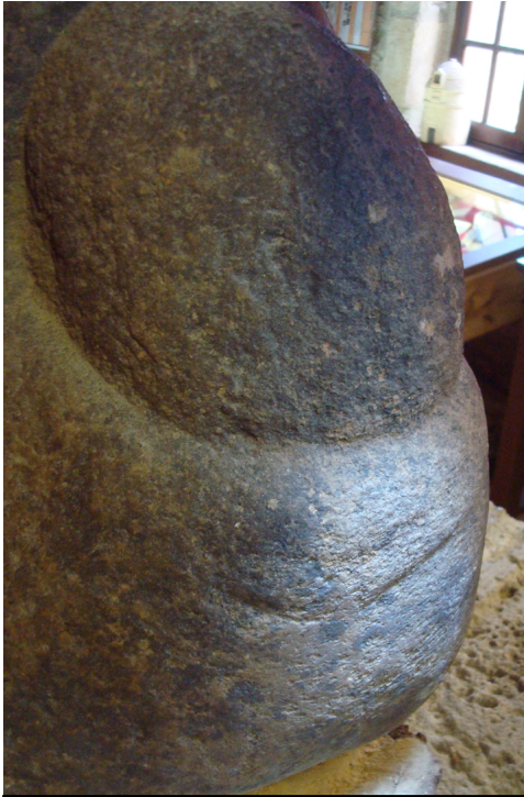
Fig.2 : La « statue menhir » de Saint Cirq, 24 (H. 50cm, l. 40cm.).

Prophylactique ? Divinatoire ? Rite de fécondité ? Germination de la terre au Néolithique ? Pour la technique et le support, nous ferons le rapprochement également avec cette énorme formation en Gogotte sacralisée dans deux monuments mégalithiques en Anjou.