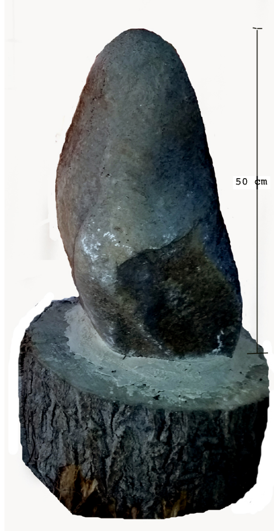
Fig. 3 : vue de dos et traces de polissage