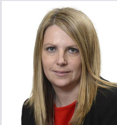
Hannah Blythyn AC Y Dirprwy Weinidog Tai a Llywodraeth Leol

Bydd yr argymhellion o'r Ymarfer Cwmpasu yn ffurfio'r cyfeiriad yr ydym yn targedu ein gwasanaethau wrth fynd ymlaen, ac rwy'n disgwyl i'r holl sefydliadau ar draws y sector wneud eu rhan yn hyn.