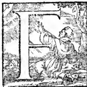
a ¶ Gentiles ecclesie persecutores.

Actum est autem, cum audisset Sanballat, quod aedificaremus murum, iratus est valde: Et motus nimis subsannauit Iudeos, & dixit coram fratribus suis & frequentia Samaritanorum. Quid Iudæi faciunt imbecilles? Num dimit-