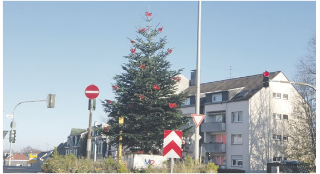
(SvG) Auch in diesem Jahr stiftete der Marketingrat Lüttringhausen eine wunderschöne Tanne als Weihnachtsbaum auf der Kreuzung Eisenstein und kümmerte sich auch um Schmücken. Abends ist der Baum hell erleuchtet und begrüßt alle Heimkehrenden.