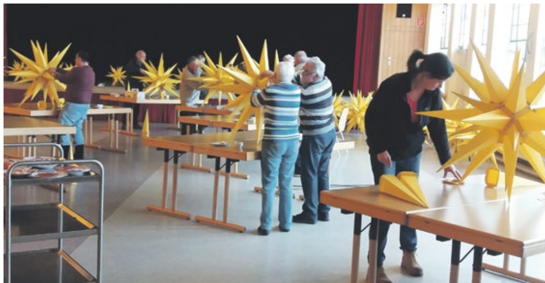
(red) In der Vorwoche wurden die Herrnhuter Sterne im CVJM-Haus an der Gertenbachstraße repariert, damit sie tags darauf wieder im Lütterkuser Dorfkern aufgehängt werden konnten. „Bei dieser regelmäßigen Reparaturaktion hat sich unlängst eine kleine eingespielte Reparaturgruppe gebildet, neue Mitglieder sind aber immer herzlich willkommen“, sagt