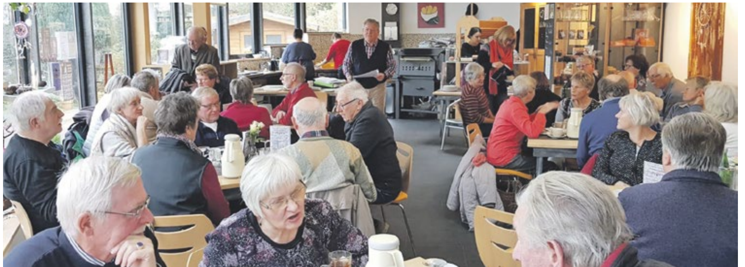
Im Backhaus der Augusta Hardt Horizonte waren zum ersten Treffen der Trümmerkinder alle Tische belegt.

Erstes Treffen der „Trümmerkinder“ weckte in Vielen Erinnerungen.