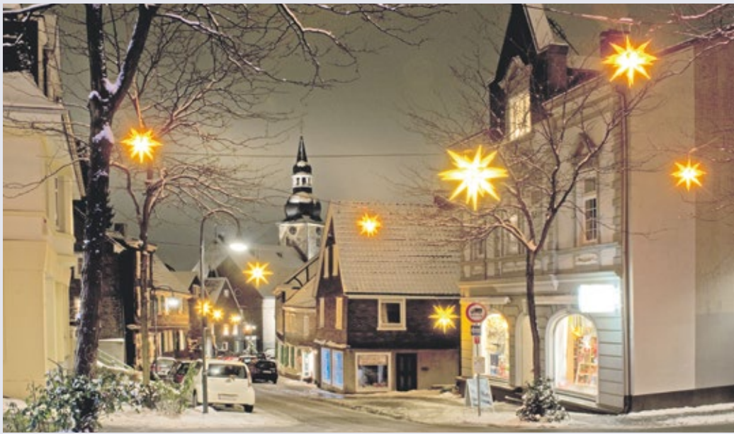
Ab dieser Woche erstrahlt der Lütterkuser Sternenhimmel wieder.

(red) Das Lütterkuser Sternendorf berührt die Menschen nachhaltig, also Bürger, Unternehmer und auch Touristen. Die Herrnhuter Sterne sind ein Symbol für die Identifikation mit dem Dorf und Zeichen der Solidarität der Lüttringhauser untereinander. Wer sich an der Spendenaktion beteiligen möchte, ist herzlich aufgerufen sich unter folgenden Spendenkonten zu benutzen: