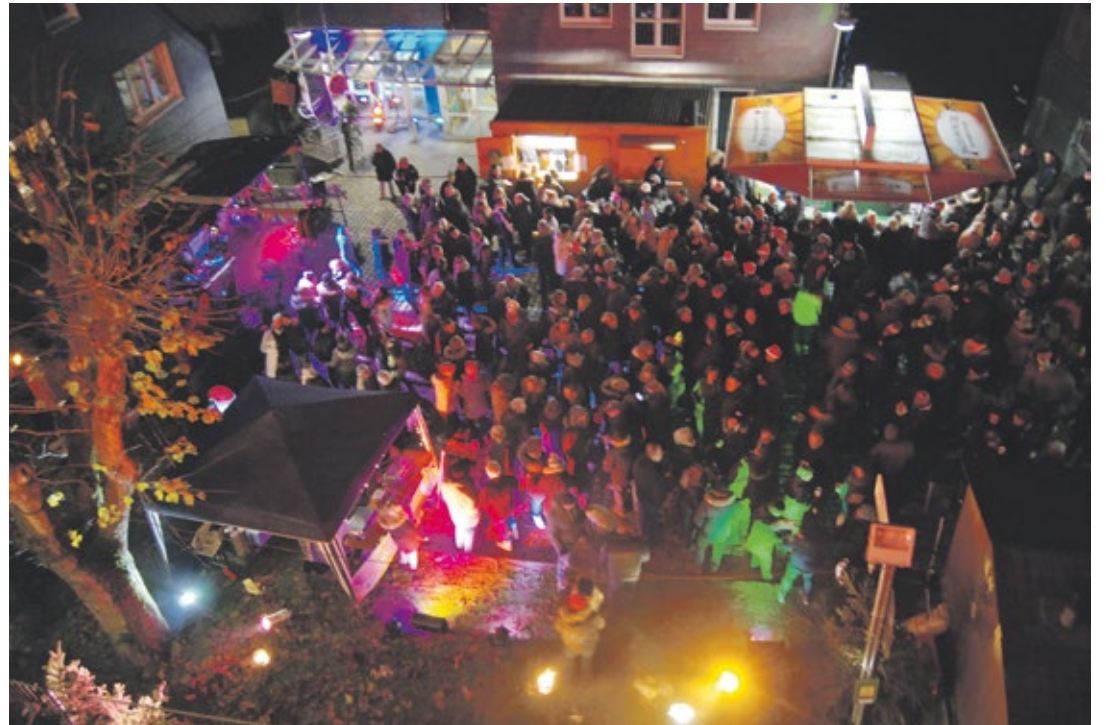
Die XMAS-Party im letzten Jahr war sofort ein großer Erfolg.

Bezahlt wird elektronisch mit Bändchen. Karten gibt es online: www.golden-eagle.club für 5 Euro. Abendkasse: 7,50 Euro.