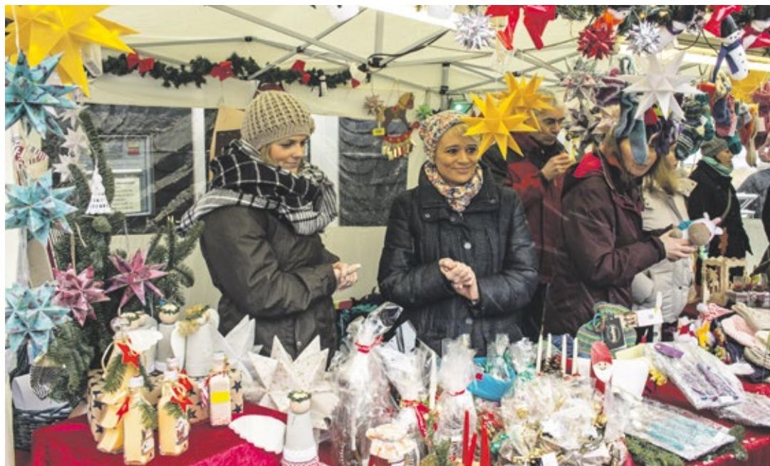
Das Angebot wird bunt und lecker. Foto aus dem Fotobuch „Wir in Lüttringhausen“ von Wolfgang Varenholt

Die 2. XMAS-Party, der 42. Ideale Lüttringhauser Weihnachtsmarkt und der verkaufsoffene Sonntag locken ins Dorp.