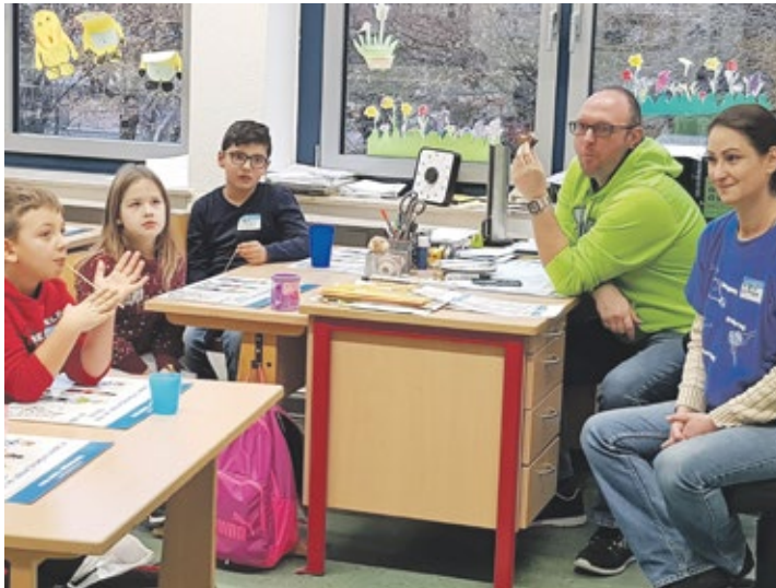
Die Aktion „Mehr bewegen - besser essen“ begeisterte die Schüler.