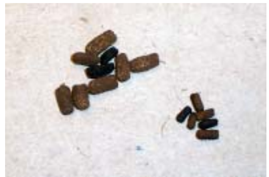
Figur 2. Spillning av läderbagge (vänster) och en guldbagge-art (höger). Läderbaggespillning är större och plattad, till skillnad från guldbaggar som har mindre, mer cylindrisk spillning. Yngre larver av läderbagge lämnar mindre spillning som är svårskild från spillning av Gnorimus -arter, varför man bör leta efter fullväxta larvers spillning som är 6-7 mm lång.