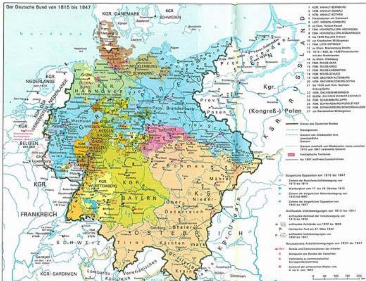
territoriale Gliederung Mitteleuropas im Ergebnis des Befreiungskrieges

um Abschluss der Veranstaltung unterzeichneten die anwesenden Partner eine Kooperationsvereinbarung. Darin wird die Verfahrensweise geregelt, wie die beteiligten Vereine, ehrenamtlichen Akteure, Gemeinden und Leader-Aktionsgruppen zur Verwirklichung des Leitprojektes zusammenarbeiten wollen. Grundsatz ist, dass die Rechte und Pflichten der Beteiligten unberührt bleiben, diese jedoch ihre Aktivitäten untereinander abstimmen und Vorhaben gemeinsam durchführen.