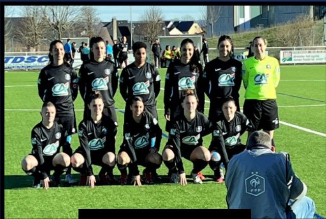
CHASSIEU DECINES FC