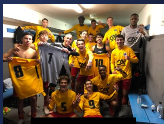
AS ST PRIEST