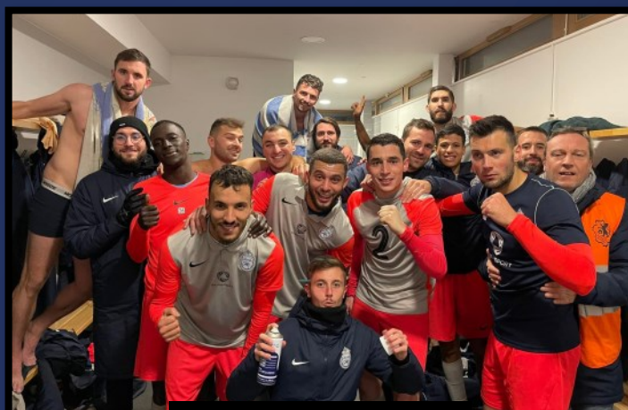
FC ST CYR COLLONGES