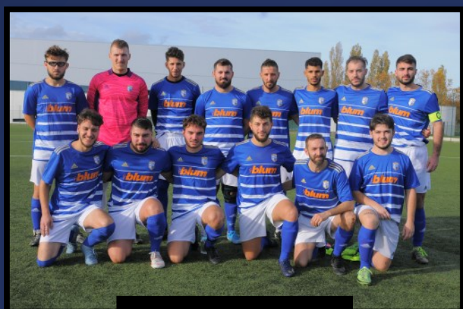
US VILLETTE JANNEYRIAS