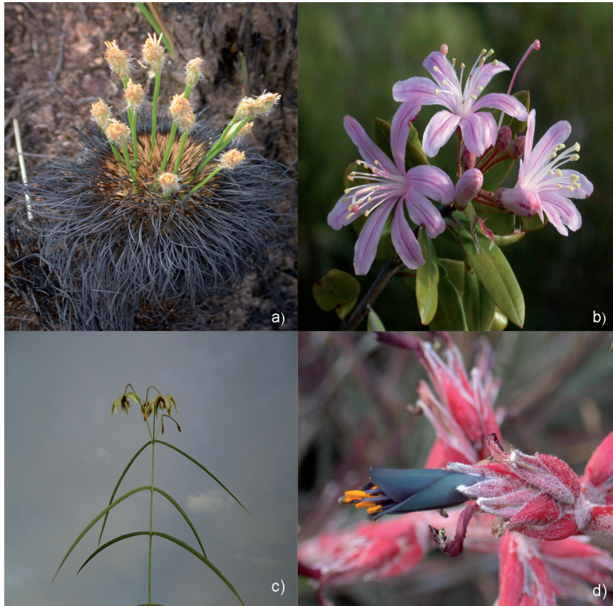
Figura 3. Especies características de las sabanas montanas en la región Madidi: A. Bulbostylis paradoxa , B. Bejaria aestuans , C. Blepharodon lineare , D. Puya reducta .