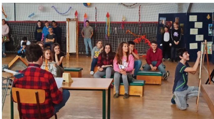
Az 7. osztályosok előadása