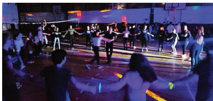
A báلكirály és a báلكirálynő tánca