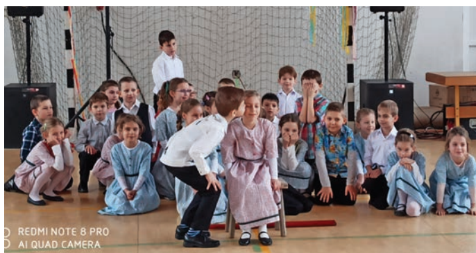
Az 1. osztályosok előadása