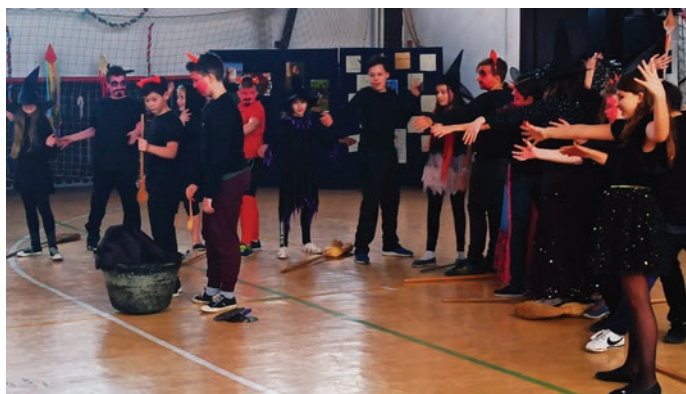
Az 5. osztályosok előadása