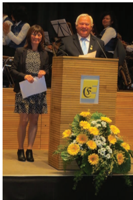
Jó hangulatú köszönőbeszéd a kitüntetés átvétele után