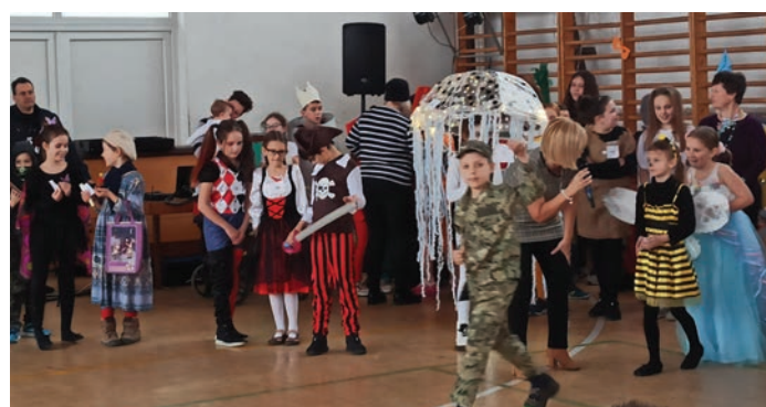
A jelmezek bemutatkozása