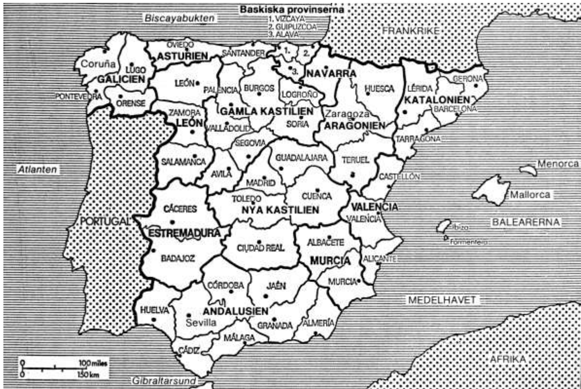
Spaniens regioner och provinser