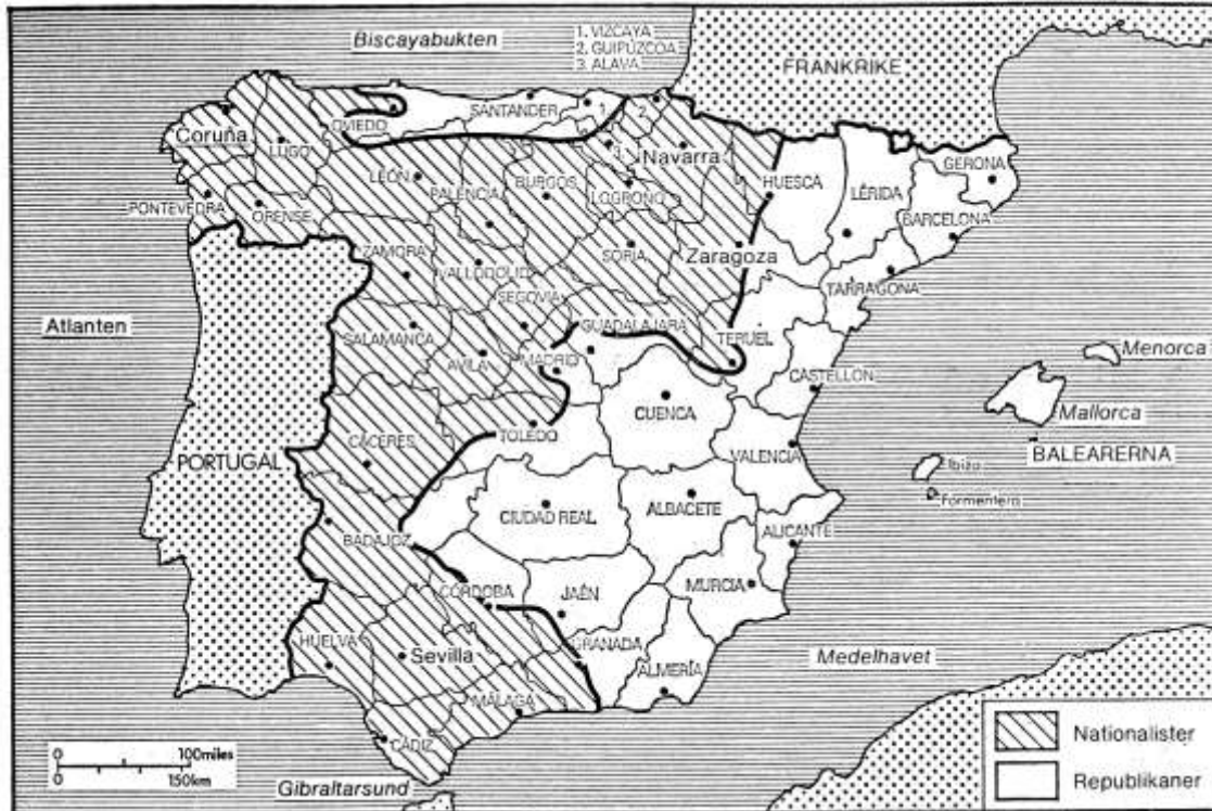
Spaniens uppdelning, mars 1937