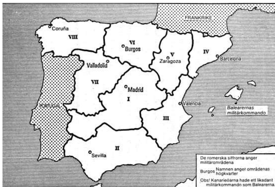
Spaniens militära indelning 1936

Azañas regering hade sett till, som man trodde, att samtliga divisionsbefälhavare var republikaner. Och det visade sig att endast general Cabanellas i Zaragoza, den femte divisionens befälhavare, deltog i Molas planer. De andra var fientligt inställda. Molas plan gick ut på att dessa fientligt sinnade divisioner och de andra enheter som var beroende av dem skulle tas om hand av andra generaler eller överstar, som antingen tjänstgjorde i vederbörande stad eller speciellt sändes dit.