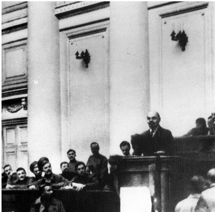
Bilden: Lenin presenterar sina "aprilteser"