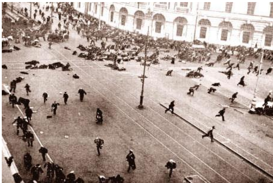
Juli-dagarna – trupper utkommenderade av den provisoriska regeringen har just öppnat kulspruteeld mot demonstranterna

Den provisoriska regeringen var vid denna tidpunkt hårt trängd bl a därför att den militära offensiv som startats i juni höll på att misslyckas och beslöt att slå till mot demonstrationen, som stämplades som ett upprorsförsök, organiserat av bolsjevikerna, trots att bolsjevikledarnas bestämt hävdade motsatsen. Regeringen beordrade lojala trupper (officersaspiranter och kosacker) mot demonstrationen. Dessa trupper öppnade kulspruteeld mot massorna, varvid flera hundra dödades och ännu fler skadades.