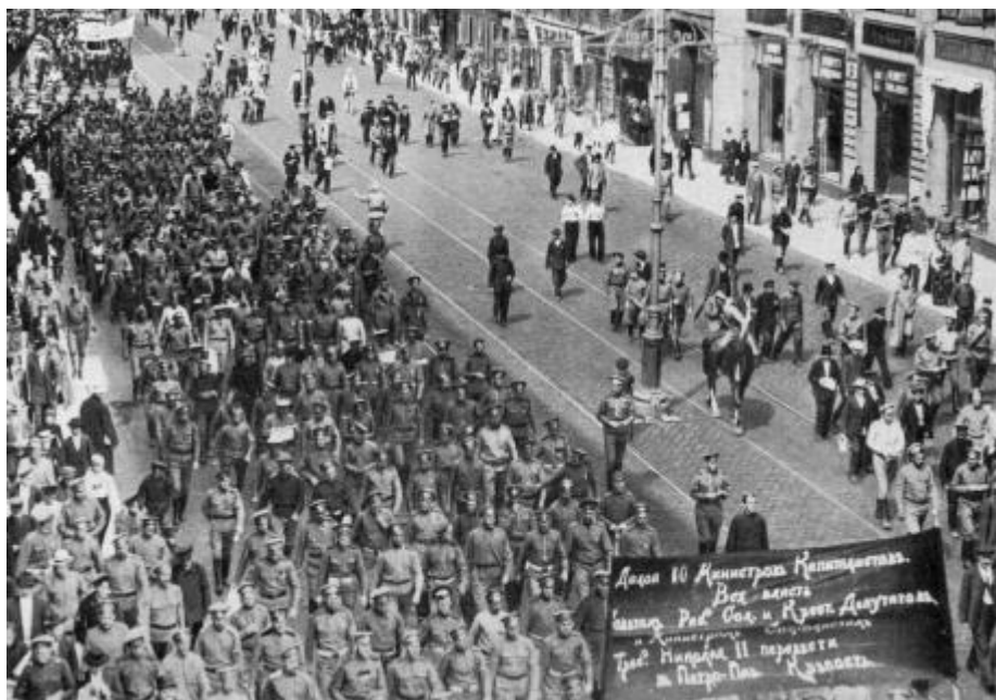
Demonstrationen den 18 juni. På banderollerna står: "Ned med de tio kapitalistministrarna!" och "All makt åt sovjeterna!"

Och för att gripa initiativet från bolsjevikerna beslöt så sovjetkongressen att den 18 juni själv anordna en demonstration under parollerna "Allmän fred", "Omedelbart inkallande av en konstituerande församling" och "Demokratisk republik". Bolsjevikerna antog utmaningen och beslöt att sluta upp i demonstrationen med sina egna paroller. Den 18:e juni blev en chock för mensjevikerna och socialistrevolutionärerna: I demonstrationen, som samlade över 400000 deltagare, dominerade helt de bolsjevikiska parollerna – "Ned med de tio kapitalistministrarna!" "Ned med offensiven!" och "All makt åt sovjeterna!". Detta visade att stämningarna i åtminstone huvudstaden hade kantrat ordentligt åt bolsjevikernas håll.