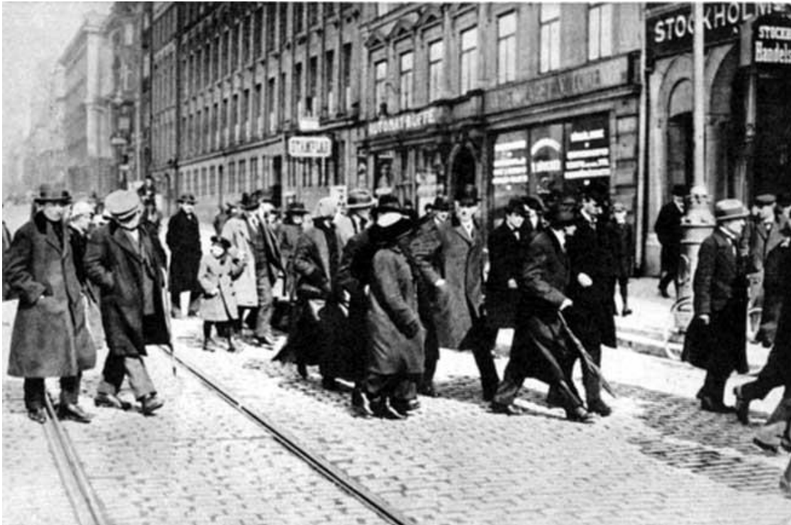
Lenin tog sig till Ryssland via Stockholm. Bilden ovan visar Lenin (mannen med paraplyet i höger hand) och är från 31 mars (13 april)

Av protokollet framgår bl a att Stalin vid konferensen förespråkade "påtryckningar" mot den provisoriska regeringen och att man borde stödja denna "i den mån dess linje är att tillfredsställa arbetarklassens och de revolutionära böndernas krav i den pågående revolutionen". Stalin argumenterade vidare för att enhet med mensjeviker var möjlig "längs Zimmerwald-Kienthals linjer" (dvs de mensjeviker som var emot fosterlandsförsvaret). Som redan torde ha framgått och som kommer att bli mycket tydligt i fortsättningen så stod dessa ståndpunkter i skriande motsättning till Lenins linje.