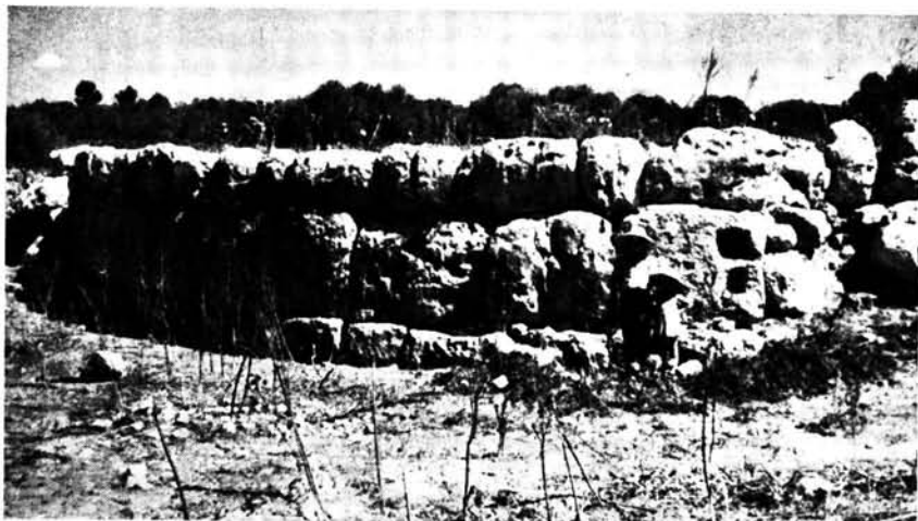
Talaiot de planta circular en ruinas de S'Era (So N'Oliver). Es uno de los bloques de su paramento exterior se ven dos capas de moro.