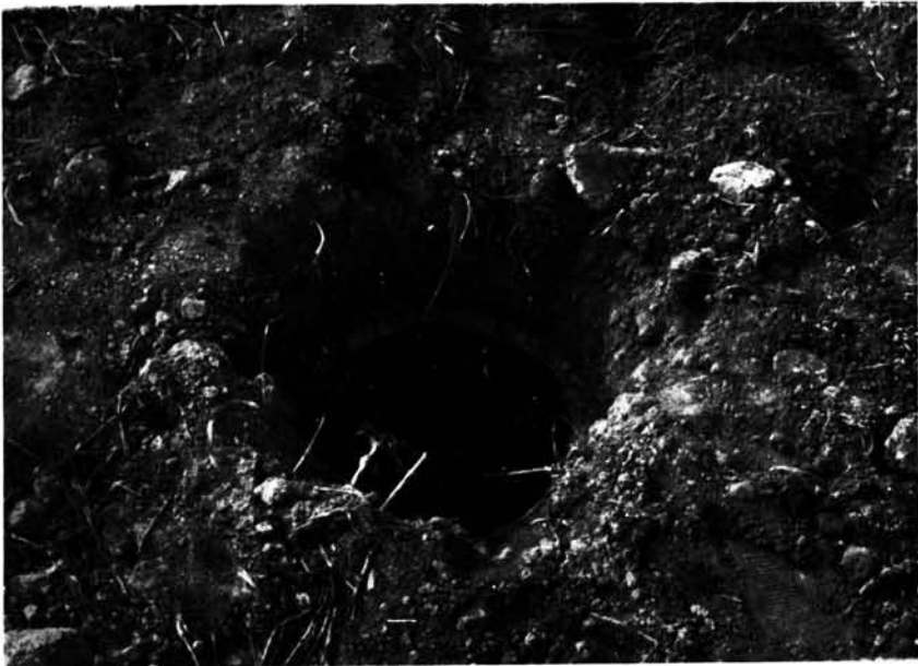
Boca de uno de los sitjots de la Tanca de s'Era o des Cuiitor (Son Toni Amer)