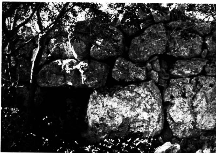
Portal, hoy cegado, de las murallas del poblado de Es Cap Sol (Son Catlar).