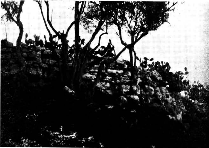
Restos de un talaïot de Es Lloquet, integrado en el poblado de Es Cap Sol (Son Catlar).