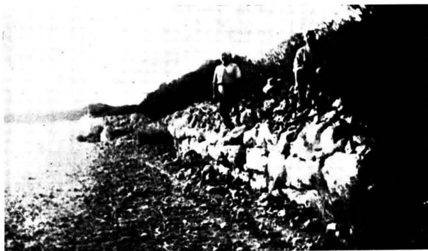
Muralla del poblado de Sa Talaia (Son Catlar Nou) hoy completamente demolida.