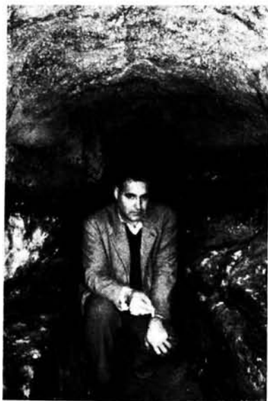
Cova de ses Capelletes. Tanca d'En Gori Puça (Son Toni Amer).