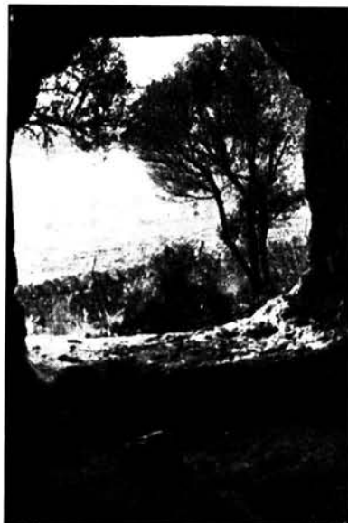
Vista interior del portal de una cueva artificial de Es Morro (Son Coves).