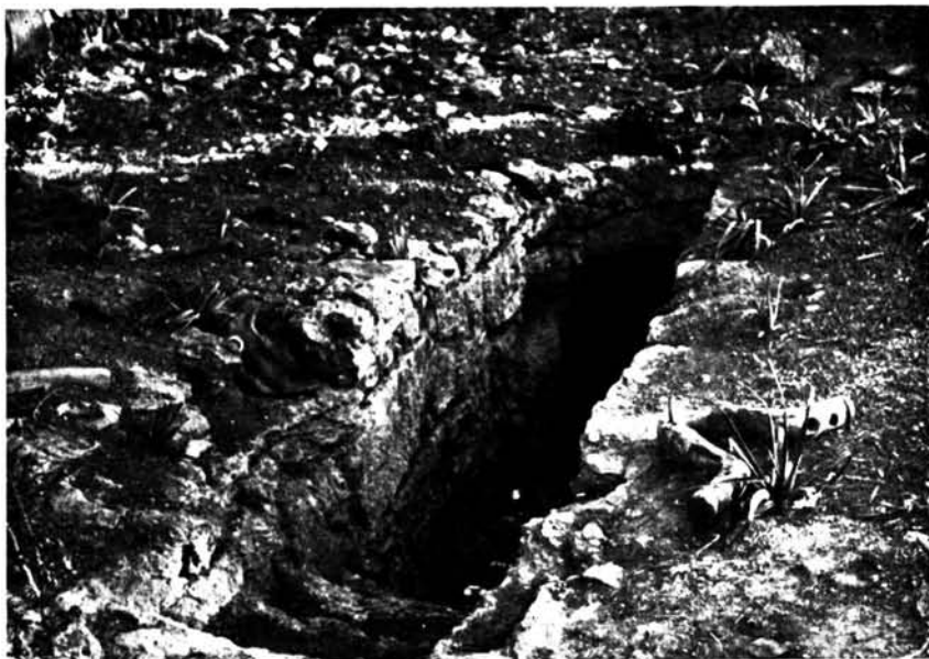
Uno de los corredores de acceso a la cueva artificial de Son Rosselló.