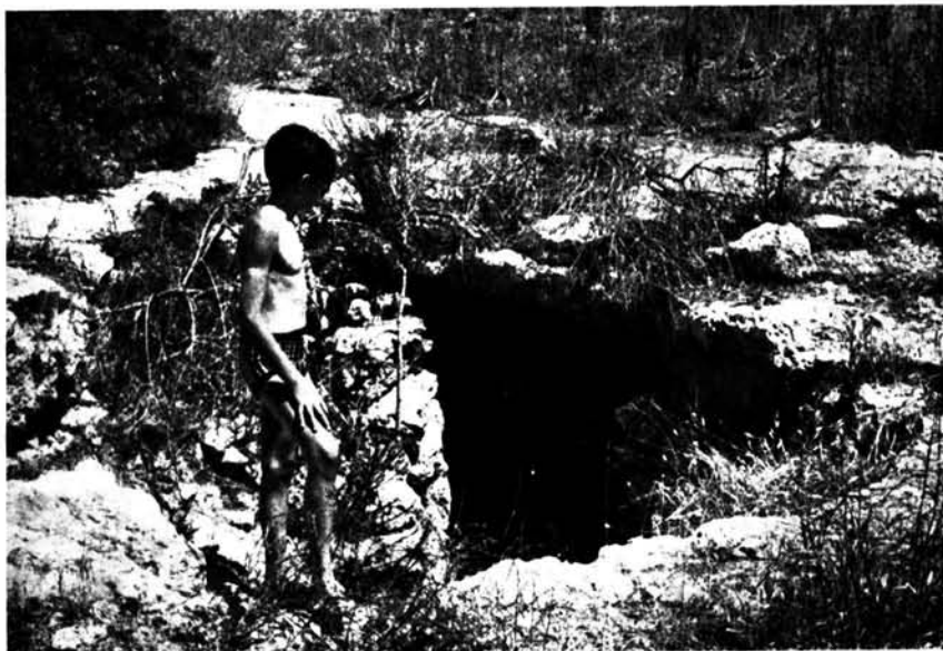
Cueva artificial de la Pleta de sa Cova (Son Ceia).