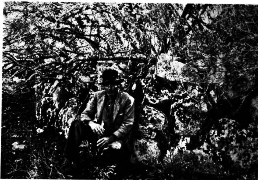
Naviforme de planta de herradura alargada del Pinar des Cuitor (Es Ravellaret).