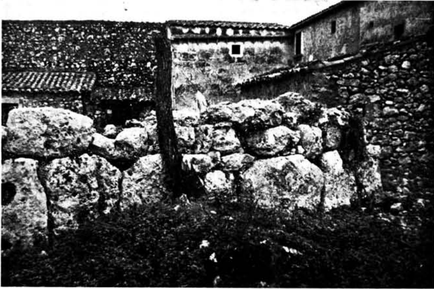
Restos de muralla del poblado del Pletó de Can Caixa (Son Perot).