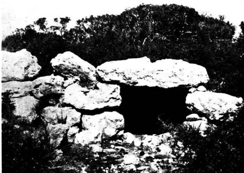
Portal de un talaiot de planta circular del poblado del Pletó de Can Jaume (Ses Sitjoles).