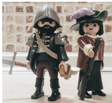
να ο Πιζάρο.

Αυτοί τώρα βοηθήθηκαν, εκτός από αυτά που είπαμε, και από το γεγονός ότι ανάμεσα στους Αζτέκους υπήρχε ένας θρύλος ότι θα 'ρθούν από μακριά κάποια όντα πολύ μεγάλα, με τεράστια ζώα, τα οποία θα έχουν σχέση με τη ζωή των κατοίκων και θα έχουν σχέση με τους θεούς. Έτσι, όταν οι Αζτέκοι είδαν το θέαμα των Ισπανών πάνω στα άλογα και όλη αυτή την εικόνα που σας περιέγραψα, θεώρησαν ότι εκπληρώνεται αυτός ο θρύλος και ότι οι θεοί στείλανε αυτούς τους πολεμιστές, και για ένα διάστημα οι Αζτέκοι παγιδεύτηκαν και ήσαν φιλικοί, και ο βασιλιάς τους φιλικός προς τους κατακτητές. Όμως σε λίγο, όταν κατάλαβαν περί τίνος πρόκειται και προσπάθησαν να αμυνθούν, ήταν πλέον αργά· αλλά και αν ακόμα είχαν εξαρχής —τέλος πάντων— υποπτευθεί τα πράγματα, και πάλι δεν θα ήταν δυνατόν να καταφέρουν πολλά μπροστά στην υπεροπλία των Ισπανών. Εν πάση περιπτώσει οι Ισπανοί κατέκτησαν με ευκολία και τους Αζτέκους και τους Ίνκας.