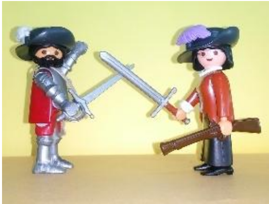
Να τος ο Κορτές,

Πόσοι άνθρωποι κατέλαβαν μια ολόκληρη ήπειρο; 500 στρατιώτες χρειάστηκαν. 500 ένοπλοι στην ουσία κατέκτησαν μια ήπειρο! Με αρχηγούς — ήταν διηρημένοι: ένα σώμα περίπου 200 στρατιωτών υπό τον Πιζάρο κατέκτησε τους Ίνκας, κατενίκησε τους Ίνκας, και ένα λίγο μεγαλύτερο σώμα, 300-τόσων στρατιωτών, υπό τον Κορτές κατέκτησε την περιοχή των Αζτέκων εδώ πέρα στην Κεντρική Αμερική.