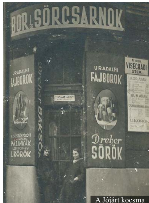
A Jójárt kocsmá

A városrész történetéből adódóan a körútnál és Rudolf térnél sokkal lassabban népesültek be a távolabbi utcák. Az új lakótelepi házak üzleteliségeire csak a lakók beköltözése után évekkel később akadt bérlő. Így a belsőbb üzletekből, cégekből keveset tudunk bemutatni, ráadásul alig készítették reklámokat, fotókat magukról ezek a vállalkozások.