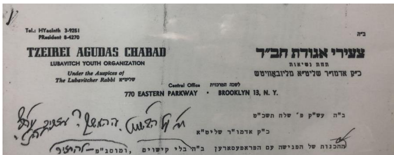
לקמון מענה רצג