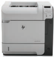
HP LaserJet Enterprise 600 M602dn