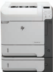
HP LaserJet Enterprise 600 M602x