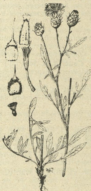
Фиг. 1408. Centaurea salonitana Vis. (Ориг.).

2793. (30). C. stoebe L. (Sp. pl. 914); ( C. maculosa Lam. Dict. I, p. 669) (⊙—4). По сухите тревисти и каменливи места, в храсталациите, край пътищата и пр. (1—3). Цъвти през лятото. Срещат се следните форми: