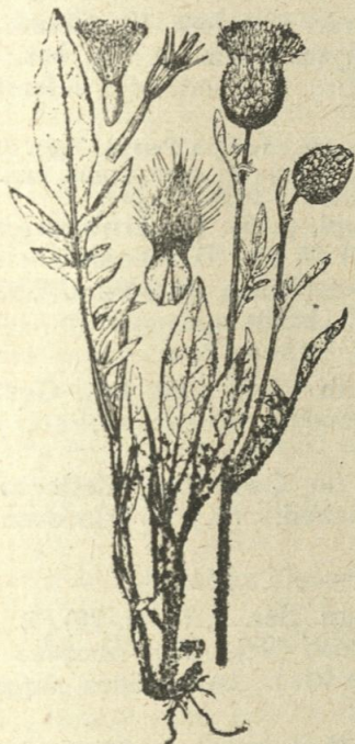
Фиг. 1406. Centaurea kotschyana Heuff. (Ориг.)

Subsp. spinulosa (Roch.) Hayek (ined.). — Листата отгоре голи и гладки, отдолу по жилките и первазите грапави, пересто нарязани, обикновено с едро пересто-назжбени, 5—10 мм. широки дялове. Обвивните листчета зелени или само вжншните от тях покрити с брашнян прах; при-