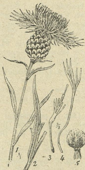
Фиг. 1409. Centaurea jacea L. (по Федч. и Флер.).

Subsp. rhenana (Boreau) Hayek ( C. rhenana Boreau Fl. Centr. Fr. 1857, p. 355). — Обвивката 14 мм. дълга и 10 мм. широка. Придатъците на обвивните листчета 1—1,5 мм. дълги, черни, с по 6—8 черни, на върха си светли реснички от всяка страна. Хвърчилката на \frac{1}{2} или \frac{3}{4} от дължината на плода. Ловеч (Ur.).