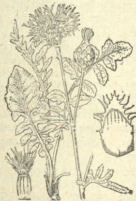
Фиг. 1405. Centaurea scabiosa L. (по Фиори).

Забележка: C. cyanoides Berg. et Wahl. (Jsis. 1828, V, p. 21). — Посочва се за Нова-Загора (Vel.). От предходния вид се отличава с елиптичните или ланцетни и снабдени при основата си с уши стъблови листа. Плода без хвжрчилка.