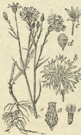
Фиг. 1404. Centaurea cyanus L. (по Гарке).

Географ. разпростр.: Европа, Зап. Азия; другаде пренесено.