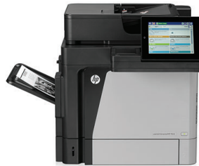
HP LaserJet Enterprise MFP M630dn

Vertrauen Sie auf einen leistungsstarken HP Enterprise Flow MFP, der digitale Workflows mit erweiterten HP Flow Lösungen optimiert, Ihre Geschäftsdaten und Dokumente mit einer Vielzahl an professionellen Sicherheitsfunktionen schützt und einfaches, effizientes mobiles Drucken ermöglicht.