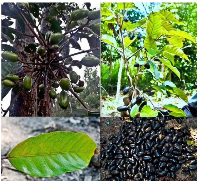
Gambar 2. Buah hitam ( Haplolobus monticola ).

dijumpai pada sebagian besar daerah tropis dan sub tropis (Gambar 1).