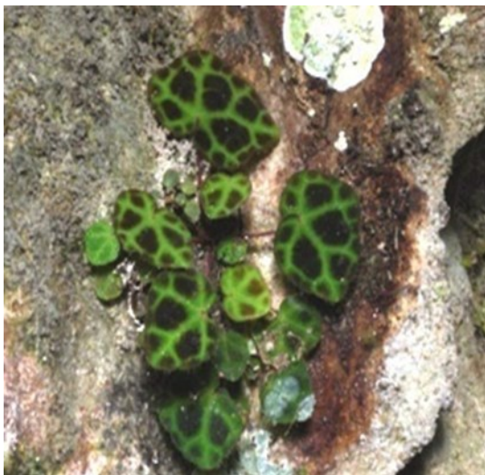
Begonia droopiae Ardi.