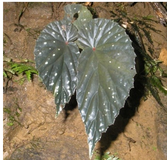
Begonia atricha Miq.