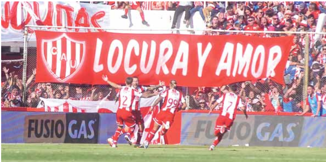
Sabor a poco. El Tate tenía todo a favor pero se tuvo que conformar con un empate ante Colón.

De hecho, en el primer tiempo dispuso de varios contragolpes, en donde con solo acertar un pase llegaba el segundo gol. Pero una vez más, padeció la falta de resolución en los metros finales. En este caso y a diferencia del cotejo con Barracas Central, Unión no generó chances claras como para