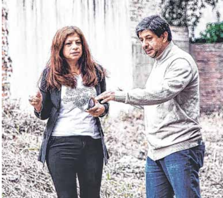
LOS TRABAJOS. forman parte del “Operativo Verano”

“La Municipalidad no tiene la capacidad operativa para hacerse