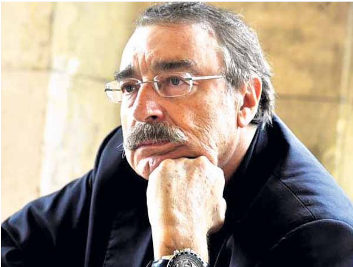
IGNACIO RAMONET. “La nueva derecha está dispuesta a dar un golpe de otra forma: salen a la calle para generar caos y, así, catalizar la participación de las fuerzas armadas”.

cita a Foucault en la que él se pregunta qué es la actualidad. ¿Por qué decidió abordar la toma del Capitolio? ¿Qué dice de nuestro presente?