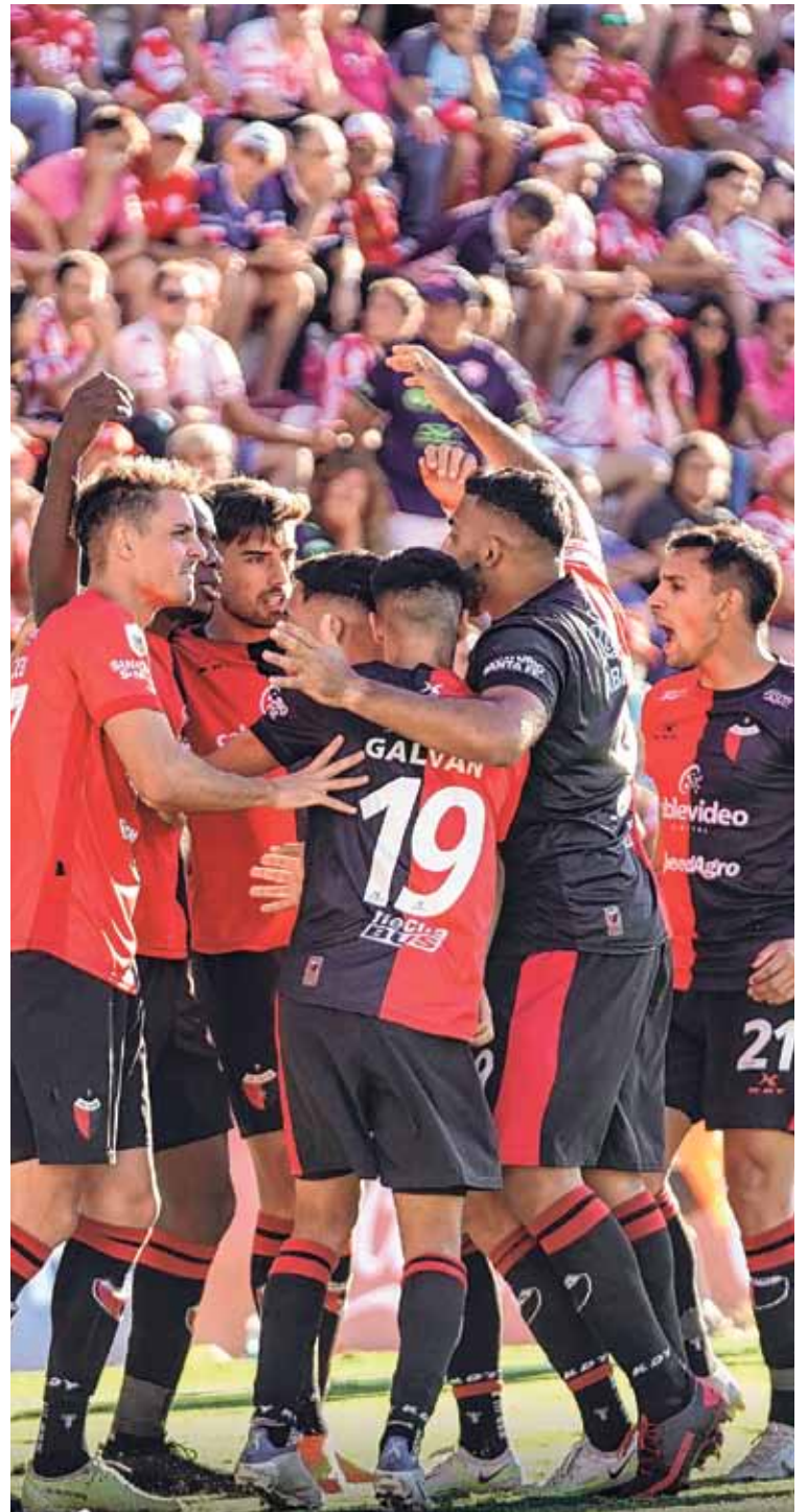
Sacó pecho. Colón llegó de punto al Clásico Santafesino y casi lo gana en la última pelota.

No hay dudas que Colón terminó salvando la ropa e incluso si se animaba, podía quedarse con todo. Por momentos pareció conformarse con el empate,