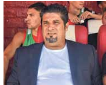
Salta el fusible. En Colón queda de manifiesto la falta de un proyecto deportivo.

Las victorias seguidas con Estudiantes, Patronato y Platense ilusionaron a todos. Después llegaron derrotas como local ante Racing y Defensa. La despedida fue con em-