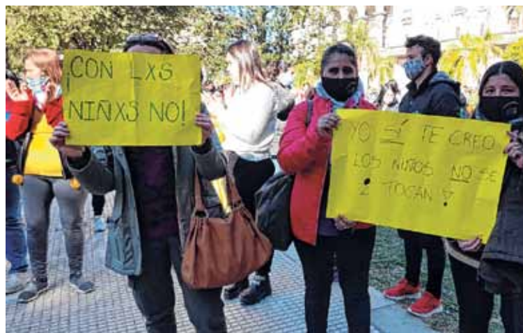
JUSTICIA. Los niños y adolescentes, cuando adquieren la mayoría de edad, pueden denunciar el delito sexual del que fueron víctimas sin importar el tiempo.

UNO le consultó a Noval sobre lo que sucede en una comisaría cuando una víctima, o quien tenga conocimiento del delito, se acerca