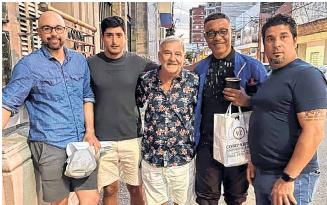
Despedida. Colón a través de sus redes sociales le envió un mensaje de agradecimiento al cuerpo técnico.

Luego, se le preguntó por la tardanza de Wanchope Ábila en sumarse a la pretemporada, y tiró: “Fue un permiso consensuado de la directiva, que tenía la única oportunidad de ver campeón del mundo a Argentina. Eso trajo malestar al grupo, que estaba trabajando con 40° de calor en Santa Fe, no llegó de la mejor forma física, después se lesionó un poquito, y no pudimos ponerlo a punto, es un jugador muy, muy importante. Está falto desde lo físico, pero había que ponerlo adentro, tiene mucha personalidad. Uno apela a las personas y con su físico le cuesta mucho más. Si está bien puede hacer la diferencia