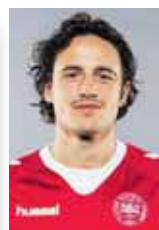
Thomas DELANEY 3. 9. 1991 Borussia Dortmund 31 / 4