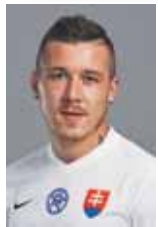
Juraj KUCKA 26. 2. 1987 Trabzonspor AS 59 / 6