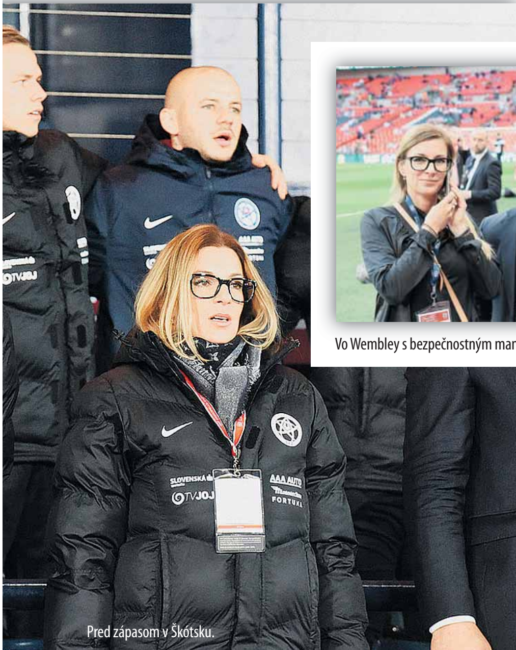
Pred zápasom v Škótsku.

(úsmev). Je to určite iné pre mňa, že som tam sama žena, a asi aj pre nich. Mám však pocit, že tak postupne, ako s tímom chodím, sme si na seba zvykli. Oni sú profesionáli, ja sa snažím tiež pristupovať k tomu profesionálne. S niektorými hráčmi som kamarátka, keďže sa poznáme ešte z čias, keď som fungovala ako novinárka. Aj v realizačnom tíme som mala kamarátov, ktorí mi v začiatkoch veľmi pomohli. Chodím tam medzi nich rada, lebo atmosféra v tíme je dobrá, je na chalanoch vidieť, že sú radi spolu a aj ja sa medzi nimi cítim dobre.