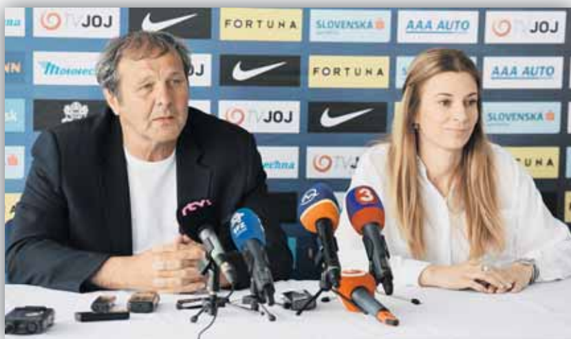
Na tlačovej konferencii s reprezentačným trénerom Jánom Kozákom.

Netušila som, koľko práce za tým je. Ako novinárka som fungovala v istom rytme