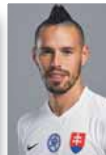
Marek HAMŠÍK 27. 7. 1987 SSC Neapol 105 / 21