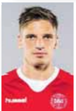
Jens Stryger LARSEN 21. 2. 1991 Udinese Calcio 16 / 1