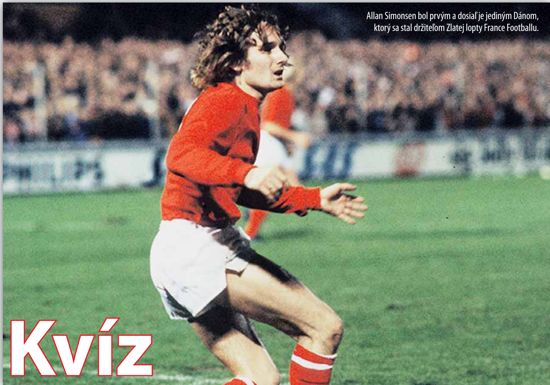
Allan Simonsen bol prvým a dosiaľ je jediným Dánom, ktorý sa stal držiteľom Zlatej lopty France Footballu.