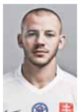
Vladimír WEISS 30. 11. 1989 Al-Gharafa 64 / 7