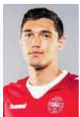
Andreas CHRISTENSEN 10. 4. 1996 FC Chelsea 20 / 1