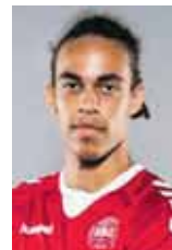
Yussuf POULSEN 15. 6. 1994 RB Lipsko 31 / 5