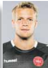
Jonas LÖSSL 1. 2. 1989 Huddersfield Town 1 / 0