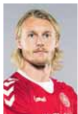
Simon KJÆR 26. 3. 1989 FC Sevilla 82 / 3