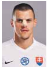
Martin ŠKRTEL 15. 12. 1984 Fenerbahce Istanbul 97 / 6