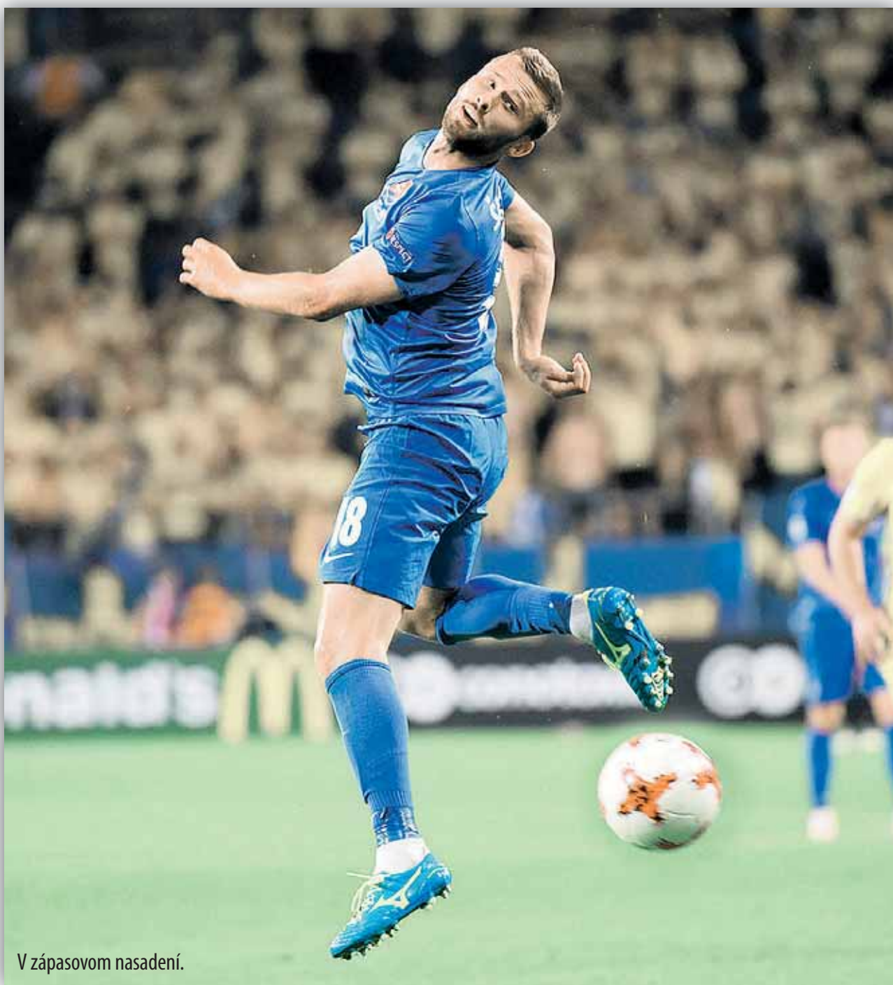
V zápasovom nasadení.

☛ Ako by ste charakterizovali trénera Dánov Ageho