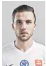
Peter PEKARÍK 30. 10. 1986 Hertha BSC Berlín 82 / 2