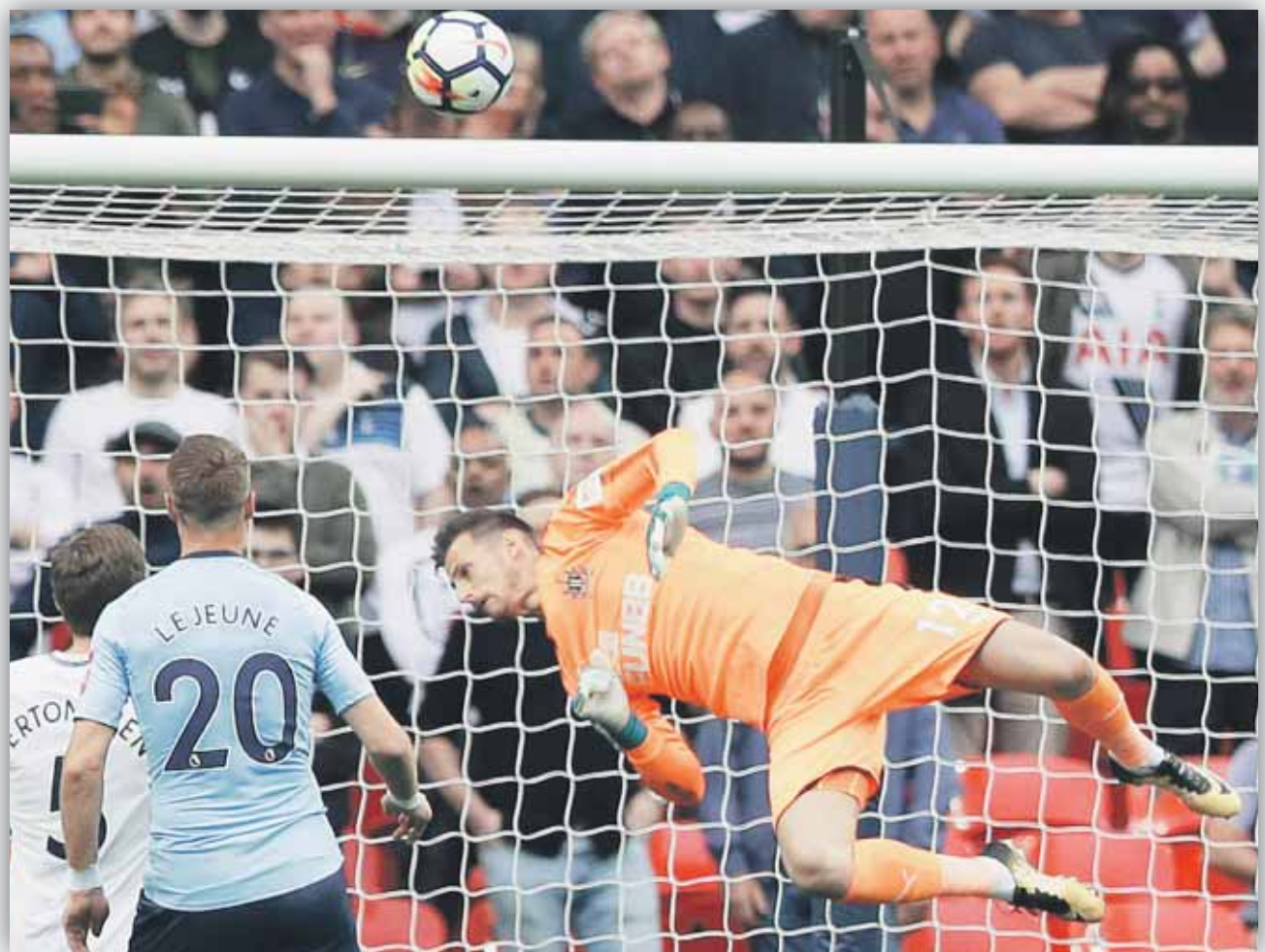
Martin v úvodnom zápase sezóny 2018/19 proti Tottenhamu, v ktorom jeho tím prehral 1:2.

Napriek ostatným variantom – a boli medzi nimi aj zvučné mená – preferoval zotrvanie v Newcastle. „ Bola to moja priorita. Netúžil som po tom znova si hľadať zázemie a nastavovať osobný komfort, nebolo by to jednoduché. Newcastle mi prirástlo k srdcu, chcel som zostať súčasťou klubu. “ Mimochodom, medzi záujemcami bol údajne aj FC Liverpool, finalista uplynulej sezóny Premier League. Je to pravda? „ Objavili sa šumy tohto typu, ale takých je veľa. Kým nepríde k dohode, je to