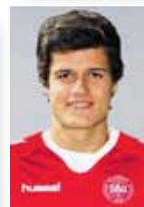
Christian NØRGAARD 10. 5. 1994 AC Fiorentina 0 / 0