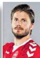
Lasse SCHÖNE 27. 5. 1986 Ajax Amsterdam 39 / 3