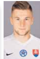
Milan ŠKRINIAR 11. 2. 1995 Inter Miláno 18 / 0