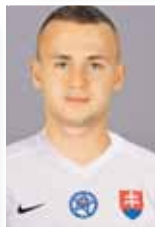
Stanislav LOBOTKA 25. 11. 1994 Celta Vigo 11 / 2