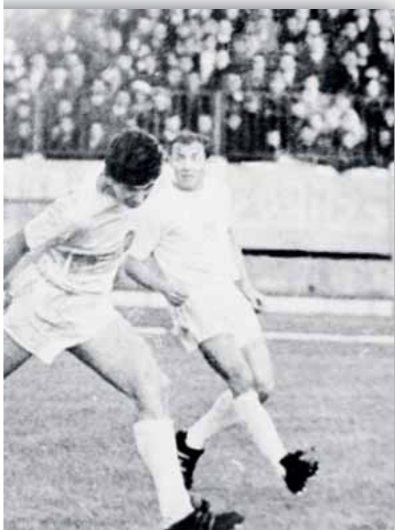
v kvalifikácii o postup na MS 1970 (1:0).