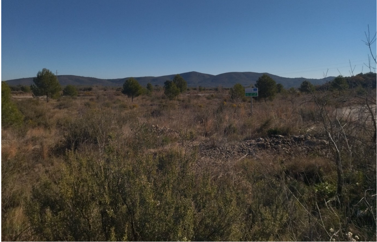
Aspecte general de la rambla.

http://www.docv.gva.es/datos/2003/03/11/pdf/2003_2830.pdf