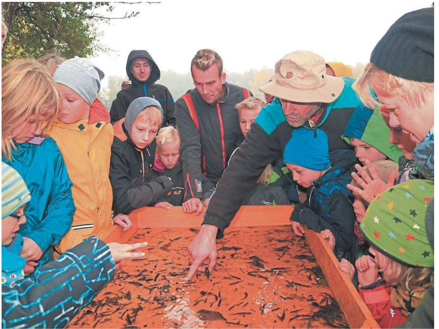
Zum Abfischen lädt der BUND nach Blenhorst ein.

Um ein risikofreies Arbeiten zu gewährleisten, ist die