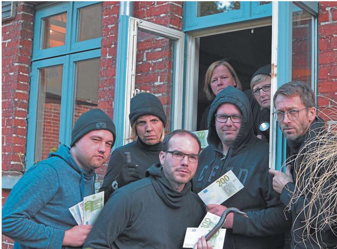
Die Sing- und Spielgemeinschaft Holte-Langeln spielt ab Januar den Schwank „Allens in'n Griff“.