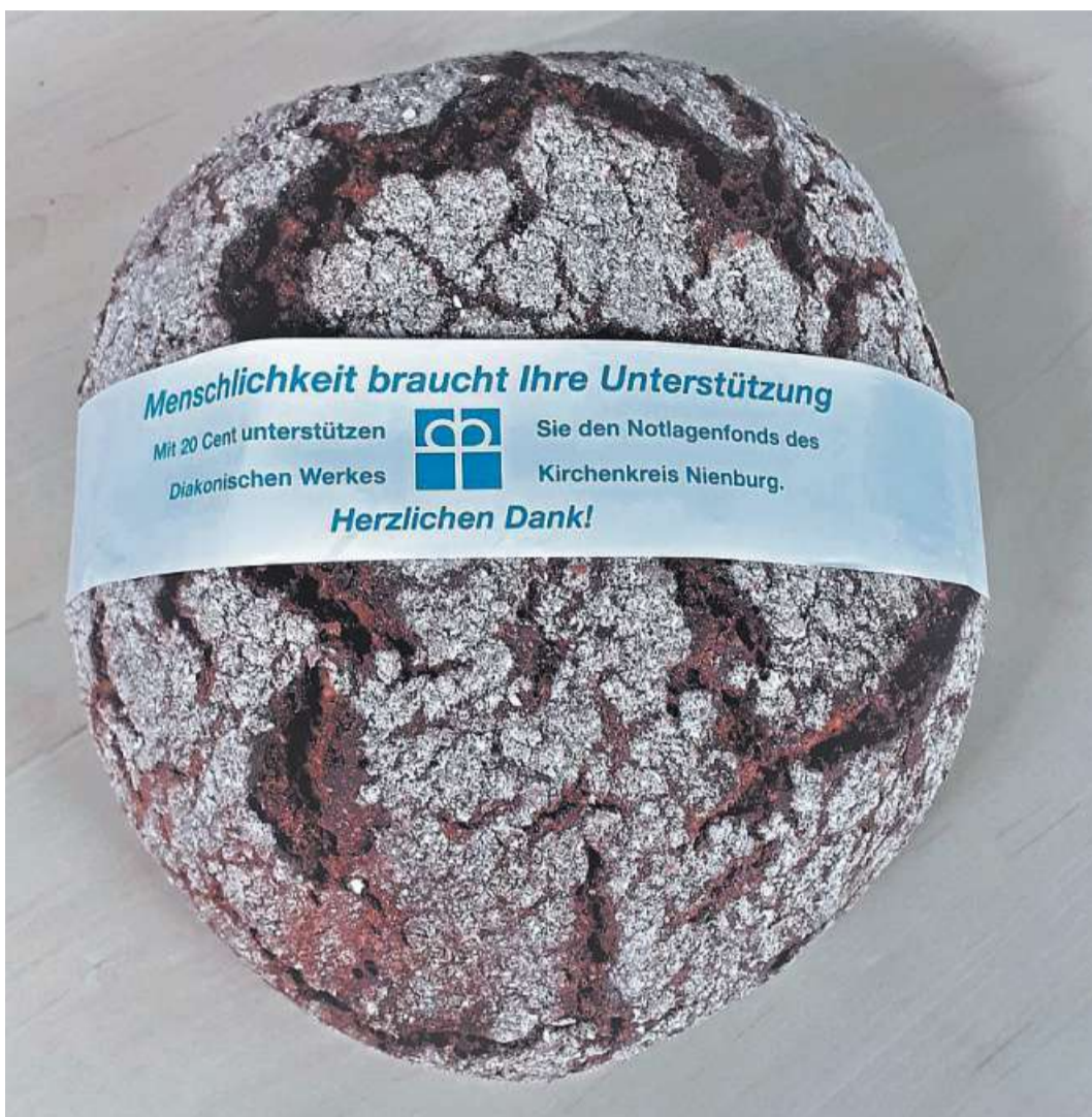
Vom Verkauf des Diakoniebrotes geht Geld in den Notlagenfonds.

Erhört werden sollen auch Familienthemen. Beklagt wurden nicht ausreichende Kinderbetreuung sowie der Spagat zwischen Beruf, Haushalt und Erziehung, den meist die Frauen und vor allem auch Alleinerziehende leisten. Ebenso wurde die Überforderung von pflegenden Angehörigen genannt. Aber auch, dass immer mehr Erziehungsberechtigte die Beschäftigung mit dem Smartphone wichtiger finden als die mit ihren Kindern. Unerhört fanden einige,