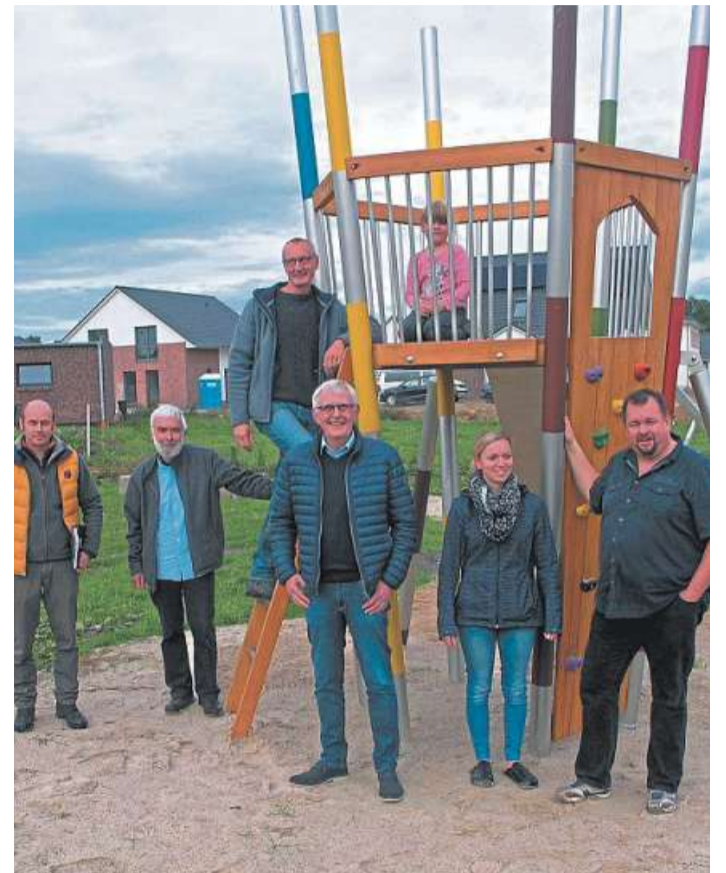
Der neueste Spielplatz in Steimbke ist eröffnet.