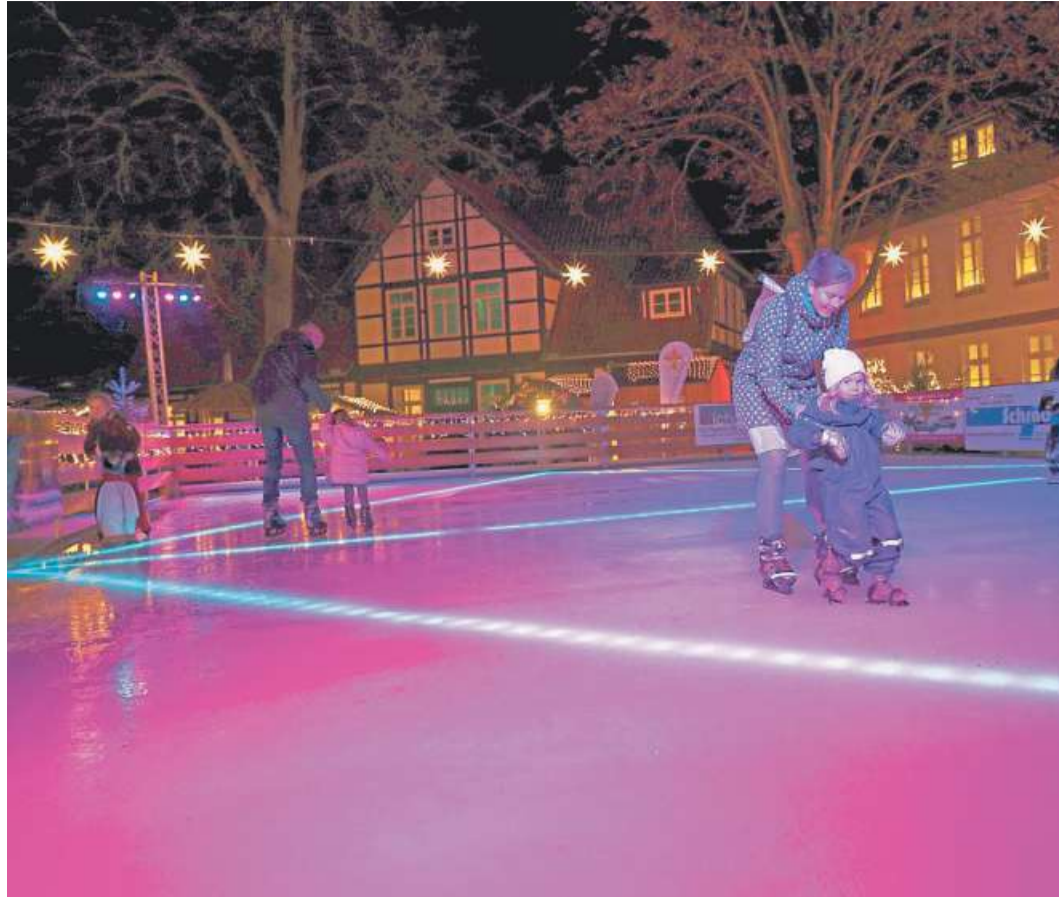
Beim fünften Adventszauber soll es wieder eine Eisbahn geben.