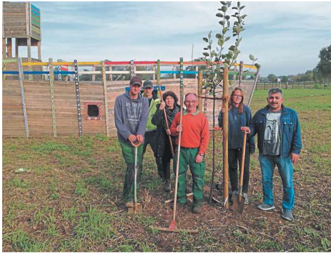
Gemeinsam haben Helfer auf der „Neuen Erde“ Hand angelegt.