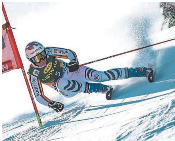
Viktoria Rebensburg hatte in Sölden große Probleme.

„Sie hat ihre Vorteile durch ihr Alter und die Unbekümmertheit“, sagte Rebensburg der ARD. „Ich habe meine Vorteile auch durch mein Alter, durch die Erfahrung. Ich versuche meine Schlüsse daraus zu ziehen und dann im nächsten Rennen wieder an-