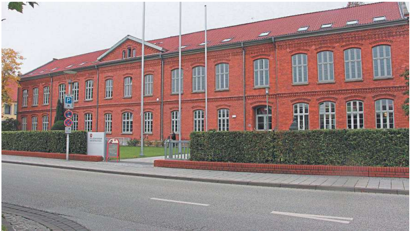
An der Polizeiakademie in Nienburg können sich Studierende spezialisieren lassen.

Seit dem 1. Oktober haben 25 Studierende in Nienburg die Möglichkeit, sich noch intensiver mit Themen aus dem Bereich der Kriminalistik und der Kriminologie zu befassen. Die Studierenden werden so besser und zielgerichteter darauf vorbereitet, zeitnah nach dem Studium in ermittelnden