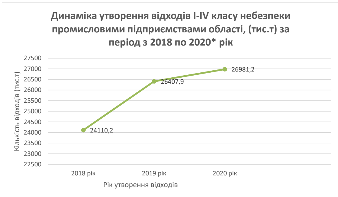
Графік 1. Динаміка утворення відходів I-IV класу небезпеки промисловими підприємствами області.

Динаміка утворення відходів від промислових підприємств області за даними Головного управління статистики у Донецькій області (без урахування частини тимчасово окупованої території у Донецькій області) представлена на графіку 1.