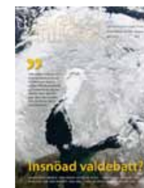
Omslagsbild: Insöad valdebatt?