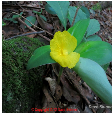
Figura 2: Chamaecostus subsessilis (Nees & Mart.) C.D.Specht & D.W.Stev.