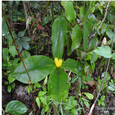
Figura 1: Chamaecostus acaulis (S.Moore) T.André & C.D.Specht