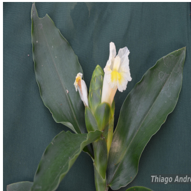
Figura 2: Costus arabicus L.