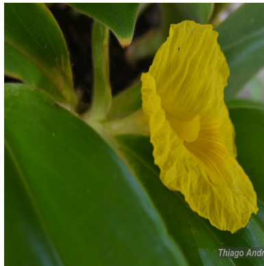
Figura 2: Chamaecostus acaulis (S.Moore) T.André & C.D.Specht