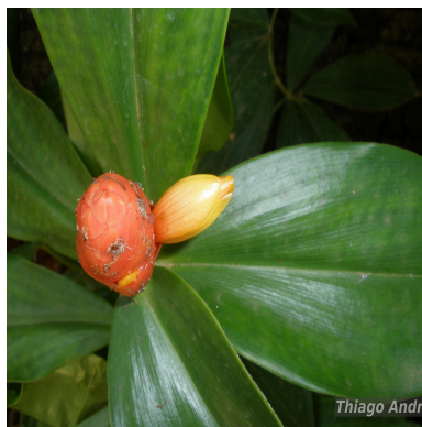
Figura 1: Costus scaber Ruiz & Pav.