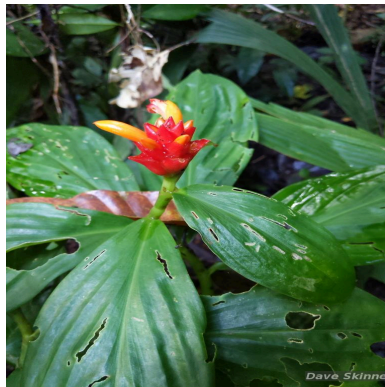
Figura 2: Costus juruanus K.Schum.