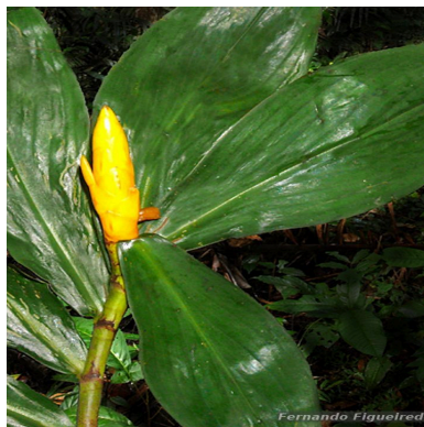
Figura 3: Chamaecostus fusiformis (Maas) C.D.Specht & D.W.Stev.