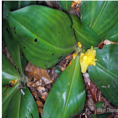
Figura 1: Chamaecostus subsessilis (Nees & Mart.) C.D.Specht & D.W.Stev.