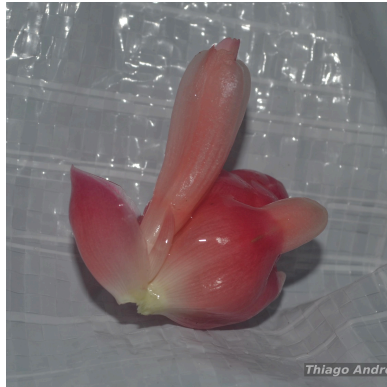
Figura 2: Costus sprucei Maas