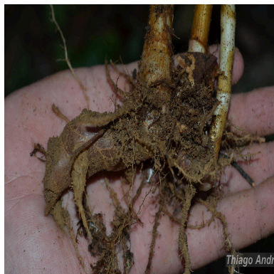
Figura 3: Chamaecostus fragilis (Maas) C.D.Specht & D.W.Stev.