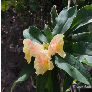
Figura 1: Costus guanaiensis Rusby