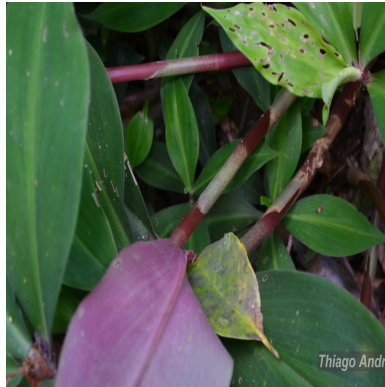
Figura 1: Chamaecostus cuspidatus (Nees & Mart.) C.D.Specht & D.W.Stev.