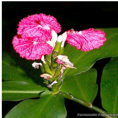
Figura 2: Chamaecostus lanceolatus (Petersen) C.D.Specht & D.W.Stev.