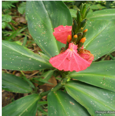
Figura 1: Chamaecostus lanceolatus (Petersen) C.D.Specht & D.W.Stev.