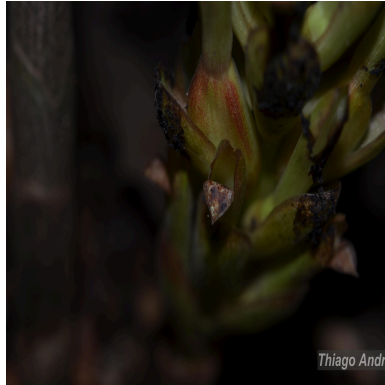
Figura 2: Chamaecostus fragilis (Maas) C.D.Specht & D.W.Stev.