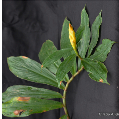
Figura 2: Chamaecostus fusiformis (Maas) C.D.Specht & D.W.Stev.