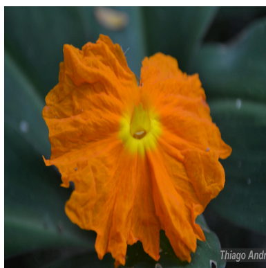
Figura 3: Chamaecostus cuspidatus (Nees & Mart.) C.D.Specht & D.W.Stev.