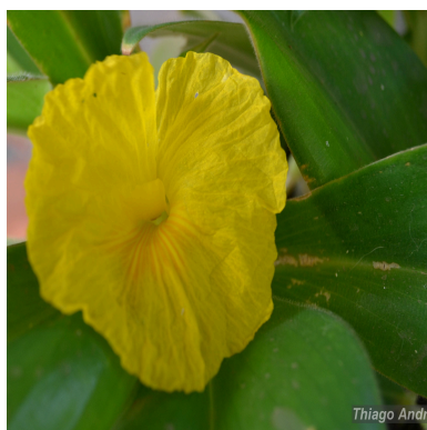
Figura 3: Chamaecostus acaulis (S.Moore) T.André & C.D.Specht