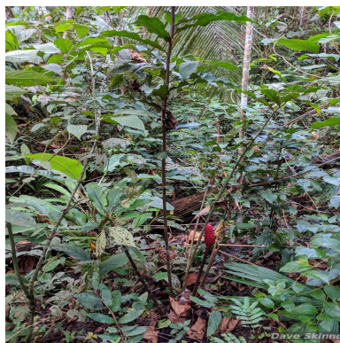
Figura 1: Costus erythrothyrus Loes.