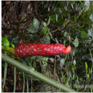
Figura 1: Costus spiralis (Jacq.) Roscoe