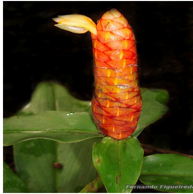
Figura 2: Costus scaber Ruiz & Pav.