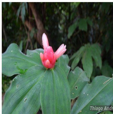
Figura 1: Costus sprucei Maas