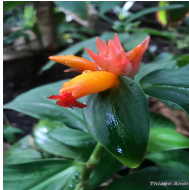
Figura 1: Costus juruanus K.Schum.