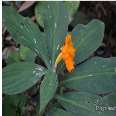
Figura 4: Chamaecostus cuspidatus (Nees & Mart.) C.D.Specht & D.W.Stev.