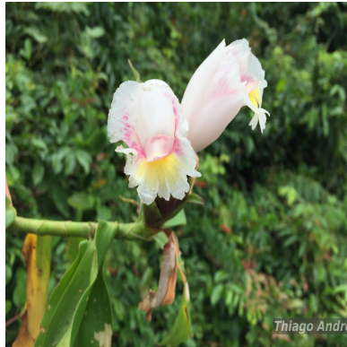
Figura 1: Costus arabicus L.