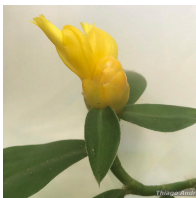
Figura 1: Costus lasius Loes.