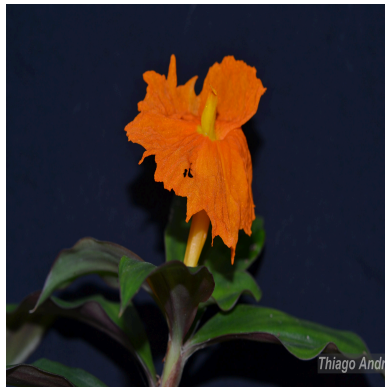
Figura 2: Chamaecostus cuspidatus (Nees & Mart.) C.D.Specht & D.W.Stev.