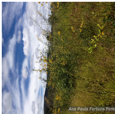
Figura 3: Poiretia coriifolia Vogel