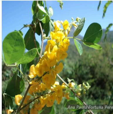
Figura 1: Poiretia punctata (Willd.) Desv.