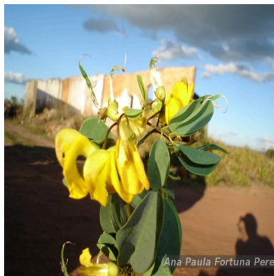
Figura 1: Poiretia bahiana Cl.Müll.