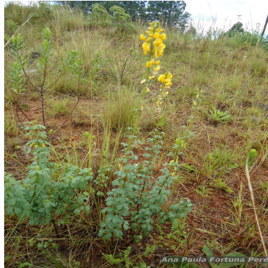
Figura 2: Poiretia tetraphylla (Poir.) Burkart