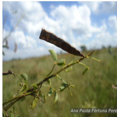
Figura 3: Poiretia crenata C.Muell.