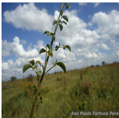
Figura 1: Poiretia crenata C.Muell.