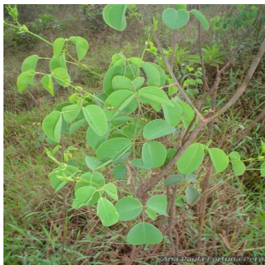
Figura 1: Poiretia elegans Cl.Müll.