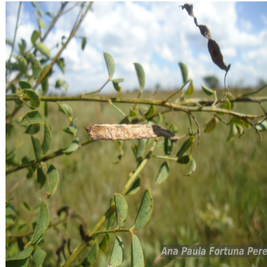
Figura 2: Poiretia crenata C.Muell.