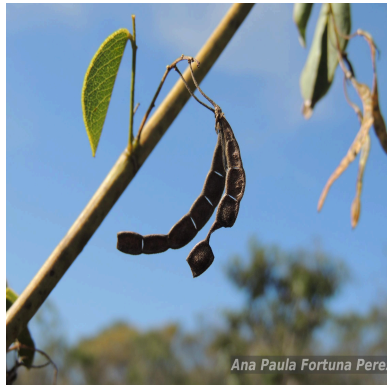
Figura 2: Poiretia coriifolia Vogel