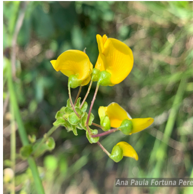
Figura 1: Poiretia latifolia Vogel