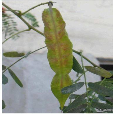
Figura 2: Sesbania punicea (Cav.) Benth.