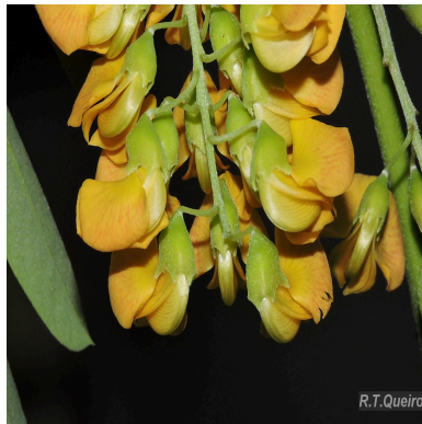
Figura 6: Sesbania virgata (Cav.) Poir.