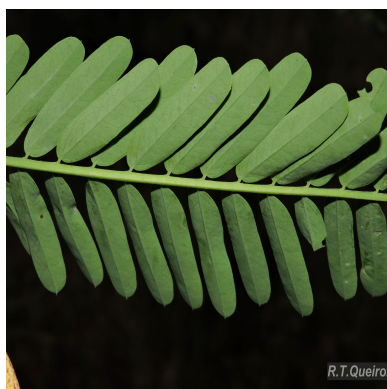
Figura 7: Sesbania exasperata Kunth