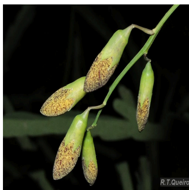
Figura 3: Sesbania exasperata Kunth