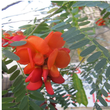
Figura 3: Sesbania punicea (Cav.) Benth.