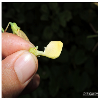
Figura 6: Sesbania exasperata Kunth