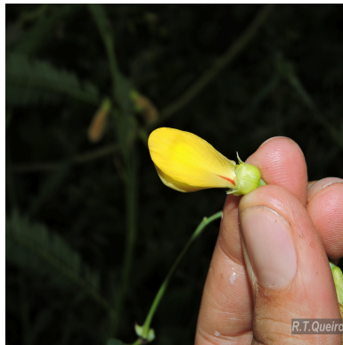
Figura 5: Sesbania exasperata Kunth