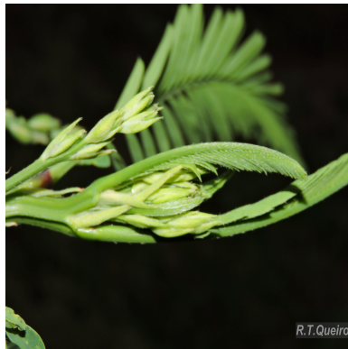
Figura 2: Sesbania exasperata Kunth