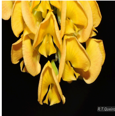
Figura 5: Sesbania virgata (Cav.) Poir.