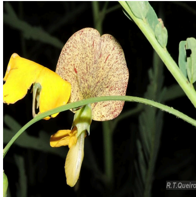
Figura 4: Sesbania exasperata Kunth