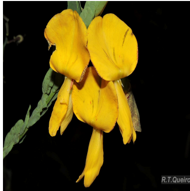
Figura 1: Sesbania exasperata Kunth