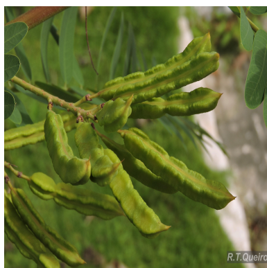
Figura 7: Sesbania virgata (Cav.) Poir.