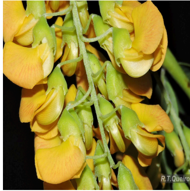
Figura 2: Sesbania virgata (Cav.) Poir.