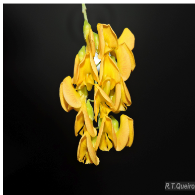
Figura 4: Sesbania virgata (Cav.) Poir.