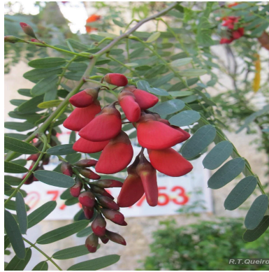
Figura 5: Sesbania punicea (Cav.) Benth.