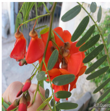
Figura 4: Sesbania punicea (Cav.) Benth.