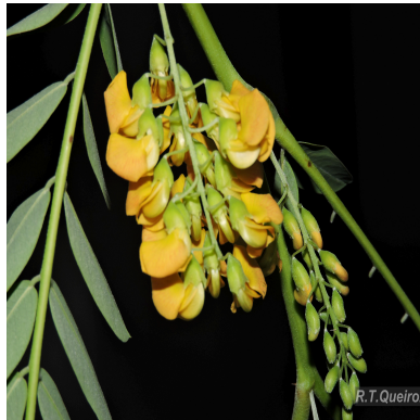
Figura 3: Sesbania virgata (Cav.) Poir.