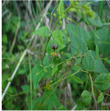
Figura 2: Sidastrum paniculatum (L.) Fryxell