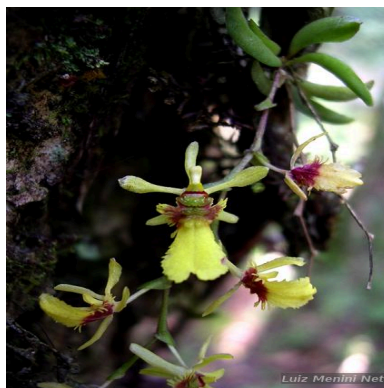
Figura 1: Thysanoglossa organensis Brade