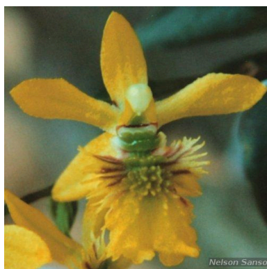
Figura 1: Thysanoglossa spiritu-sanctensis N. Sanson & Chiron