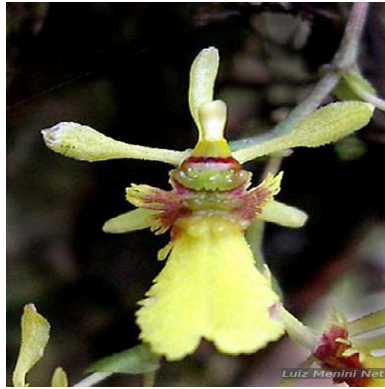
Figura 2: Thysanoglossa organensis Brade