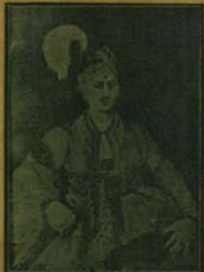
Sri Svati Tirunal