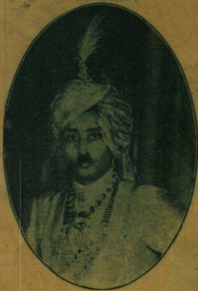
Sri Shanmukha Rajesvara Setupati The Rajah of Ramnad Opener of the Conference