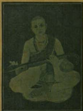
Sri Muthusvami Dikshitar