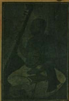
Sri Syama Sastrigal