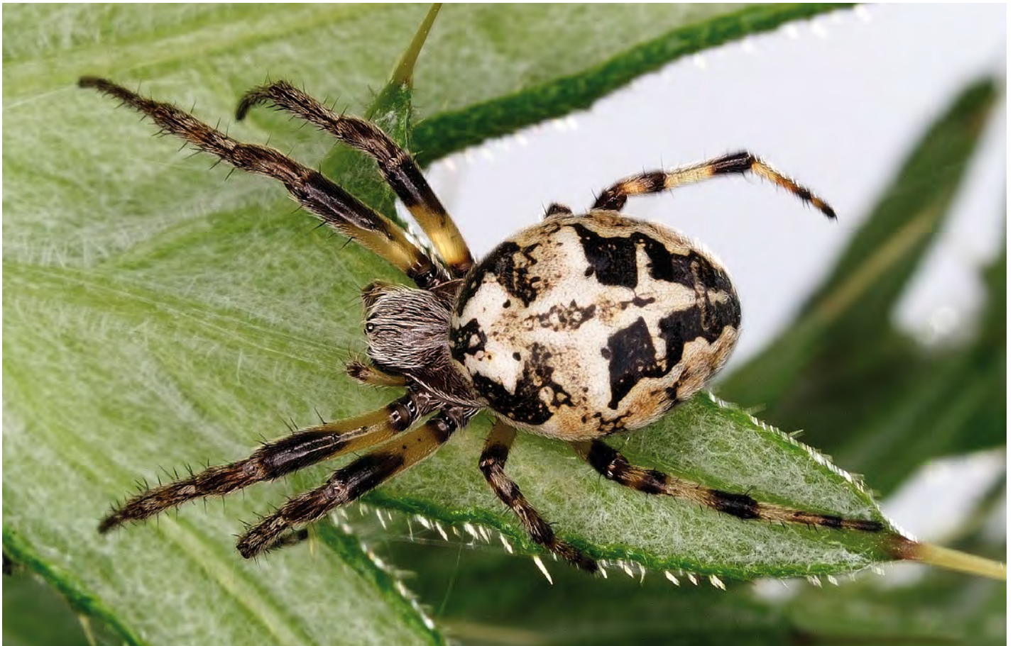
12. Larinioides cornutus , een algemene spin van rietlanden en slootoevers. 12. Larinioides cornutus , a common spider from reedmarshes and banks of ditches.

Eristalis nemorum : vow2, urk3 Eristalis pertinax : vow2 Helophilus pendulus : sch, urk3 Helophilus trivittatus : kui9, urk3 Merodon equestris : urk1 Temnostoma bombylans : urk1 Tropidia scita : urk1 Xylota sylvanum : urk3