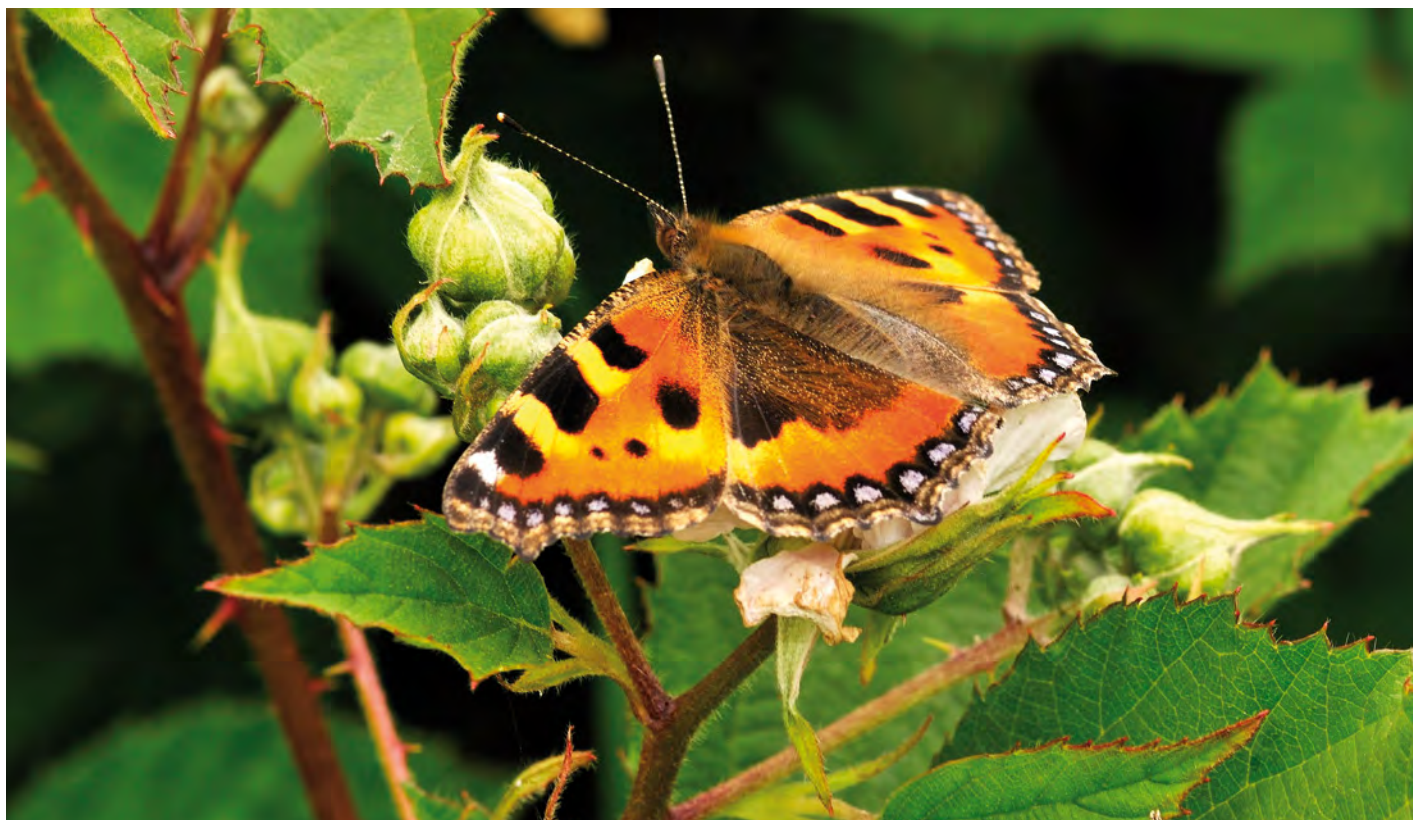
8. De zeer algemene Aglais urticae (kleine vos) werd alleen in het Urkerbos gezien. 8. Aglais urticae , a common butterfly, was seen only in the Urkerbos.

Vermeldenswaard is verder Spargania luctuata . Volgens de website vlindernet.nl is dit een zeer zeldzame soort, die vrijwel alleen in Drenthe en de duinen van Egmond voor komt. In Flevoland is deze soort al eerder in het Kuinderbos en ook in het Roggebotzand waargenomen.