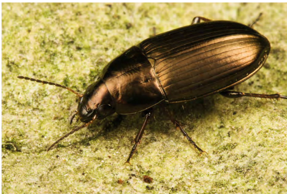
9. Amara aenea , een algemene loopkever van zonnige open terreinen.

9. The common carabid Amara aenea lives on sunny exposed areas.