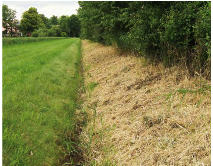
5. Drooggevallen greppel tussen akker en houtwal. Vindplaats van de pissebed Hyloniscus riparius . 5. Temporary ditch between field and wooded bank. Sampling locality of the wood-louse Hyloniscus riparius .

het oudste bosgebied van de Noordoostpolder. De bodems bestaan voornamelijk uit keileem en de bossen zijn bekend vanwege het voorkomen van vele zeldzame varens en paddestoelen. Bij onze accommodatie 'Appelhof' stond een lichtval opgesteld. Het Waterloopbos (figuur 3) is het oudste bosgedeelte van het Voorsterbos. In de laatste helft van de vorige eeuw bouwde het Waterloopkundig Laboratorium hier haar proefopstellingen op schaal van onder andere de Deltawerken en de havens van Vlissingen en Rotterdam. Met de komst van computers en modellen werden de proefopstellingen grotendeels overbodig en na de privatisering van het Waterloopkundig Laboratorium in 1995 kwam, via een projectontwikkelaar die hier vakantiehuizen wilde neerzetten, uiteindelijk het gebied in 2002 in handen van Natuurmonumenten. Het Kadoelersbos is een vrij open loofbos met veel eiken. Door deze openheid zijn er bij recente stormen vrij veel bomen omgewaaid. Het Kadoelersveld vormt een overgangsgebied tussen het Kadoelersbos en het open polderlandschap. Door vernatting en het graven van een grote plas worden deze voormalige landbouwgronden aantrekkelijk voor ongewervelden. Het Kadoelersveld en het Kadoelersbos worden begraaasd met Schotse Hooglanders; kennelijk waren we in de paartijd daar er zich enkele wilde achtervolgingen voltrokken voor onze ogen. Het Wendelbos is 118 ha groot en werd pas in 2006 aangelegd; het bestaat voornamelijk uit gemengd loofbos.