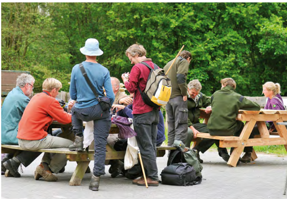
1. Deelnemers aan de 1000-soortendag aan een bankje in het Kuinderbos. 1. Contributors to the 1000-species day gathered around a small bench in the Kuinderbos.

De weersomstandigheden waren alleszins redelijk te noemen. Op vrijdag was het half bewolkt met een matige wind en een temperatuur van circa 15°C; alleen in de ochtend viel er een spatje regen. De zaterdag was de meest gunstige dag. Bij een temperatuur van 18°C en weinig tot matige wind was er een afwisseling van wolken en ook vaak zon, terwijl de voorspelde regen uitbleef. In de avonduren daalde de temperatuur snel. Zondag was het zwaar bewolkt met matige wind bij een temperatuur van 16°C. De voor de middaguren voorspelde regenbuien barsten pas omstreeks 17.30 uur los, maar toen waren de meeste deelnemers al (lang) thuis.