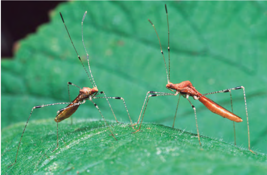
7. De zeldzame heksenkruidsteltwants Metatropis rufescens leeft op Circaea lutetiana (groot heksenkruid) in vochtige loofbossen.

7. The rare Metatropis rufescens lives on Circaea lutetiana in damp deciduous forests.