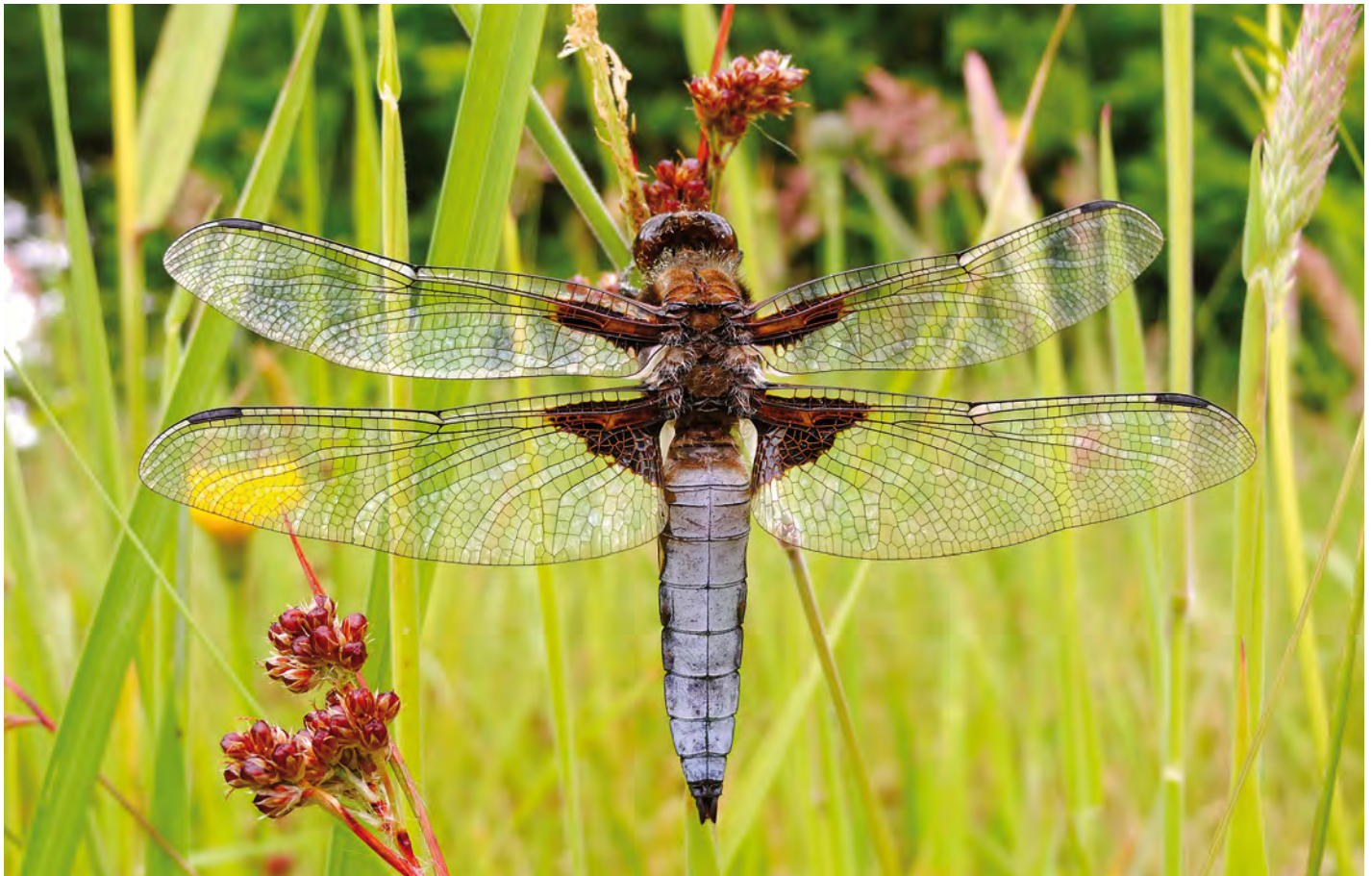
6. De platbuik Libellula depressa werd aangetroffen in het Urkerbos. 6. The dragonfly Libellula depressa was found in the Urkerbos.