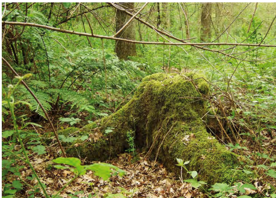
2. Bemoste stronk in het Kuinderbos; vindplaats van de duizendpoot Schendyla nemorensis .

2. A mossy stump in the Kuinderbos; sampling locality of the chilopod Schendyla nemorensis .