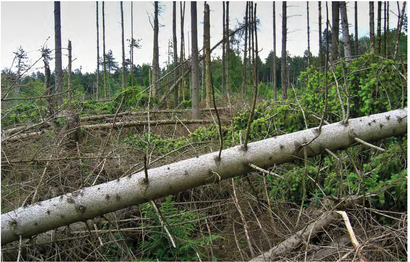
11. Stormvlakte met omvallende en omgevallen Picea abies (fijnspar) in het Voorsterbos. 11. Storm area with fallen Picea abies in the Voorsterbos.

permanente poel met zandbodem werden nogal wat bijzondere waterkevers voor Flevoland aangetroffen, zoals Dryops auriculatus , Helophorus granularis , Hydroporus tristis , Bidessus unistriatus , B. grossepunctatus en Ilybius guttiger , de laatste twee nieuw voor Flevoland. Bij het slepen van vochtig grasland waren de glanzende bloemkever Phalacrus caricis (leeft van roesten op de bloeiwijzen van Carex ) en de schijnboktor Oedemera croceicollis (meest in laagveengebieden) opmerkelijke soorten. Van Salix (wilg) werden enkele exemplaren van de voornamelijk in laag Nederland voorkomende kniptor Synaptus filiformis geklopt. Schors en hout van afgestorven Picea abies (fijnspar) en Pinus (den) leverden een aantal Scolytinae (schorskevers) op waaronder Tomicus piniperda en Trypodendron lineatum , welke alleen hier werden aangetroffen.