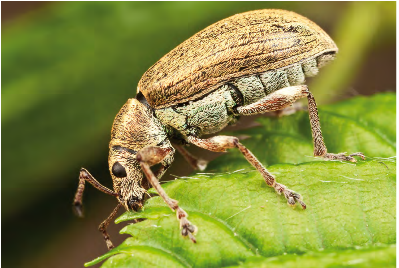
10. Phyllobius pyri , een algemene snuitkever, vretend van Carpinus betulus (haagbeuk). 10. The weevil Phyllobius pyri consuming a leaf of the hornbeam Carpinus betulus .