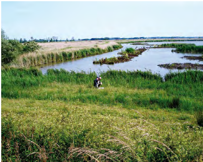
4. Rietland en moeras in het Harderbroek. 4. Reedlands and swamp in the Harderbroek.