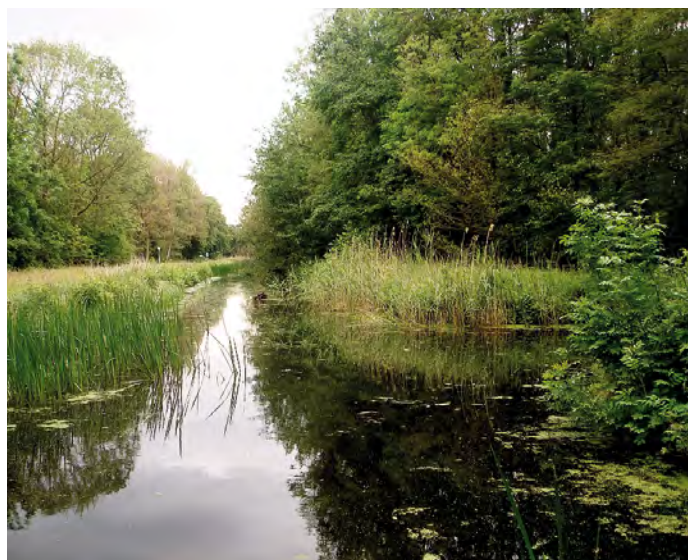
3. Vochtig loofbos met kunstmatige waterlopen in het Waterloopbos.

Wendelbos, Kadoelerbos, Kadoelerveld, Waterloopbos met het Voorster Bos in engere zin vormen tezamen het Voorsterbos, een gebied van circa 900 ha in beheer bij Natuurmonumenten. Het Voorsterbos sensu stricto is aangelegd als productiebos na het droogvallen van de Noordoostpolder in 1944 en is daarmee