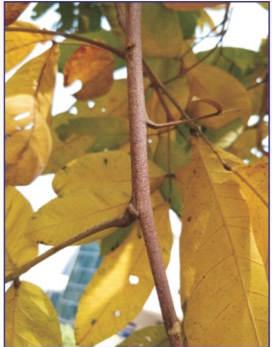
યજમાન પાકની રસદાર ડાળી ઉપર સ્થાયી થયેલ લાખના બચ્ચાંઓ