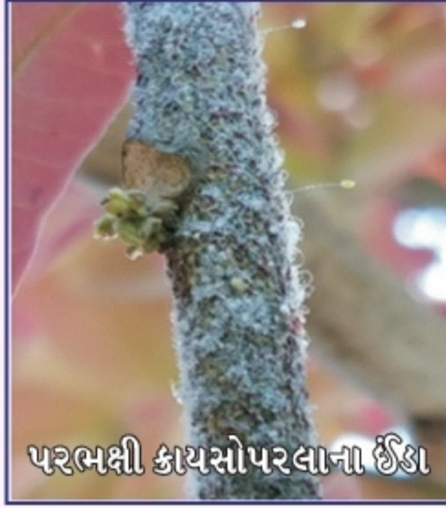
પરભક્ષી કાયસોપરલાના ઈંડા