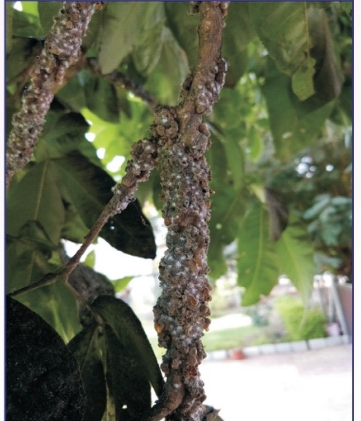
કુસુમના ઝાડ પર લાખથી આચ્છાદિત કોચલા