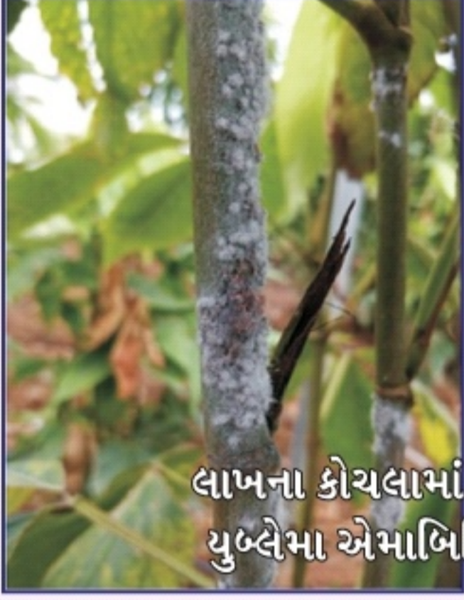
લાખના કોચલામાં પરભક્ષી કીટક, યુબ્લેમા એમાબિલિસનું નુકશાન