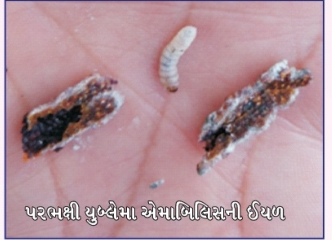
પરભક્ષી યુબ્લેમા એમાબિલિસની ઈયળ