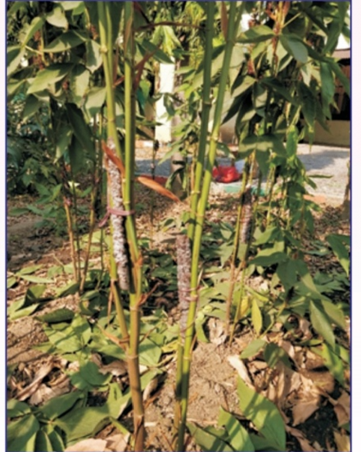
યજમાન પાક પર લાખના બચ્ચાં ચઢાવવા