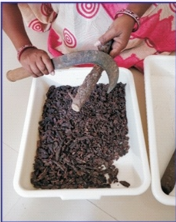
લાખના કોચલાને ઢોલવા