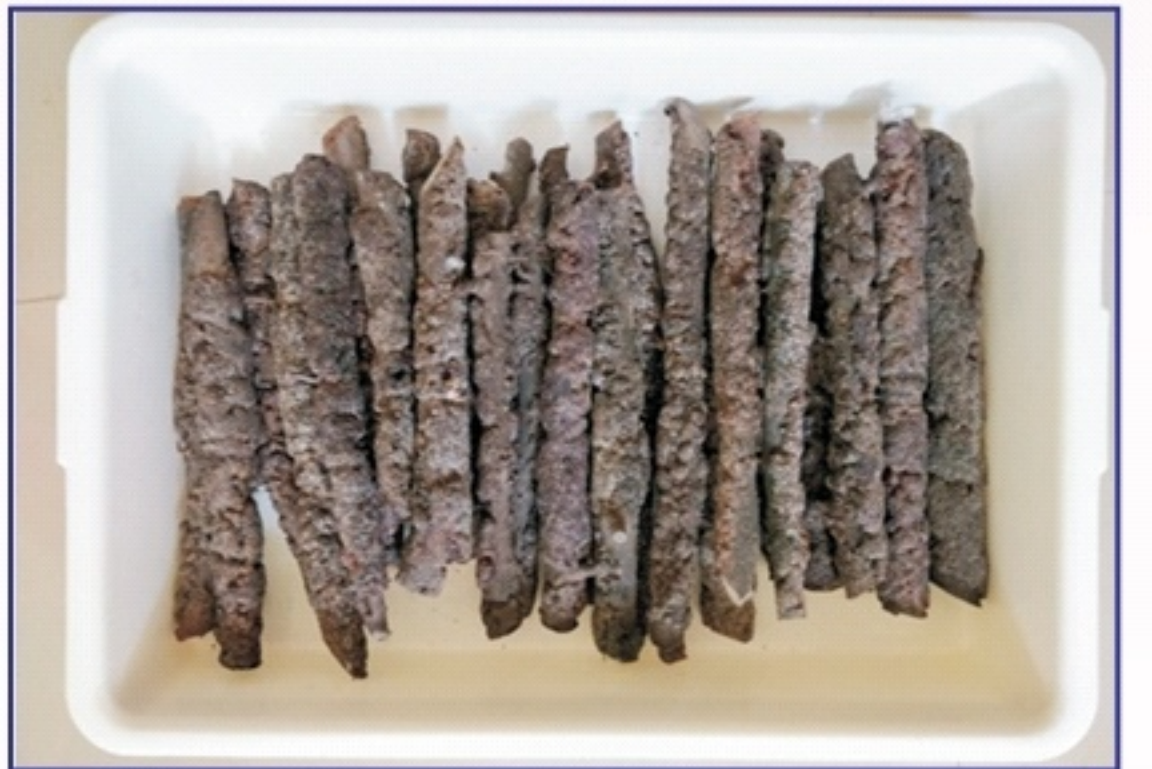
પરિપક્વ લાખની સ્ટીક