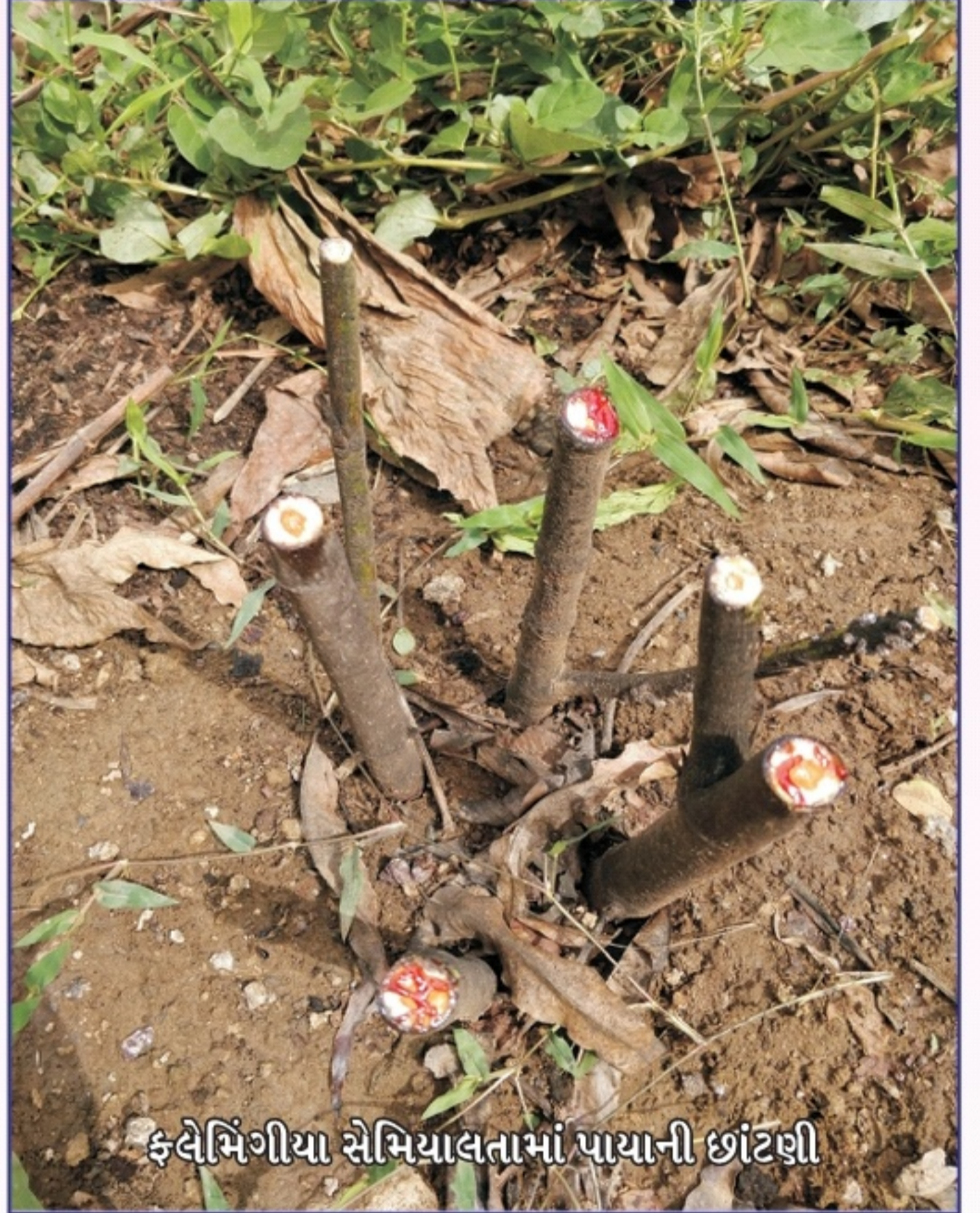
ફ્લેમિંગીયા સેમિયાલતામાં પાયાની છાંટણી

પલાસ અને બોરડીમાં લાખના બચ્ચાંઓ ચઢાવવાના છ મહિના પહેલા અને કુસુમમાં ૧૮ મહિના પહેલા છાંટણી કરવી જોઈએ, છાંટણીનો સમય સ્થાનિક પરિસ્થિતિને ધ્યાને લઈને કરવો જોઈએ.