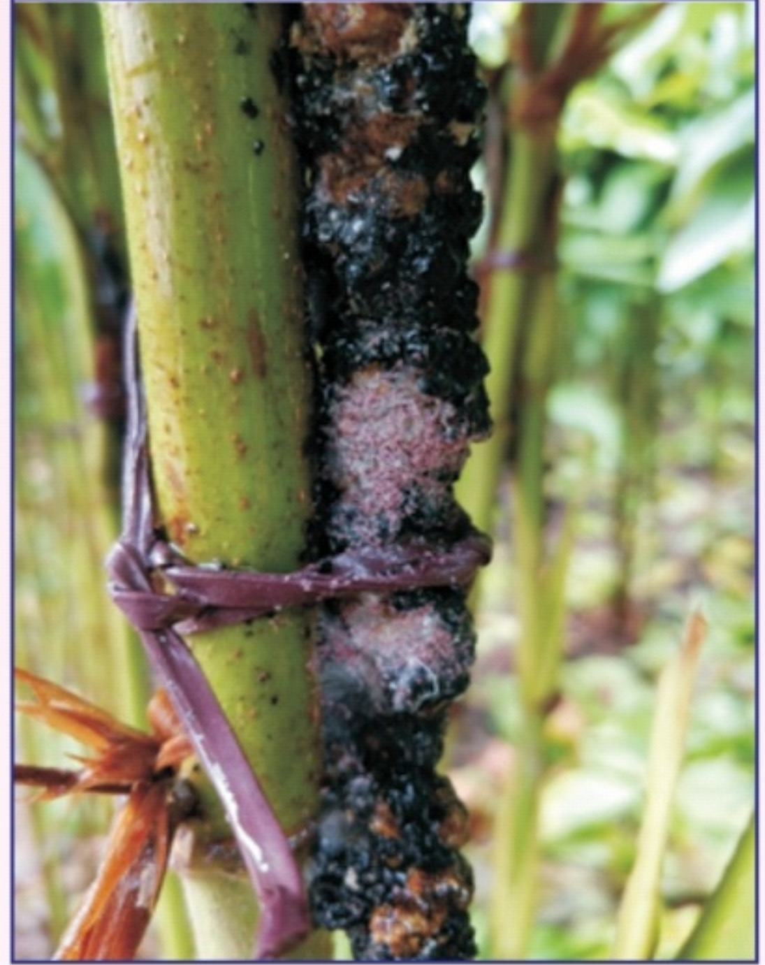
યજમાન પાક પર બાંધેલ શ્રુડ લેક