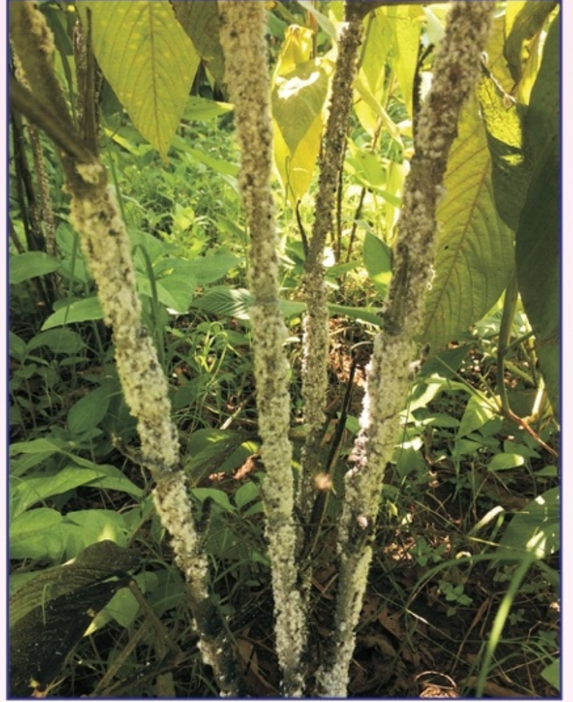
ફ્લેમિંગીયા સેમીયાલતાના પાકમાં લાખથી આચ્છાદિત કોચલા