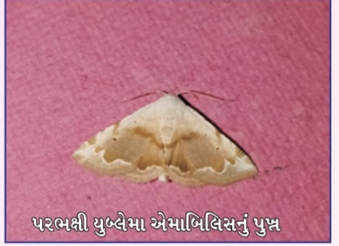
પરભક્ષી યુબ્લેમા એમાબિલિસનું પુખ્ત