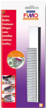
8700 04 FIMO® Cutter 3-teiliges Messerset mit besonders scharfen Klingen zum mühelosen Schneiden, bestens geeignet für akku- rate Schnitte.