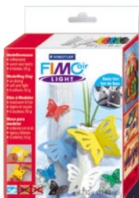
8133 01 Basic-Set mit 6 Farben à 55 g