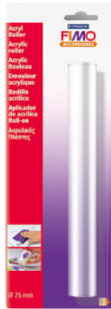
8700 05 FIMO® Acryl Roller zum gleichmäßigen Ausrollen von FIMO für eine besonders glatte Oberfläche.