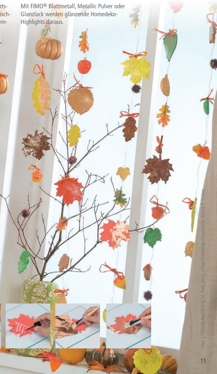
Idee: S. Gärtner, Ausführung: M. Dold, Fotos: UZavel Fotodesign/Glasmann, Styling: K. Schleg