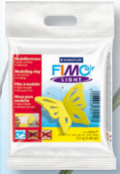
8133- 125 g Block erhältlich in 6 kräftigen Farben

Hier wird ein einfaches Glasgefäß zu einer stilvollen Blumenvase. Interessante Oberflächenstrukturen entstehen durch Einritzen oder Eindrücken von stark strukturierten Gegenständen. Die Trockenzeit des gesamten Objekts variiert je nach Größe und Wandstärke.