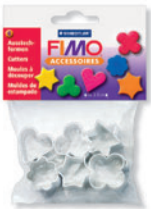
8724 03 FIMO® Ausstechformen aus Metall