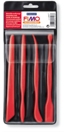
8711 FIMO® Modellierwerkzeug 4 verschiedene Modellierstäbe aus Kunststoff