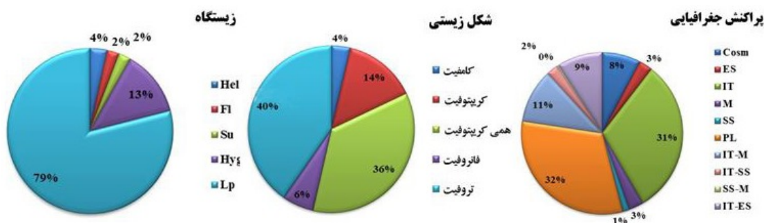
شکل ۲- نمودارهای وضعیت رویشی، شکل زیستی و پراکنش جغرافیایی گونه‌های گیاهی. Figure 2. Habitat, biological form and corology diagrams of plant species.

جدول ۲- فهرست گونه‌های گیاهی شناسایی شده در رویشگاه‌های آبی استان کرمانشاه. علائم اختصاری وضعیت رویشی: Hel= برآمده از آب، Hyd= آبی، =Fl) شناور، =Su) غوطه‌ور، =Hyg) رطوبت‌پسند، (LP) Land plant = گیاهان خشکی؛ شکل‌های زیستی (Life form): Cha) کامفیت، Cr) کریپتوفیت، Hem) همی کریپتوفیت، Pha) فانروفیت، Thr) تروفیت، پراکنش جغرافیایی (Chorotype): Cosm) جهان وطنی، ES) اروپا- سبیری، Hyr) هیرکانی، IT) ایرانی- تورانی، Z) زاگرسی، M) مدیترانه‌ای، PL) چند ناحیه‌ای، SS) صحاراسندی.