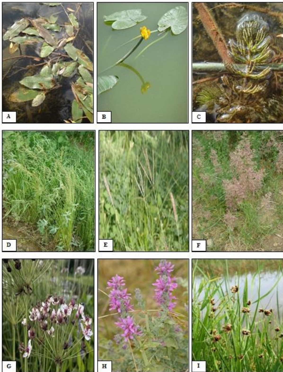
شکل ۳- تصاویر ۹ گونه گیاهی حاضر در رویشگاه‌های مورد بررسی.

Figure 3. Photographs of nine plant species in the studied habitats, A. Potamogeton nodosus . B. Nuphar lutea . C. Ceratophyllum demersum . D. Catabrosa aquatic . E. Bothriochloa ischaemum . F. Calamogasteris pseudo . G. Butomus umbellatus . H. Lythrum salicaria . I. Bolboschoenus maritimus .