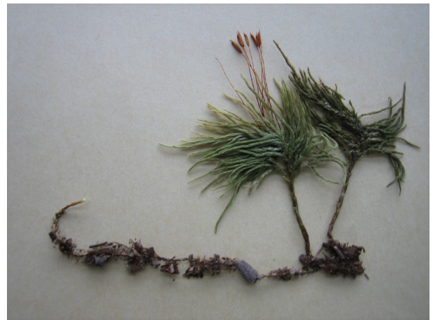
図2. 蒴を付けたコウヤノマンネングサ。

山頂より明神峠方面に少し下った斜面のブナ倒木に着生していた。関東地方では埼玉県両神村の1ヶ所からのみ報告があったが(伊藤, 1998), 今回の調査で神奈川県からも記録された。本種は関東以西に分布し、低地から高地まで幅広く生育する。埼玉県, 神奈川県の産地はいずれも山地性で千葉県からはまだ記録がない(古木, 2002)。今のところ埼玉県が分布の東端と考えられる。