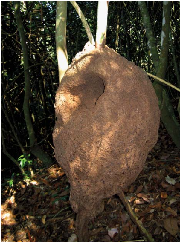
6.6.5.3. Ninho arborícola de Silvestritermes holmgreni .