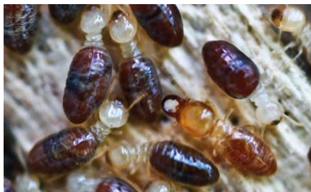
6.6.5.10. Operários e soldados de Amitermes amifer sobre um galho de madeira em decomposição.

É representada por espécies com soldados com mandíbulas fortemente esclerotizadas e bem desenvolvidas. Foram encontradas sete espécies na Reserva: Amitermes amifer (6.6.5.10), Cavitermes tuberosus , Dihoplotermes inusitatus , Microcerotermes strunckii , Neocapritermes guyanae , Neocapritermes cf. talpa e Termes medioculatus . Dentre elas, a espécie construtora de ninhos conspícuos na área foi M. strunckii .