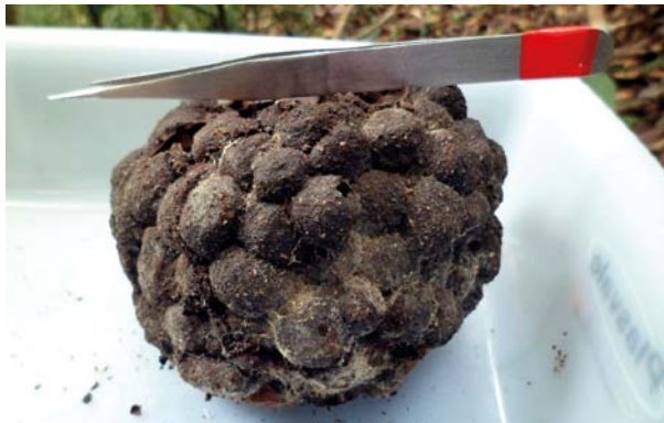
6.6.5.4. Ninho de Nasutitermes gagei encontrado no interior de tronco em decomposição.

Os maiores valores de riqueza de espécies (número de espécies de uma localidade) e biomassa (peso vivo dos indivíduos) de térmitas estão presentes nas florestas tropicais e subtropicais, verificando-se um declínio nestes parâmetros com o aumento da distância da Linha do Equador. Numa floresta, a riqueza de espécies de térmitas pode ser influenciada por vários fatores ambientais, como chuva, temperatura, disponibilidade de recursos e tipo de solo.