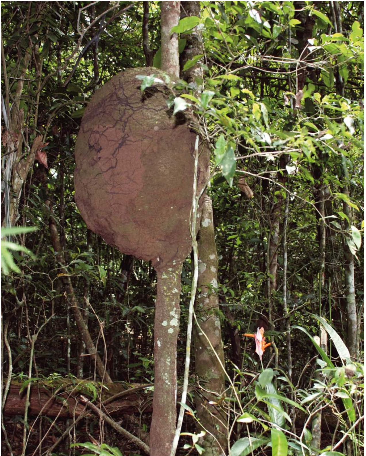
Ninho de Nasutitermes ephratae .