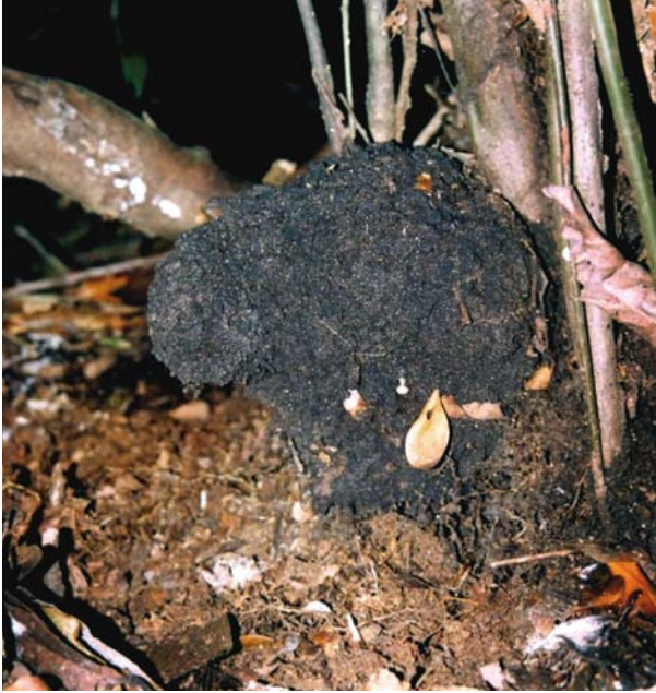
6.6.5.7. Ninho arborícola de Anoplotermes banksi preso à base de uma árvore.

espécie que constrói pequenos ninhos arborícolas, geralmente na base das árvores.