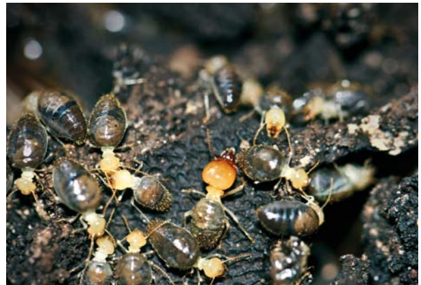
6.6.5.9. Operários e um soldado de Labiatermes labralis caminhando no interior do ninho.

Esta subfamília é caracterizada por soldados que possuem concomitantemente mandíbulas bem desenvolvidas e tubo frontal. Foram encontradas cinco espécies na área: Embiratermes neotenicus , E. parvirostris , Labiatermes labralis , Silvestritermes holmgreni , Syntermes molestus e S. nanus . Foram encontrados ninhos conspícuos das espécies E. neotenicus , L. labralis (6.6.5.9) e S. holmgreni .