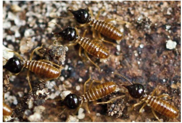
6.6.5.8. Soldados de Nasutitermes corniger voltando para a galeria construída pelos operários.

É representada por espécies com soldados com mandíbulas vestigiais e tubo frontal bem desenvolvido, formando o "naso". A maioria das espécies é consumidora de madeira e algumas constroem ninhos arborícolas bem característicos. Foram encontradas na Reserva oito espécies dessa subfamília: Diversitermes diversimilis , Nasutitermes corniger , N. ephratae , N. gaigei , N. jaraguae , N. rotundatus , Subulitermes microsoma e Velocitermes velox . O gênero Nasutitermes foi o mais representativo em número de espécies. As espécies construtoras de ninhos conspícuos na área foram: Nasutitermes corniger (6.6.5.8) e N. ephratae .