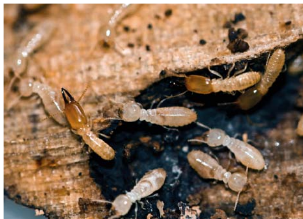
6.6.5.6. Soldados e operários de Heterotermes longiceps . Notar que os soldados são mais esclerotizados e possuem mandíbulas mais desenvolvidas.

O comportamento de construir seus ninhos abaixo da superfície do solo os protege dos efeitos da desidratação, assim como de inimigos naturais, principalmente formigas. Numa floresta podem ser encontrados principalmente no interior de troncos úmidos em decomposição. Na Reserva foram encontradas duas espécies: Heterotermes longiceps (6.6.5.6) e Rhinotermes hispidus .