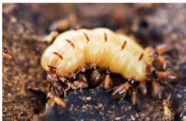
6.6.5.1. Rainha fisogástrica de Nasutitermes ephratae , com abdômen bastante dilatado em relação ao restante do corpo (cabeça e tórax, à esquerda).

O rei é menor que a rainha e geralmente vive ao seu lado no interior de uma câmara real. Os soldados são responsáveis pela defesa da colônia e possuem várias estratégias para afugentar os inimigos, desde mandíbulas poderosas até estruturas pontiagudas na parte frontal da cabeça, chamadas de “naso”, que esguicham substâncias químicas (6.6.5.2). Os operários são os mais numerosos na colônia e são responsáveis pela construção, reparo e limpeza dos ninhos, cuidados com os ovos e jovens, forrageamento e até pela defesa da colônia. Eles também são incumbidos de alimentar as outras castas.