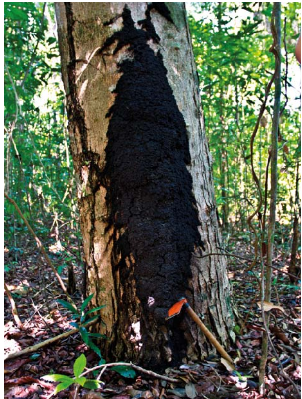
6.6.5.5. Ninho de Labiotermes labralis construído na base de uma árvore. Esses ninhos também podem ser construídos sobre pedaços de árvores mortas.