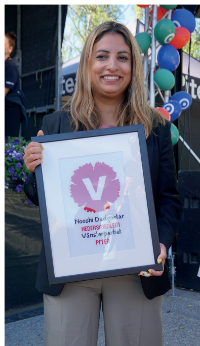
Nooshi Dadgostar, partiledare och nu även hedersmedlem i V-Piteå.