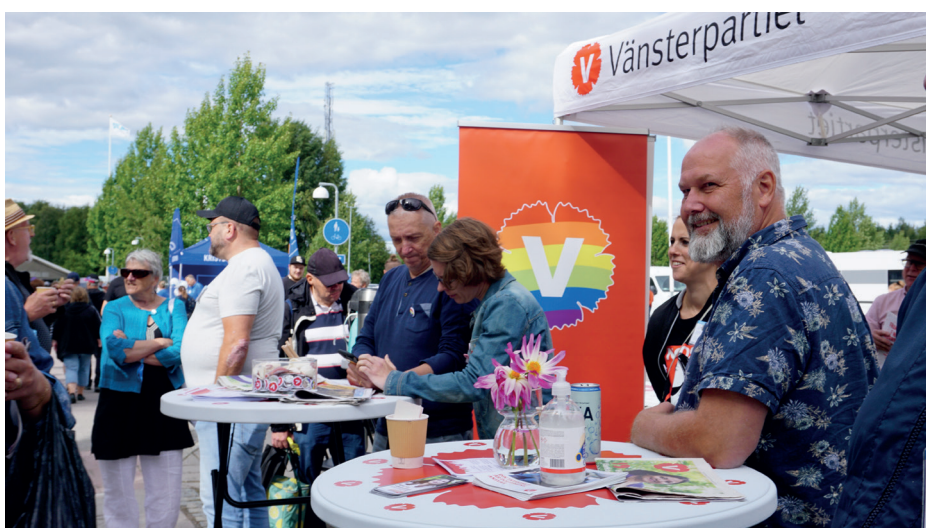
Vi bjöd på kaffe och det blev många samtal runt borden...