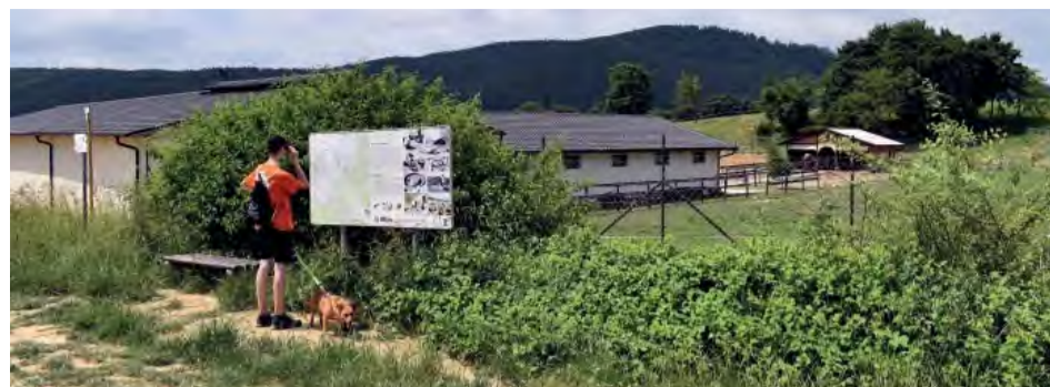
Nová cyklotrasa by mala viesť aj okolo stajni Kaňová.

Mesto Trenčianske Teplice plánuje vybudovať cyklotrasu, ktorá by mala prepájať mestá Nová Dubnica a Trenčianske Teplice. Keďže celý tento projekt je realizovaný hlavne v katastrálnom území Trenčianskych Teplic, bytostne sa to týka Mestského úradu Trenčianskych Teplic.