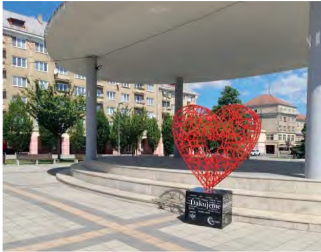
Umiestnením svetelného srdca sa aj naše mesto pripojilo ku odkazu vďaky zdravotníkom.

Od 8. júna sa objavilo na Mierovom námestí srdce s nápisom „Ďakujeme“ v mnohých jazykoch. Každý si ho všimol, niektorých prekvapilo, niektorých potešilo, niekto mávól rukou a mnohí sa pýtali, čo to znamená.