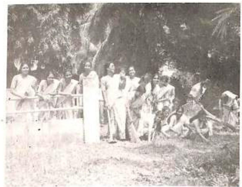
ছাত্ৰী একতা সভাৰ এন, এন, এচ, বিভাগৰ জৰিয়তে কলেজ চৌহদ পৰিষ্কাৰ কৰা কাৰ্য্যসূচীত অংশ গ্ৰহণ কৰা ছাত্ৰীসকলৰ একাংশ। ১৯৮৯-৯০