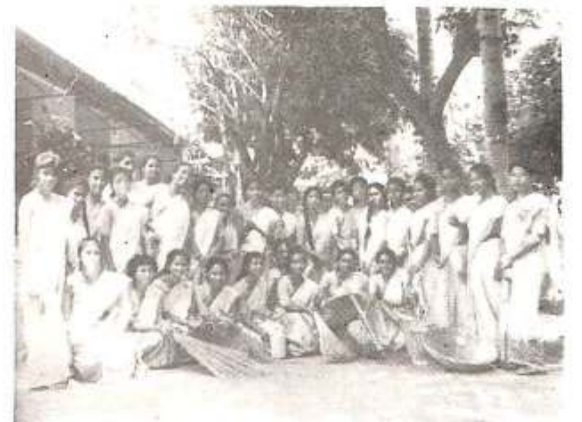
এন, এন, এচ, বিভাগৰ জৰিয়তে কলেজ চৌহদ পৰিষ্কাৰ কৰা কাৰ্য্যসূচীত অংশ গ্ৰহণ কৰা ছাত্ৰীসকলৰ একাংশ। ১৯৮৯-৯০