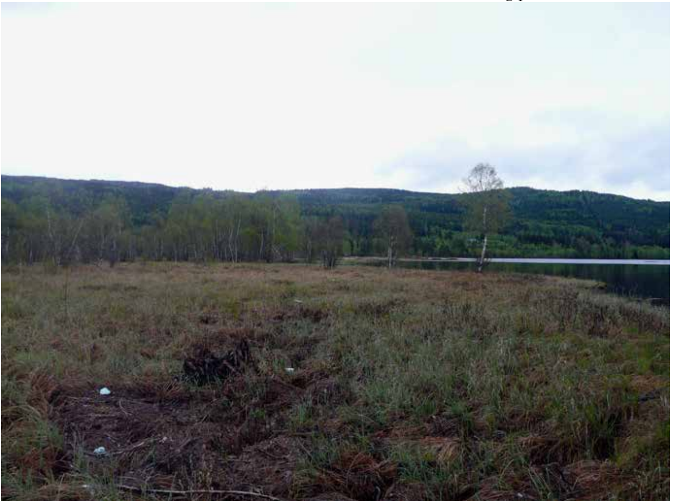
Takseringspunkt 14, 23. mai 2010.