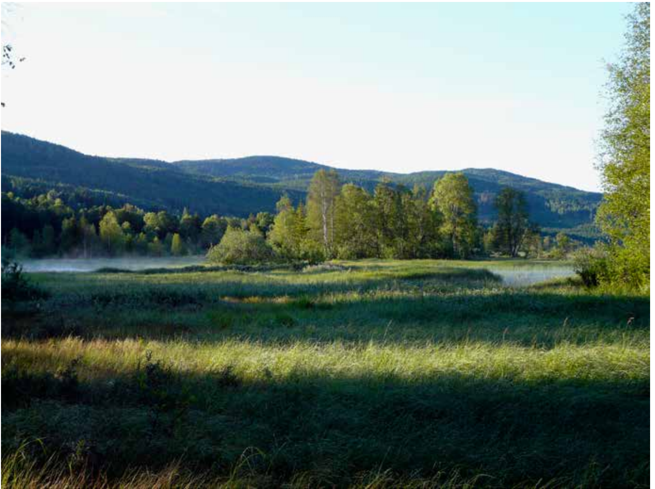
Takseringspunkt 8–9, 24. juli 2010.