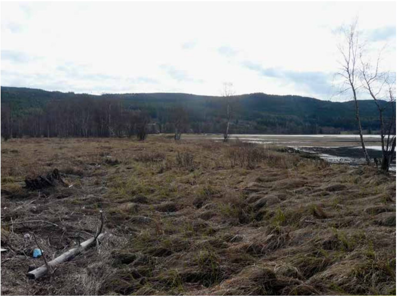
Takseringspunkt 14, 9. mai 2010.