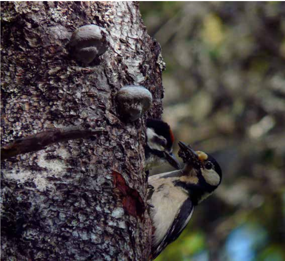
Flaggspett, 20. juni 2010.