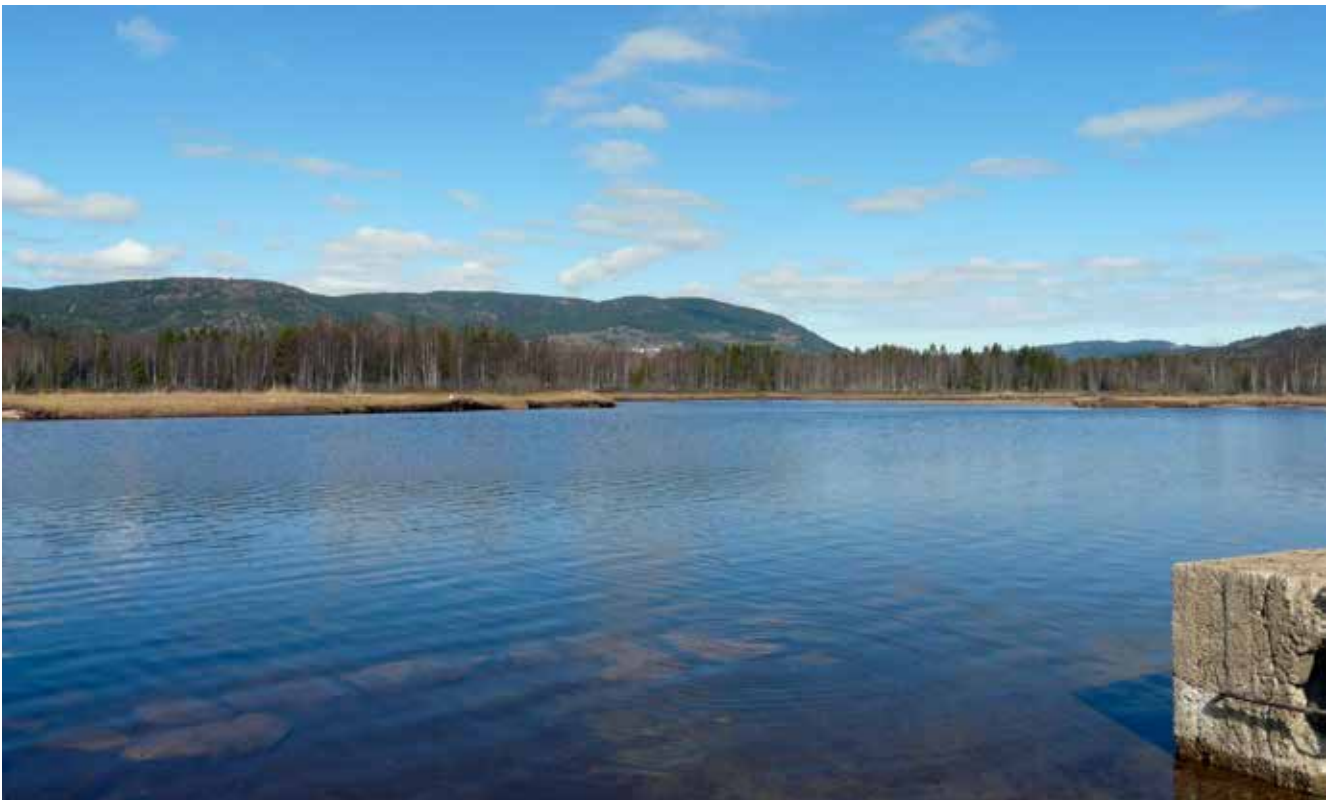
Knaimyrene sett fra Åsand i NØ, 9. mai 2010.