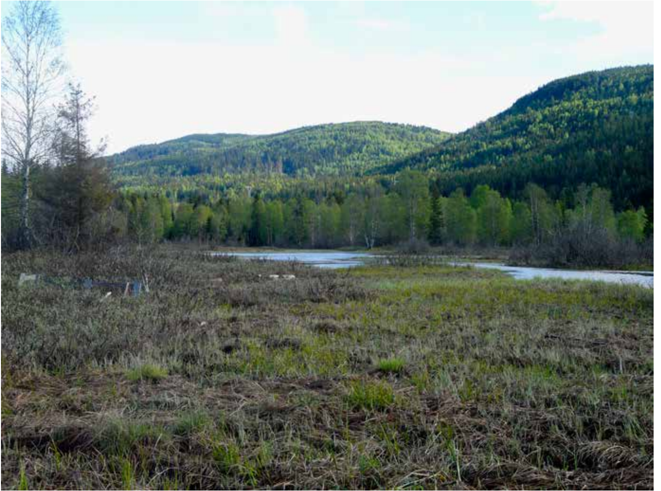
Takseringspunkt 16–17, 23. mai 2010.