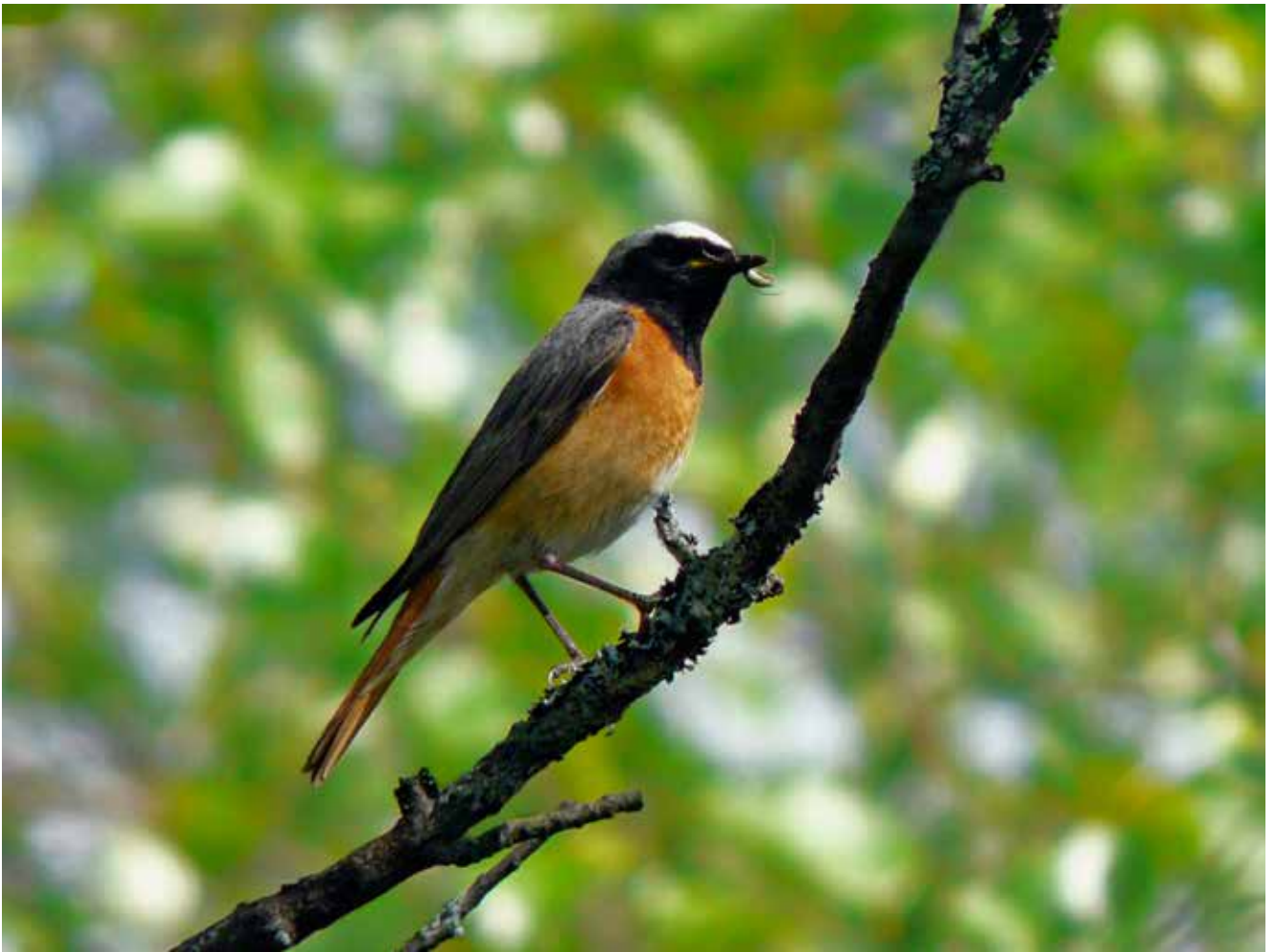
Rødstjert ved takseringspunkt 13, 20. juni 2010.