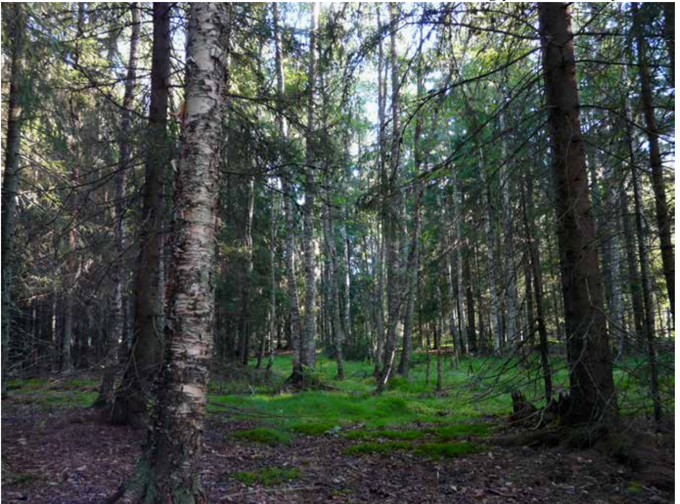
Takseringspunkt 12–13, 24. juli 2010.