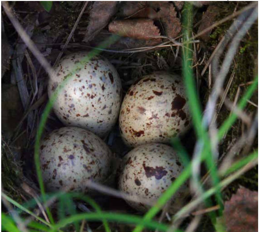
Reir av enkeltbekkasin, 20. juni 2010.