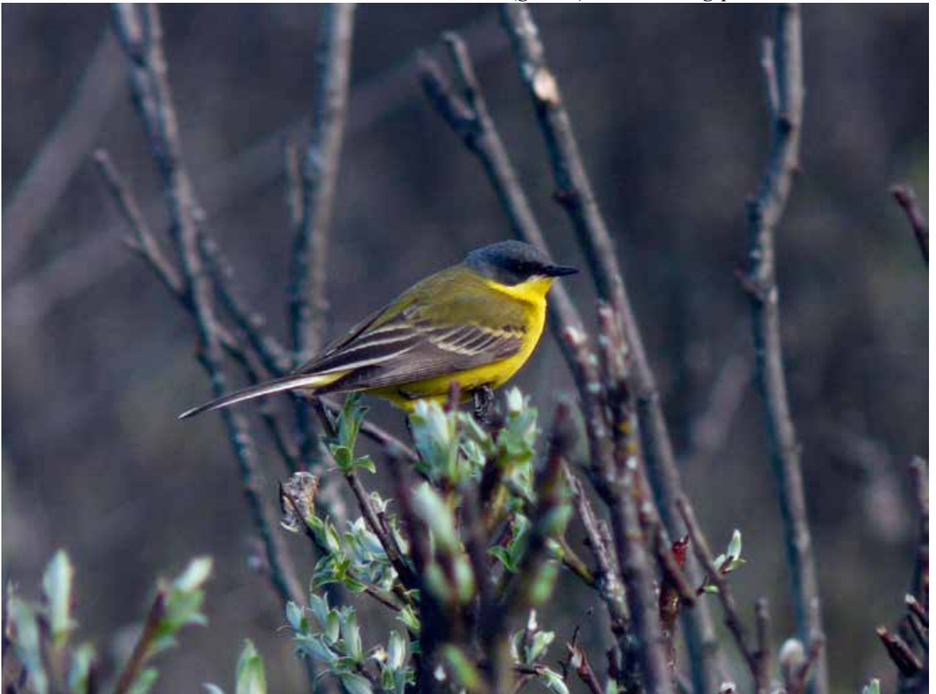
Såerle (gulerle) ved takseringspunkt 17, 23. mai 2010.