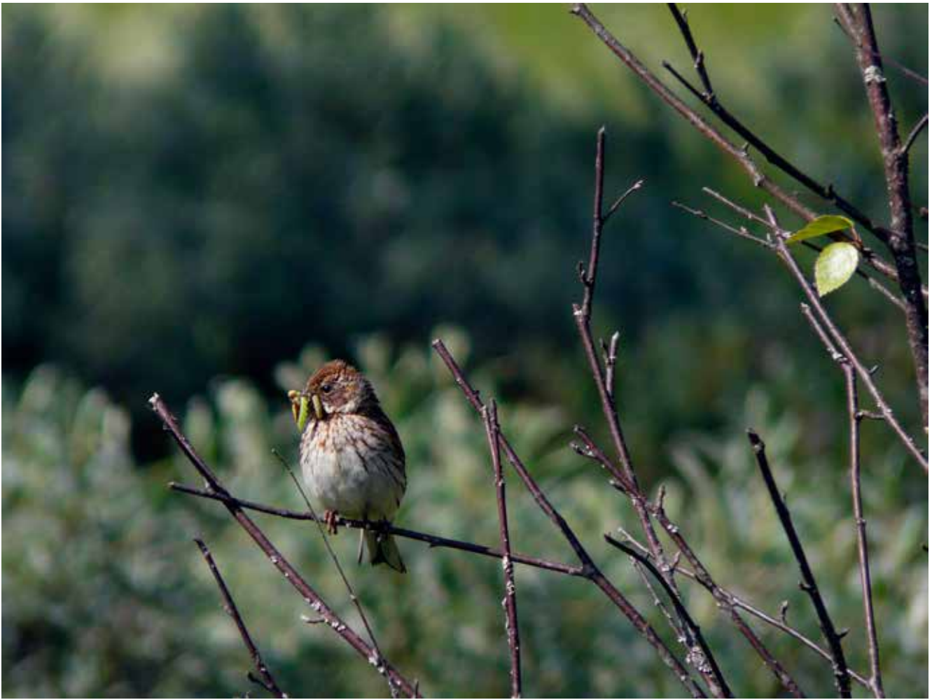
Sivspurv, 20. juni 2010.