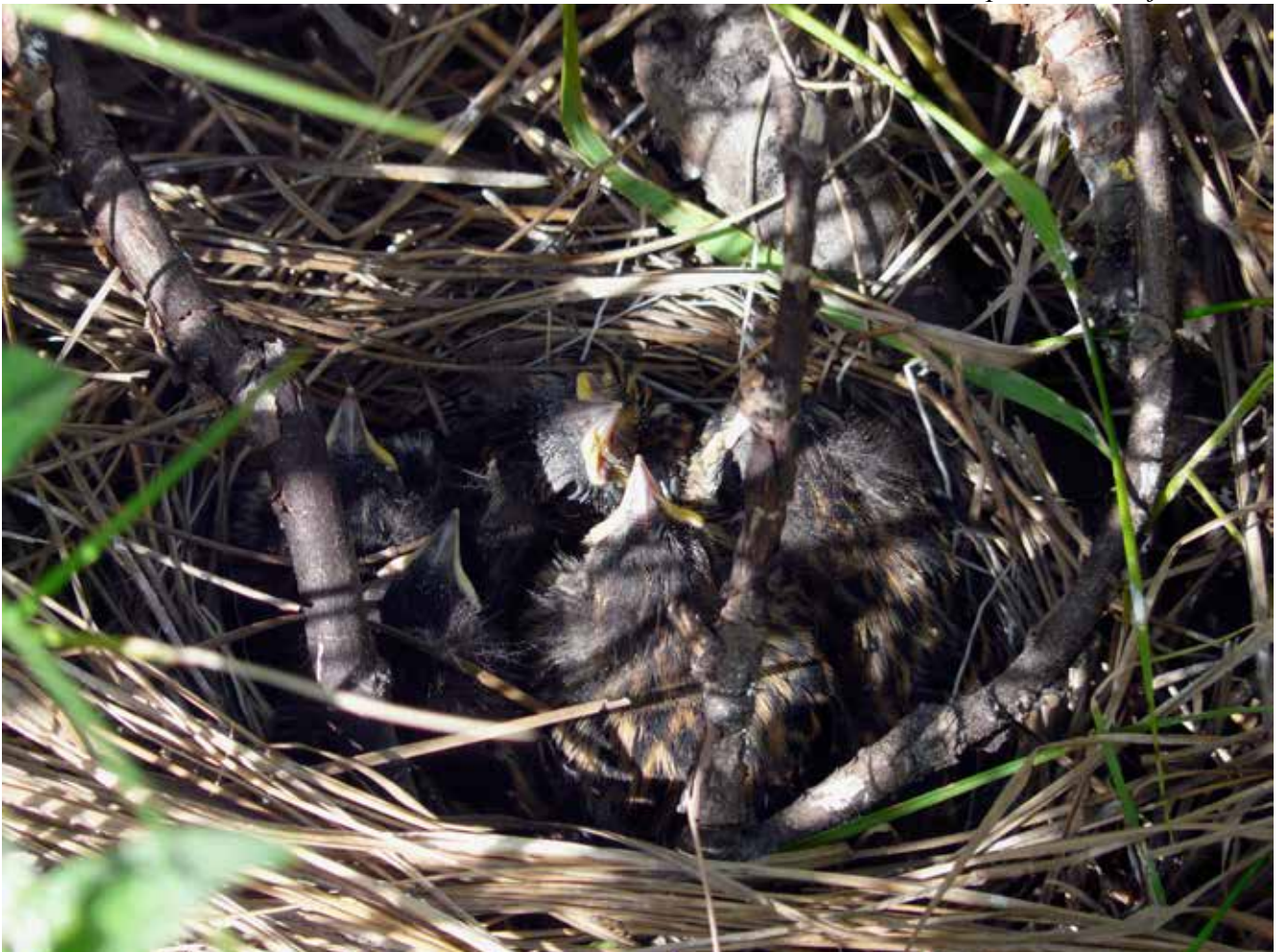
Sivspurvveir, 20. juni 2010.