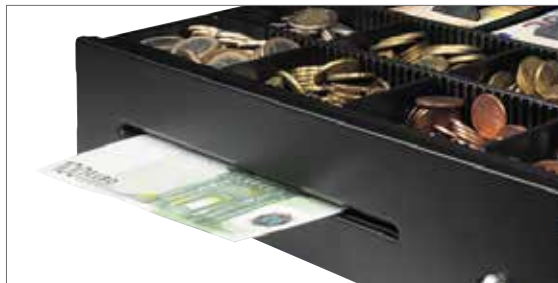
Mit Separierungsschlitz für Banknoten mit hohem Nennwert

Alle Produkte unserer LD und SD Kassenlagen werden aus soliden Materialien gefertigt. Das robuste Stahlgehäuse und das bruchsichere PVC-Fach mit stabilen Metall-Geldklemmen wurden für mittelstark frequentierte Einsatzorte, wie z.B. Schul- und Bürocafeterien sowie Klubhaus-Kantinen, entwickelt. Die SD Produktreihe verfügt über widerstandsfähige Kugellagerrollen und einen robusten Schließmechanismus, der garantiert mindestens 1 Million störungsfreie Öffnungs-/Schließvorgänge ermöglicht. Für den regelmäßigen Gebrauch stellen alle Produkte unserer LD Produktreihe eine kostengünstige Lösung dar, ohne Kompromisse hinsichtlich der Qualität und Zuverlässigkeit eingehen zu müssen. Mit einer Reihe von ergänzendem Zubehör, wie abschließbare Deckel und Münzschalen, bieten unsere LD und SD Produktreihen eine Komplettlösung für jede mittelstark frequentierte POS-Umgebung an.