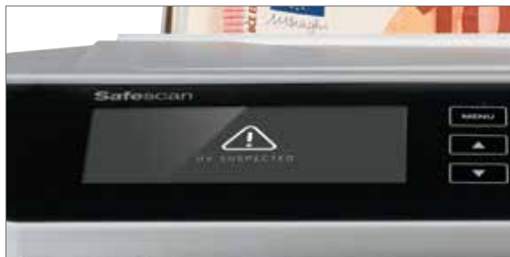
100% getestete Echtheitsprüfung