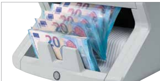
Zählt bis zu 1.000 Geldscheine pro Minute

Spart Zeit und eliminiert das Fehlerrisiko komplett. Der hintenliegende Aufnahmetrichter des Safescan 2210 und 2250 kann bis zu 300 Banknoten aufnehmen und zählt diese exakt - für bis zu 1.000 Scheine pro Minute. Heutige Währungen sind mit hochentwickelten Sicherheitsmerkmalen versehen, die Geldfälschern kaum noch eine Chance lassen. Der Safescan 2210 und 2250 prüft jede Banknote automatisch auf bis zu drei verschiedene Sicherheitsmerkmale: UV-Markierungen, magnetische Eigenschaften und Geldscheingröße. Das Gerät stoppt und gibt Alarm, wenn eine mutmaßlich gefälschte Banknote erkannt wird; entfernen Sie dann einfach den entsprechenden Geldschein und drücken Sie auf Start, um die Zählung fortzusetzen.