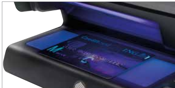
Prüft UV-Merkmale auf Banknoten, Kreditkarten und Ausweisdokumenten

Jede moderne Banknote verfügt über integrierte UV-Sicherheitsmerkmale, die nur unter UV-Licht mit einer bestimmten Frequenz sichtbar werden. Der Safescan 70 wurde speziell zur Überprüfung dieser Merkmale und zur Erkennung mutmaßlich gefälschter Banknoten entwickelt. Für eine umfassende manuelle Falschgeldererkennung verfügt der Safescan 70 über einen integrierten Weißlichtbereich, der Sie bei der visuellen Erkennung des metallischen Sicherheitsfadens, der Wasserzeichen und des Mikrotexes moderner Banknoten unterstützen soll. Mit 16 leistungsstarken und zugleich stromsparenden LEDs macht der Gegenlichtbereich diese Sicherheitsmerkmale von Banknoten für eine schnelle und einfache Erkennung deutlich sichtbar.