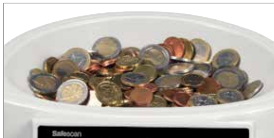
Kapazität des Aufnahmefachs bis zu 500 Münzen

Dank seinem großen Aufnahmetrichter kann der Safescan 1250 bis zu 500 Münzen aufnehmen und mit einer Geschwindigkeit von bis zu 220 Münzen pro Minute ist der Inhalt Ihrer Kassenlade blitzschnell gezählt. Schütten Sie einfach alle Münzen aus dem Münzbehälter oder aus der Tasche in den Aufnahmetrichter - eine vorherige Sortierung ist nicht erforderlich - und drücken Sie auf Start. In nur einem Bruchteil der normalerweise hierfür benötigten Zeit rechnen die Münzzähler von Safescan Ihr Kleingeld zusammen und geben es sogar sortenrein an Sie zurück - perfekt zur Vorbereitung von Münzrollen, Bankeinzahlungen und Kassenladen. Es gibt keinen schnelleren und zuverlässigeren Weg zur Sortierung und Zählung Ihres Kassenbestandes am Ende eines langen Arbeitstages.