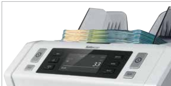
Einlage oben für einen kontinuierlichen Einzug

Spart Zeit und eliminiert das Fehlerrisiko komplett. Der große Aufnahmetrichter des Safescan 2660-S und 2680-S kann bis zu 500 Banknoten aufnehmen und drei anpassbare Geschwindigkeiten bieten Ihnen ein Maximum an Flexibilität, Zuverlässigkeit und Effizienz - mit bis zu 1.500 Scheinen pro Minute. Der obenliegende Aufnahmetrichter des Safescan 2660-S und 2680-S erlaubt einen kontinuierlichen Einzug von Banknoten während des Betriebes - ideal zum Einsatz unter Bedingungen, wo Zeit und eine 100%ige Genauigkeit von höchster Wichtigkeit sind.