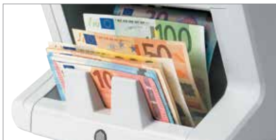
Wertzählung für gemischte Banknoten für bis zu 8 Währungen

Spart Zeit und eliminiert das Fehlerrisiko komplett. Der große Aufnahmetrichter des 2665-S und 2685-S kann bis zu 500 Banknoten aufnehmen und drei anpassbare Geschwindigkeiten bieten Ihnen ein Maximum an Flexibilität, Zuverlässigkeit und Effizienz - mit bis zu 1.500 Scheinen pro Minute. Die Modelle 2665-S und 2685-S verwenden die modernste Technologie zur Falschgeldererkennung für die Prüfung von sieben fortschrittlichen Sicherheitsmerkmalen heutiger Währungen: UV-Tinte, Infrarottinte, magnetische Farbe, Sicherheitsfaden, Farbe, Größe und Dicke. So wissen Sie mit 100%iger Sicherheit, ob eine Banknote echt oder eine Fälschung ist.