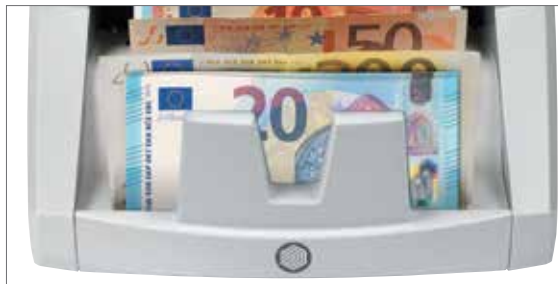
Schnelle Wertzählung von gemischten Euro-Banknoten

Spart Zeit und eliminiert das Fehlerrisiko komplett. Der große Aufnahmetrichter des Safescan 2465-S kann bis zu 200 Banknoten aufnehmen und zählt diese exakt - bis zu 1.000 Scheine pro Minute. Der Safescan 2465-S verwendet die modernste Technologie zur Falschgeldererkennung für die Prüfung von sieben fortschrittlichen Sicherheitsmerkmalen heutiger Währungen: UV-Tinte, Infrarottinte, magnetische Farbe, Sicherheitsfaden, Farbe, Größe und Dicke. So wissen Sie mit 100%iger Sicherheit, ob eine Banknote echt oder eine Fälschung ist.