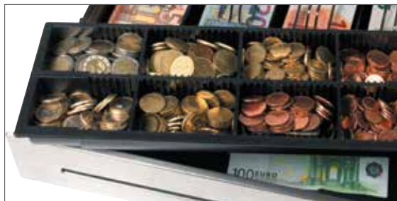
Verschiedene Einsätze verfügbar

Die Safescan HD Kassenladen werden aus soliden und robusten Materialien gefertigt. Das massive Stahlgehäuse und das bruchsichere PVC-Fach mit robusten Metall-Geldklemmen wurden für den konstanten Dauerbetrieb entwickelt: Perfekt geeignet für stark frequentierte Geschäfte, wie Restaurants, Bars und Tankstellen. Die HD Produktreihe verfügt über ein Aufhängungssystem mit Stahlkugellagerrollen von Industrie-Qualität und einem hoch belastbaren Schließmechanismus, der garantiert mindestens 2 Millionen störungsfreie Öffnungs-/Schließvorgänge ermöglicht. Erhältlich in 2 Standardgrößen, jede mit dem passenden Zubehör, wie abschließbare Deckel und Ersatzfächer - so finden Sie immer eine Safescan Heavy-Duty Kassenlade, die Ihren Ansprüchen am POS gerecht wird.