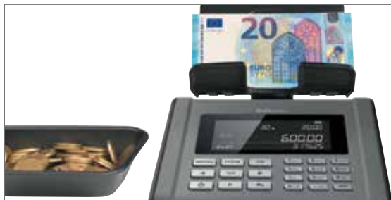
Schnelles und einfaches zählen von Münzen und Banknoten

Der Safescan 6185 Geldzähler verfügt über eine Vielzahl an automatischen Funktionen, welche die Geldzählung am Ende eines langen und anstrengenden Arbeitstages zum Kinderspiel machen. Zählen Sie Münzen und Banknoten, ob lose, verpackt oder gebündelt; addieren Sie EC- und Kreditkartenzahlungen versehen Sie jeden Zählvorgang mit einer Referenznummer und einem Zeitstempel; der Kassenstand am Anfang des Tages wird automatisch vom Gesamtbetrag abgezogen: Der 6185 wurde als ultimativer, ganzheitlicher und zeitsparender Geldzähler entworfen. Der 6185 setzt eine hochentwickelte Geldwiege-Technologie ein, um schnell und zuverlässig Münzen, Banknoten und unbare Werte, wie Gutscheine und Wertmünzen, zu zählen - schneller und genauer als der erfahrenste Kassierer. Zur weiteren Vereinfachung Ihrer Verwaltungsaufgaben kann der 6185 Geldzähler die kompletten Ergebnisse automatisch mit Hilfe des optionalen Safescan TP-230 Thermodruckers ausdrucken oder sie in die optionale Safescan MCS Software exportieren.