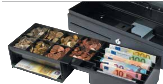
Herausnehmbares Fach für schnelle Schichtwechsel

Wie alle anderen Produkte in unserer SD Produktreihe auch, wird die SD-4617S und HD-4617C Klappdeckel-Kassenlade aus soliden Materialien gefertigt. Das robuste Stahlgehäuse und das bruchsichere PVC-Fach wurden für mittelstark frequentierte Einsatzorte, wie Schul- und Bürocaterien sowie Klubhaus-Kantinen, entwickelt. Die SD-4617S und HD-4617C verfügt über einen robusten Stahldeckel und widerstandsfähigen Schließmechanismus, der garantiert mindestens 1 Million störungsfreie Öffnungs-/Schließvorgänge ermöglicht. Die kompakten Maße der SD-4617S und HD-4617C ermöglichen einen einfachen Einsatz in allen Umgebungen, egal ob der Benutzer sitzt oder steht. Der ausgiebig getestete Deckel öffnet in vollem 80° Grad Winkel für einen einfachen Zugriff ohne Biegen oder Dehnen und selbst eine sanfte Berührung aktiviert den stabilen, zentriert angebrachten Schließ- und Öffnungsmechanismus.