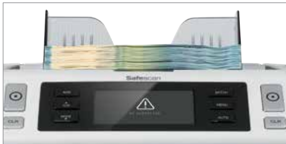
100% getestete Echtheitsprüfung