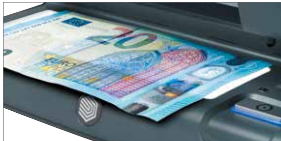
Großer Weißlichtbereich mit 16 LEDs für die Überprüfung von Wasserzeichen, Metallfaden und Mikrotex