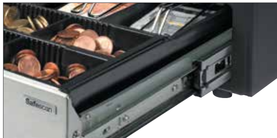
Hochleistungsfähige Teleskopschienen, getestet für bis zu 2 Millionen Öffnungen