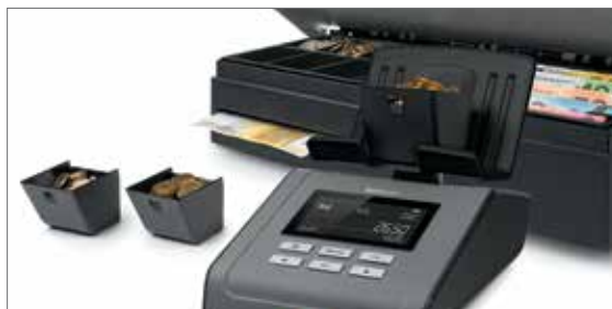
Ideal zur Verwendung in Kombination mit der Safescan Kassenlade und den 4617CC Münzbechern