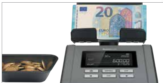
Schnelles und einfaches zählen von Münzen und Banknoten

Der Safescan 6165 wurde entwickelt, um das einfache Zählen von Bargeld am Ende eines langen, anstrengenden Geschäftstags zu erleichtern. Rechnen Sie alle Ihre Münzen und Banknoten schnell und problemlos zusammen und ziehen Sie dabei automatisch den Kassenstand zum Tagesbeginn ab. Speichern und drucken Sie Ihre Ergebnisse zur einfachen Überprüfung. Der 6165 gewährleistet problemloses und genaues Zählen in nur wenigen Minuten. Zur weiteren Vereinfachung Ihrer Verwaltungsaufgaben kann der 6165 Geldzähler die kompletten Ergebnisse automatisch mit Hilfe des optionalen Safescan TP-230 Thermodruckers ausdrucken oder sie für die optionale Safescan MCS Software exportieren.