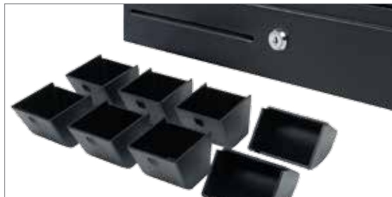
Das Safescan Münzbehälter-Set mit standardisiertem Gewicht, ideal für den Einsatz mit der 6165/6185 Geldwaage