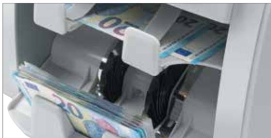
Doppelmagazin-Design zum einfachen sortieren und ausrichten von Banknoten

Der Safescan 2885-S und 2985-SX ist das ultimative Werkzeug für einfaches und effektives Zählen, Prüfen und Sortieren von Banknoten dank dem einzigartigen automatischen Währungserkennungssystem. Der 2885-S und 2985-SX kann mühelos einen Stapel gemischter Währungen bearbeiten und liefert Ihnen einen detaillierten Report mit Menge und Betrag pro Nennwert und je Währung. Dank ihres Doppelmagazin-Designs und der CIS-Technologie sortiert der Safescan 2885-S und 2985-SX blitzschnell verschiedene Nennwerte - und sogar verschiedene Währungen - und kann zudem Banknoten für zwei separate Stapelfächer einheitlich ausrichten, so dass ein perfekt sortierter Stapel von Banknoten entsteht. Um ein Höchstmaß an Sicherheit zu garantieren, verfügt er über eine umfangreiche 8-fache Falschgeldererkennung, welche den strengen Richtlinien der wichtigsten Zentralbanken entspricht. Jede verdächtige Banknote wird in dem oberen Fach abgelegt, die Zählung selbst wird dadurch nicht unterbrochen. Schnell, effektiv und mit 100%iger Genauigkeit.