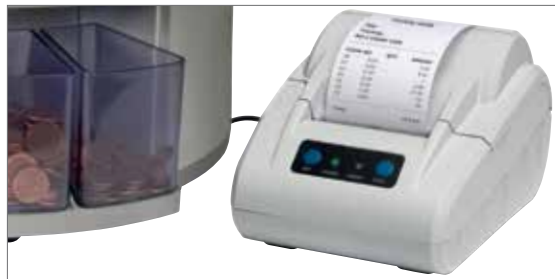
Auf dem optional erhältlichen Safescan TP-230 Thermobegdrucker können die Zählergebnisse ausgedruckt werden.