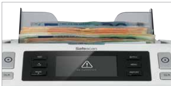
100% getestete Echtheitsprüfung