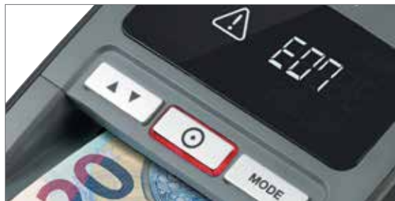
Alarmsignal, wenn eine mutmasslich gefälschte Banknote erkannt wird

Der Safescan 155-S, 165-S und 185-S ist Ihr ultimativer Schutz gegen gefälschte Banknoten, denn er prüft Geldscheine schnell, einfach und umfassend auf Echtheit. Und das für mehr als 12 verschiedene Währungen. Der Safescan 155-S, 165-S und 185-S setzen die aktuellste Technologie zur Falschgeldererkennung ein, um sieben moderne Sicherheitsmerkmale zu testen, welche heutige Währungen aufweisen: Infrarottinte, magnetische Tinte, metallischer Sicherheitsfaden, Dicke, Farbe, Größe und Wasserzeichen. Diese Technologie ist so zuverlässig, dass sie selbst doppelte und halbe Geldscheine erkennt. In weniger als einer halben Sekunde wissen Sie mit 100%iger Sicherheit, ob die Banknote in Ihrer Hand echt oder eine Fälschung ist - und nicht nur Sie, sondern auch Ihr Kunde, was eine unnötige Diskussion vermeidet.