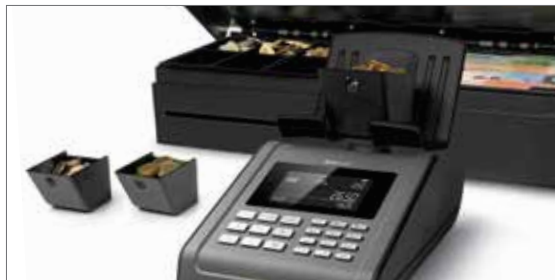
Ideal zur Verwendung in Kombination mit der Safescan Kassenlade und den 4617CC Münzbechern