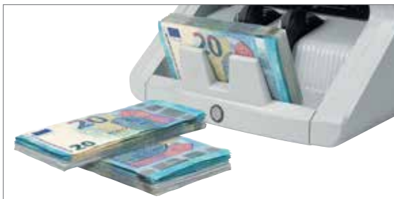
Bündel-Funktion zur Erstellung einer bestimmten, voreingestellten Anzahl an Banknoten