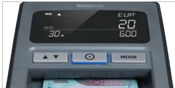
Anzeige von Wert und Gesamtbetrag der geprüften Banknoten