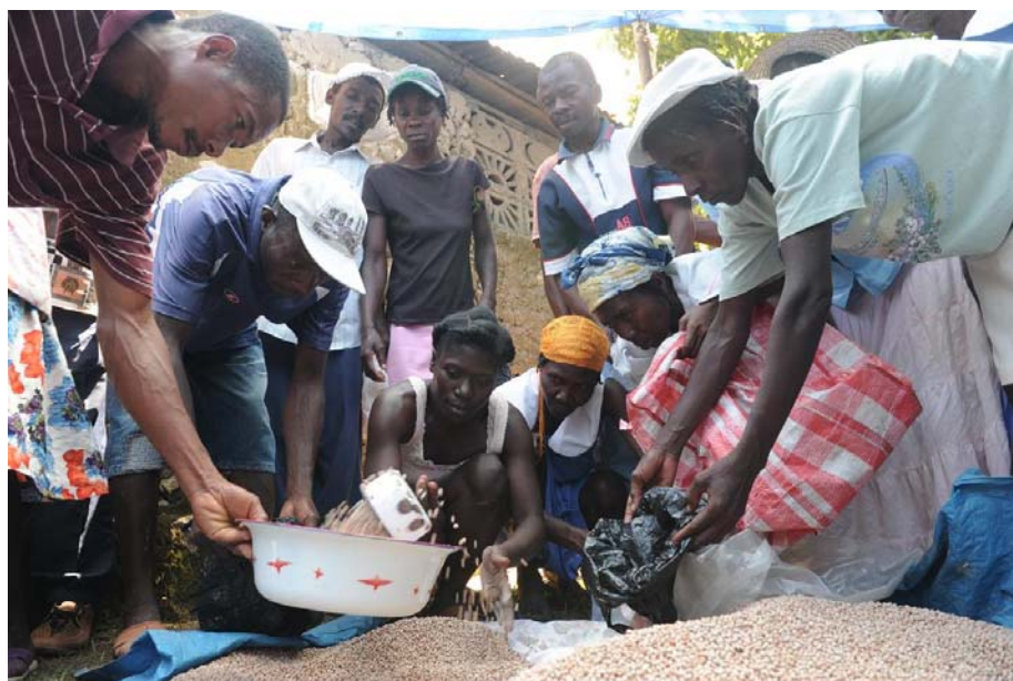
Distribución de semillas en Desvarieux.