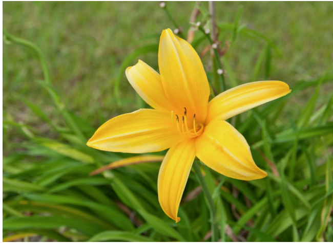
Hemerocallis flava L.