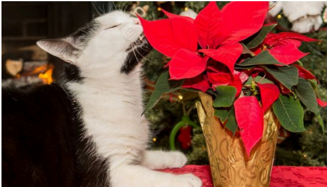
Gato comendo poinsettia ( Euphorbia pulcherrima ), planta tóxica para felinos.