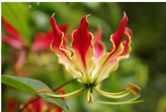
Gloriosa superba L.