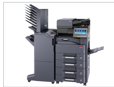
d-Copia 3502MFplus in maximaler Ausstattung