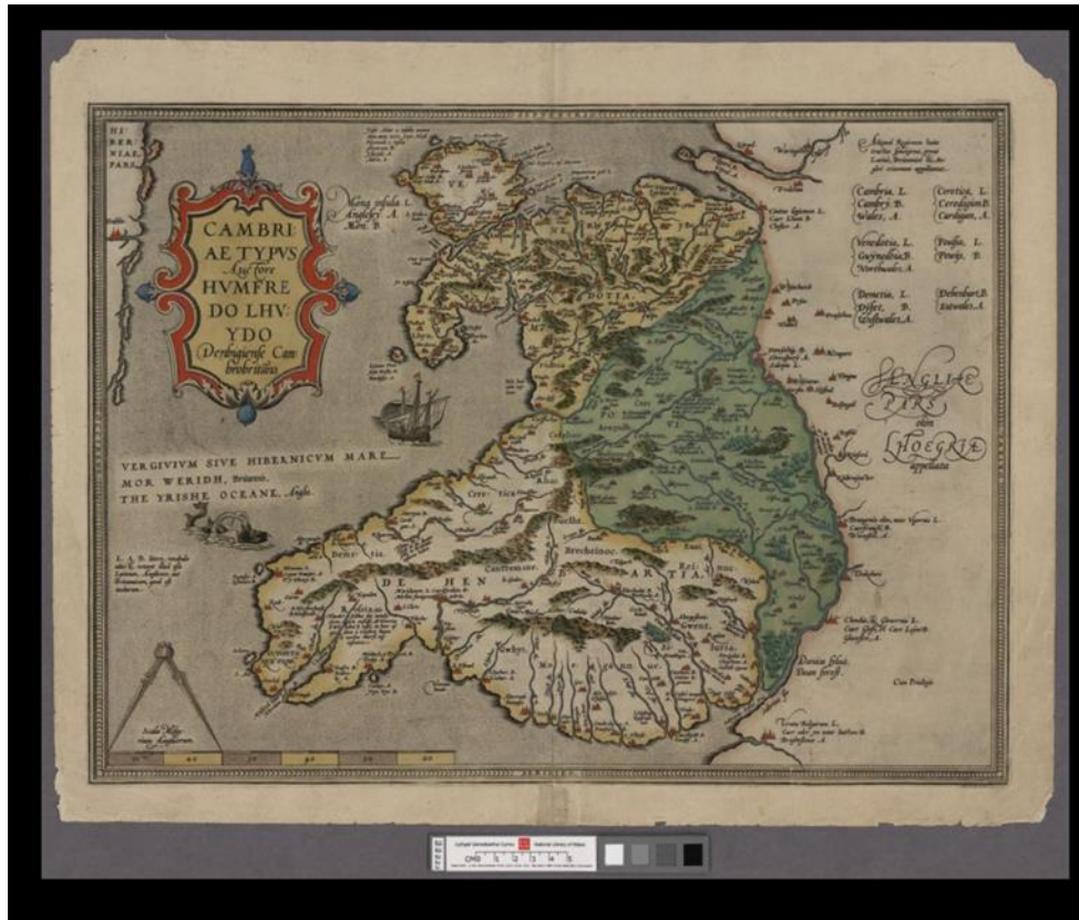
Ffigwr 1: Cambriae Typus

Mhrydain. Roedd siaradwyr Cymraeg o hyd yn cael eu magu ganrif yn ddiweddarach, canys i un o ddisgynyddion Humphrey Llwyd, Edward Llwyd gael ei eni a'i fagu yn Swydd Amwythig.