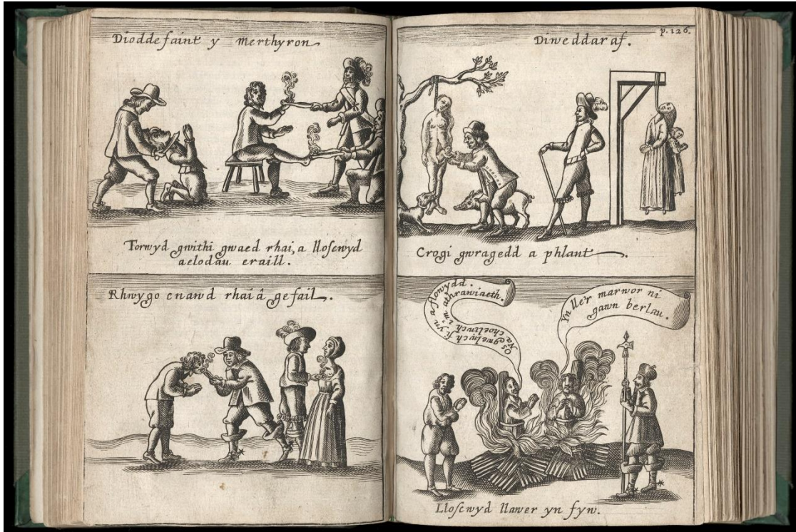
Ffigur 3: Dioddefaint y merthyron diweddaraf (tt. 126–7)

Di a gei yn y llyfr hwn wyth o ddalennau â lluniau arnynt, y rhai ni fwriedais it tuag at addoliad, megis y gelli ddeall wrthynt; na thrwy'r un awdurdod ac y lluniwyd Jerusalem ar bridd-lech , Ezech. 4.1. ond er arfer naturiol, fel y mae'n gynnefin ym mysc cenedloedd eraill ( ibid. ).